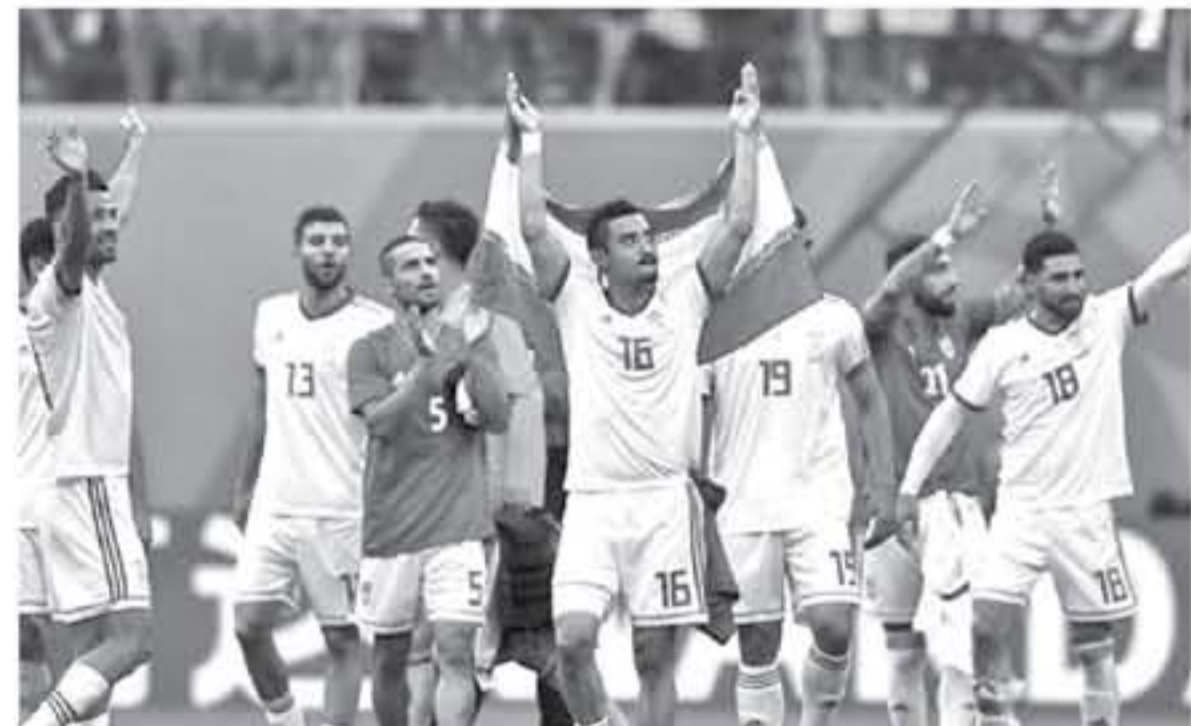
أبو ظبي - وكالات

يفتح استاد هزاز بن زايد أبوابة لاستضافة مباراة نصف النهائي الأولى لكأس آسيا 2019 والتي ستجمع بين منتخبي هوزين ومرشحين بقوة لقب هما إيران واليابان. أوقعت فرصة دور مجموعات البطولة الأهم في المباراة الصفراء في المجموعة الرابعة رفقة العراق وفيتنام واليمن، ونجحوا في تصديها والتأهل على حساب الرفقاء بعد جمع 7 نقاط من انتصاري وتعاديل مع أسوء الرفاقين. ثم قابلوا عمان في دور النصف وانتصروا عليها بهدفين نظيفين. وفي ربع النهائي كانوا على موعد مع مواجهة صعبة ضد الصين حولها لبارز في التنازل والتصميم اللتين بالثلاثة. وقت اليابان في المجموعة السادسة والأخيرة في كأس آسيا 2019 رفقة أوزبكستان وعمان وتركمنستان. ونجحت في الحصول على العلامة الكاملة 9 نقاط من 3 انتصارات وتأهلوا للدور الثاني، والذي قابلت فيه السعودية القوية والفضية بشانها وتخطتها بهدف نظيف. وفي ربع النهائي أسقط السامواري فيتنام بهدف نظيف أيضا وضهم في مواجهة إيران في نصف النهائي. علق شراء وأعلن تذاكر مباراة إيران ضد اليابان خصصت للجنة المنظمة لكأس آسيا 2019 مولعا أكثروريا لشراء التذاكر من خلاله. ويملكه الدول عليه مباشرة واختيار معدك في مدرجات استاد هزاز بن زايد لثلاثة الألف. أضغط هنا للدخول مباشرة إلى موقع بيع تذاكر مباراة إيران ضد اليابان. هناك 3 ألاف أسعاف التذاكر في ضمن نهائي البطولة هذا العام، الفئة الأولى والأقل سعرا هي الدرجة الثالثة والتي يكلف المقعد فيها 50