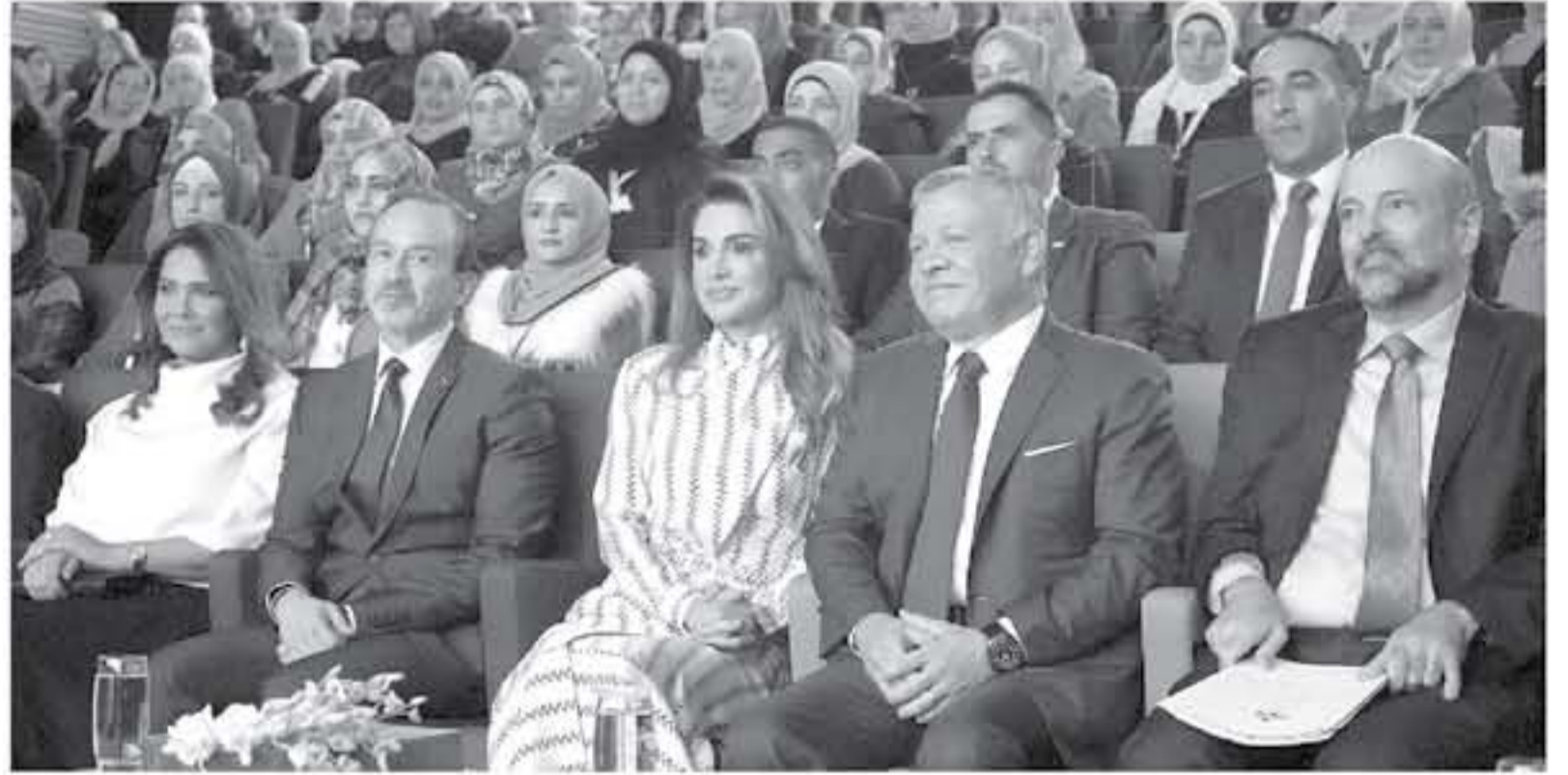
عمان - الأنباط - بتر