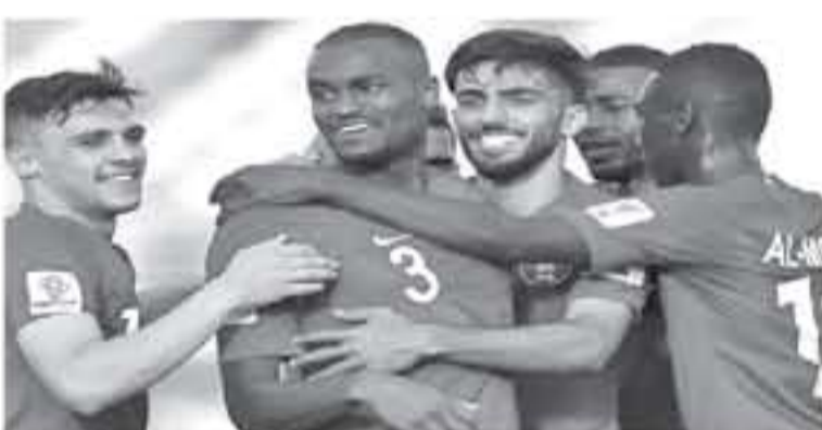
أبو ظبي - وكالات

بهذا الإنجاز. وقال إنه يرغب بتحقيق فريقه المزيد من التاريخ في هذه البطولة، بداية من الدور قبل النهائي الثلاثة، في مواجهة الدوحة الخفيفة الإمارات. وأضاف مهاجم فريق الذبيل في تصريحات للوفد الرسمي للاتحاد الآسيوي لكرة القدم: "نحن فخورون بهذا، علينا أن نشكر اللاعبين لتفانيهم جميع تعلماتهم. نأمل ألا نتوقف عند الدور قبل النهائي ونستمر في تجاوز ذلك".