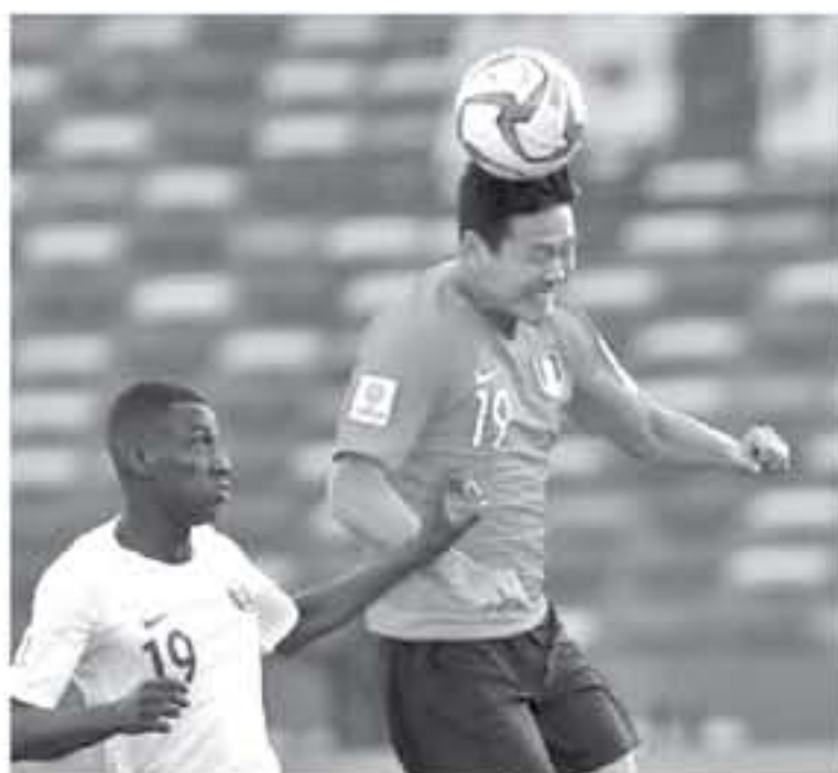
ابوظبي - وكالات

العمرية المختلفة ، فإن متصدر هدافي البطولة ، المعز علي ، من قطر ، كان هداف كأس آسيا تحت 23 عاماً أيضاً ، وحظيت منتخبات "فيتنام ، وتايوان ، والأردن ، وفيليبين" بشهدير مجموعة التحليل الفني ، نتاجها في إثبات قدراتها على المستوى القاري ، وأشارت المجموعة إلى أن 133 من الأهداف تسجلت في البطولة القارية ، جاءت من كرات ثابتة ، وبعد ختام كأس آسيا 2019 ، سيتجمع المدربون من كل الاتحادات الأعضاء ، في الاتحاد الآسيوي لكرة القدم ، في مؤتمر المدربين بكوالالمبور ، لتابعة نتائج تحليل مباريات البطولة ، كما سيتم مشاركة النتائج مع مؤتمر تطوير المدربين في الاتحاد الآسيوي ، الذي سيعقد في نيسان/ أبريل المقبل ، ويأتي ذلك ، وفق رؤية الشيخ سلمان بن إبراهيم ، رئيس الاتحاد الآسيوي ، في الاستثمار أكثر بتطوير الأجيال الفنية للتحديات القارة .