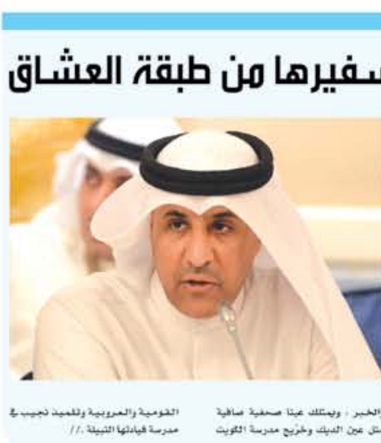
والخبر - ويمتلك عينا صحفية صافية مثل عين الديك وخروج مدرسة الكويت الحكومية والعربية وتلميذ نجيب في مدرسة قيادتها التبية. //