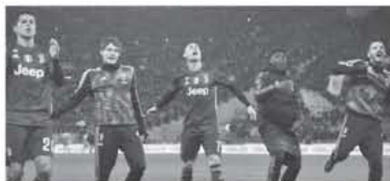
روما - وكالات

وتابعت ، "أتالانتا ، عودة لا يحلم بها" ، من 0-3 إلى التعادل 3-3 مع روما ، وإيطاليا لا يتوقف ، وختمت ، أورو العالم ، أخيراً هزمو ناد كيرير بإدرا رائع هدف من إنزو كان حاسماً ، أورينو بسقط إثر ملان قال جورجيو كيني ، منافع يوفنتوس إن فريته قدم أسوأ ساعة له هذا الموسم ، خلال الفوز على لاتسيو (0-1) ، بالجولة 11 من الدوري الإيطالي ، وأرضع كيني ، في تصريحات