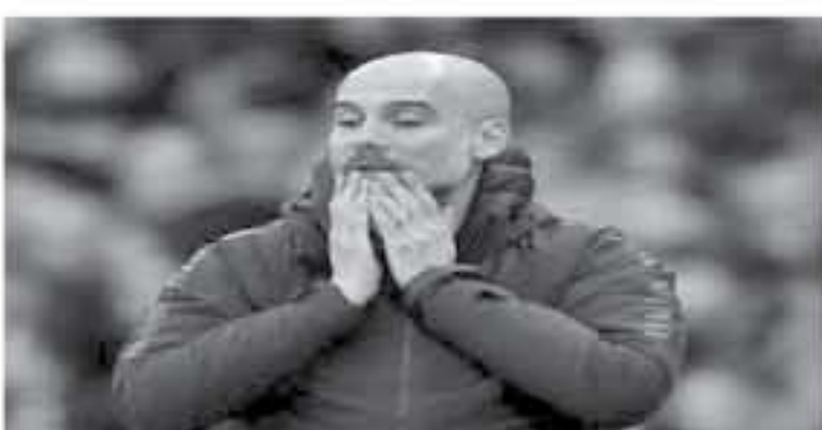
لندن - وكالات

الإسباني "هذه الفرق هي الأفضل ، لأنهم يتوجون أبطالاً في دوريهم كل موسم ، ويهزمون بطلب على الأقل كل عام ، لأنهم الأفضل" . وتجاهل جوارديولا ذكر ريال مدريد الإسباني ، رغم تشويحه بطلب دوري أبطال أوروبا في آخر 3 سنوات على التوالي ، وأردف "أنا أأحدث عن الجانب الأصعب ، الفوز بطلب أو اثنين كل عام ، والاستمرار في ذلك لفترات طويلة ولعدة 10 سنوات ، هذا ما احترسه ويعجبني