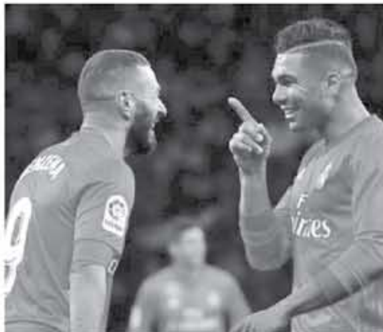
مدريد - وكالات

يهمة سيميدو وميسي" ، كما نظرت وجرولاً ، وعنوان "التصدر السعيد" ، وأكدت "البارسا كان حاسماً في زيارته لقلب مونتيبلني ، بعد الفوز على جيرونا