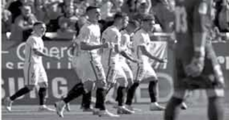
مدريد - وكالات

تهابة الموسم ، مع خيار الشراء ، وأضافت أن العقبة الأساسية ، كانت في قيمة خيار الشراء ، الذي سيصل إلى نحو 20 مليون يورو ، وأكدت الصحيفة أن روج ، قد يساهم إلى برشلونة لمواجهة البلوجرانا ، في كأس الملك ، وكانت مباراة الذهاب ، قد انتهت بفوز الفريق الأندلسي ، بهدفين دون رد ، بأبغبارة التي شهدت غياب الأرجنتيني ليونيل ميسي .