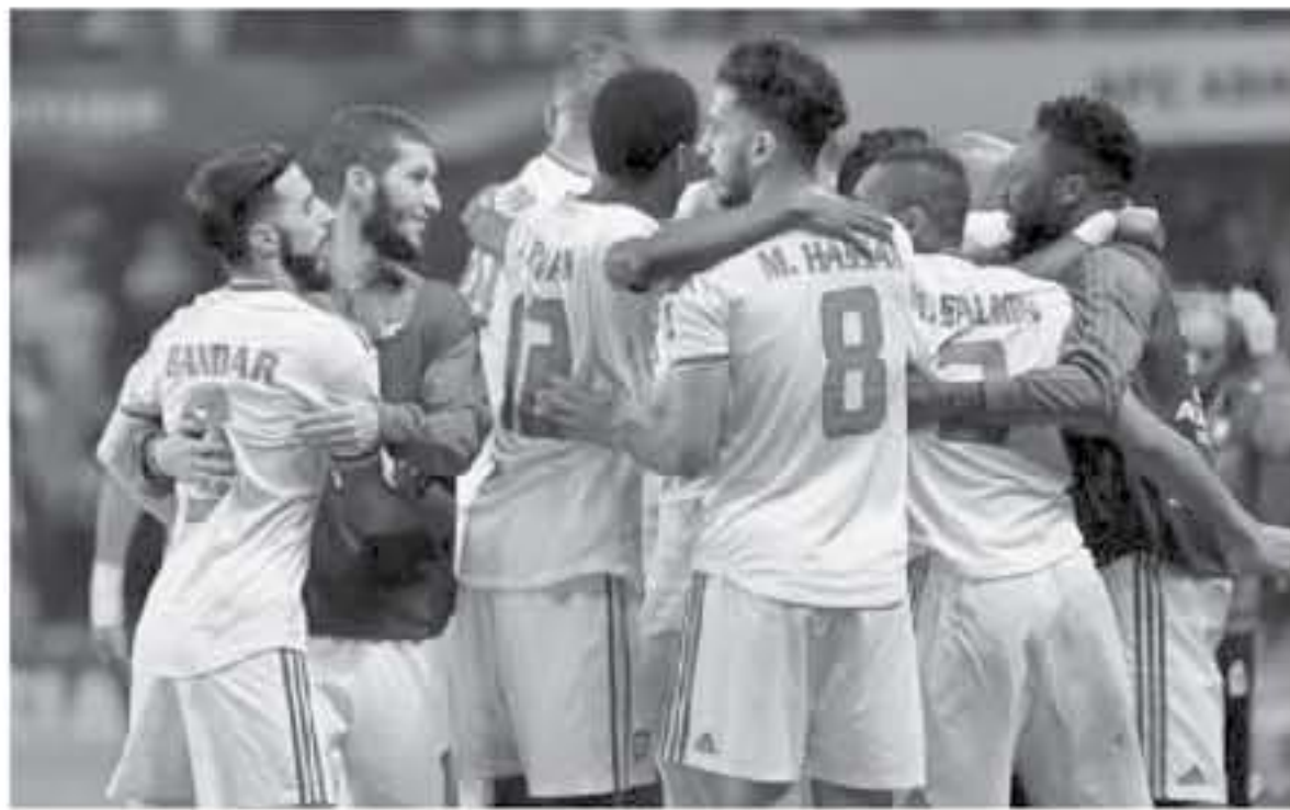
ابوظبي - وكالات

السابقة ، عام 2018 بأستراليا ، وسيصبح أول لاعب في تاريخ المسابقة ، يسجل 5 أهداف في نسختين متتاليتين ، في حال هز شبك قطر . وكانت الإمارات قد حققت الفوز على قطر ، في آخر 3 مواجهات مباشرة خاصة الانتصار (1-0) في بطولة آسيا 2018 ، عندما أحرز مبخوت هدفين .