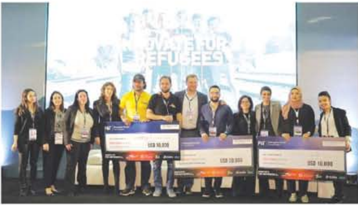
يشكل جيد على أبرز فئات المسابقة المتمثلة في الاحتياجات الأساسية، والرعاية الصحية، والتعليم.