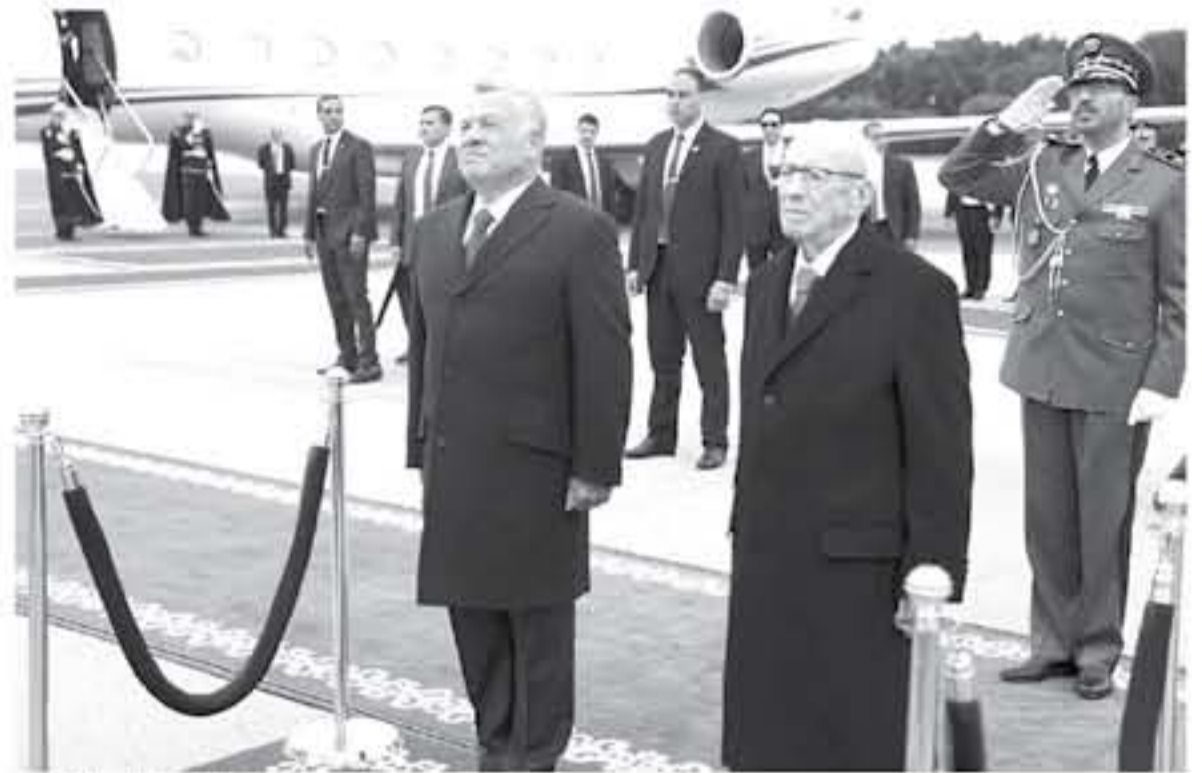
الرئيس التونسي خلال استقبال جلالته

في العام ٢٠١٦، وأهمية تشجيع القطاع الخاص الأردني والتونسي للاستفادة من الاتفاقيات الموقعة بين البلدين. وأكد جلالته الملك ورئيس الوزراء التونسي الحرص على إدامة التنسيق والتشاور بين البلدين حيال مختلف القضايا ذات الاهتمام المشترك. كما أعاد جلالته الملك التأكيد على حرص الأردن على نجاح أعمال القمة العربية المقبلة التي تستضيفها تونس الشهر المقبل، وبما يخدم القضايا العربية المشتركة ويسهم في تفعيل العمل العربي المشترك، وإيجاد حلول سياسية لأزمات المنطقة. وحضر اللقاء مستشار جلالته الملك مدير مكتب جلالته، والسفير الأردني في تونس، فيما حضرها من الجانب التونسي وزير الخارجية، والمستشار الدبلوماسي لرئيس الوزراء.