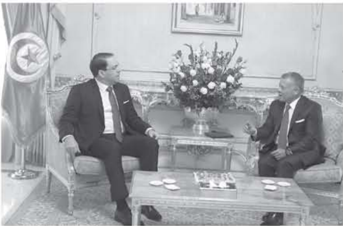
وجلالته يلتقي رئيس الوزراء التونسي