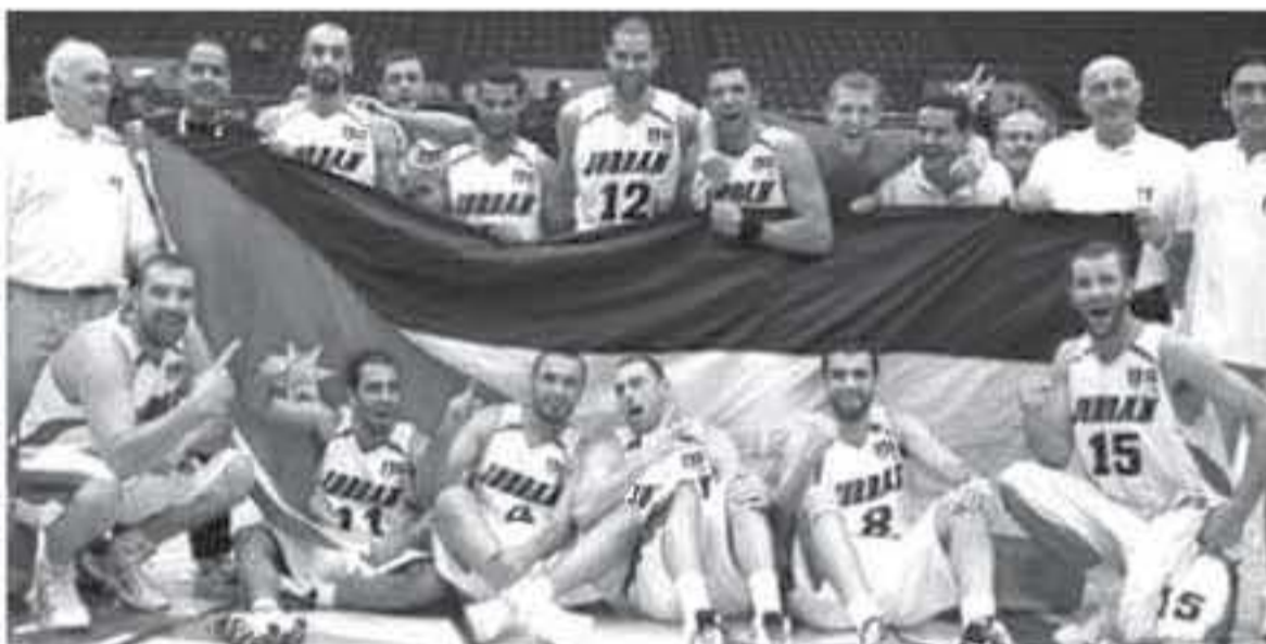
دبي - متبر طلال مؤيد اتحاد الاعلام الرياضي

تعرض أمس المنتخب الوطني لكرة السلة لخسارة جديدة في بطولة دبي لكرة السلة أمام الرياض اللبناني التي أقيمت في مساء الأحد في دبي. ويلتقى "صقور الأردن" مع بيروت اللبناني عند الساعة مساء اليوم بتوقيت عمان لحساب المجموعة الثانية للبطولة في ختامها ٣٠. والتي تستمر حتى ٩ الحالي بمشاركة ١٠ فرق.