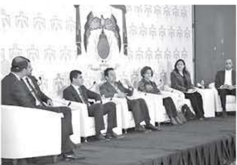
الإنباط - عمان

أكد وزير الشغافه ووزير الشباب محمد ابو رمان ان الشباب الارثني يحظى برعاية ملكية سامية وجهت الحكومات المتعاقبة بوضع الشباب على سلم الاولويات الوطنية ودعم قطاع الشباب والتهوض به. وأضاف خلال المؤتمر الصحفي الذي نظمته وزارة الشباب والحديث حول البرامج والخطط الشبابية لعام ٢٠١٩. بحضور رئيسة لجنة الحوار الوطني الشبابي العين رابحة الدباس ورئيس لجنة الشباب والرياضة في مجلس النواب محمد ابو هديب وممثلين عن صندوق الملك عبدالله الثاني للتشجيع ومؤسسة ولي العهد. اضاف ان العمل الشبابي مسؤولية وطنية تتطلب الشراكة والتشبيك مع كافة المؤسسات الرسمية والمنظمات الدولية والمحلية. وقال ابو رمان اننا ننظر للشباب منظور الفرصة والطاقة المنتجة وان دورنا كوزارة يتمثل في خلق البيئة المناسبة والظروف المواتية لتلبية متطلبات واحتياجات الشباب. مؤكدا ان المراكز الشبابية هي مساحات شبابية صديقة وداعمة للشباب لاقتنا الى ان اولويات الوزارة في المرحلة الحالية تكمن في تفعيل المراكز الشبابية وتأهيل العاملين مع الشباب وتوجيههم كمتسرين للانشطة والفعاليات للشبابية، الى جانب الشراكة والتشبيك ما بين الوزارة والمؤسسات العاملة مع