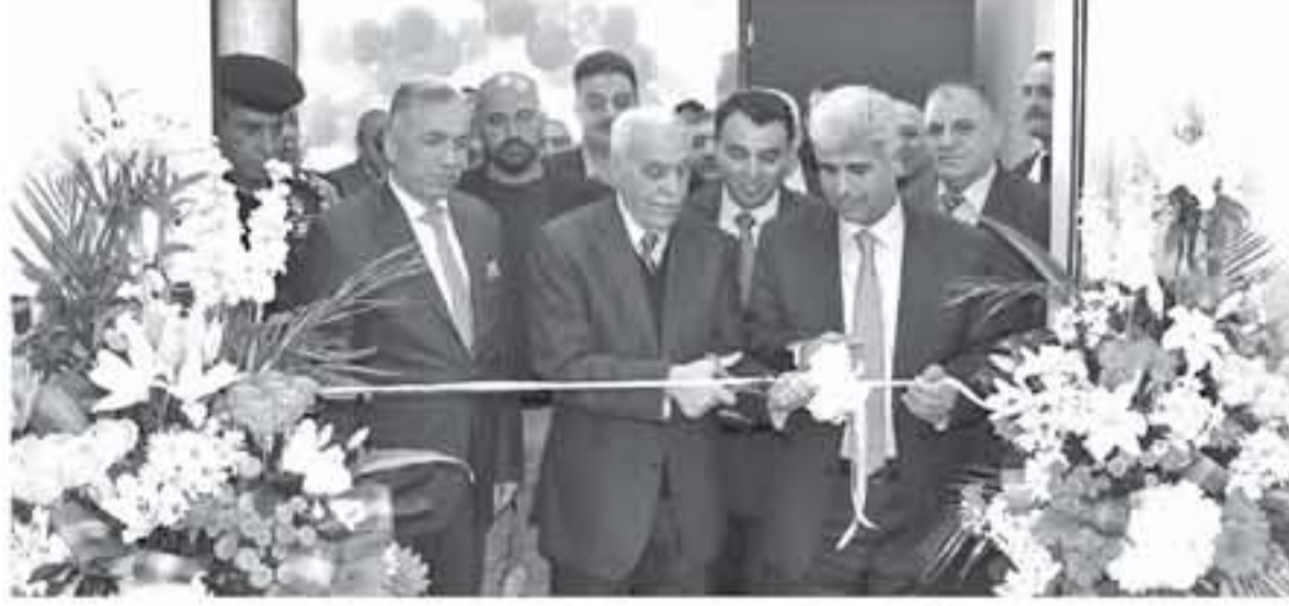
الانباط - الزرقاء

أما بيئياً، فإن قلق دول العالم معروفة اليوم فيما يتعلق بأثر تصدير الكهرباء على البيئة. فكم ستكون فرحة إسرائيل عظيمة إذا أنتجت الكهرباء عندنا بحرق الغاز الذي نشتره منهم وتوليت البيئة في بلادنا من ماء وهواء وتربة وطبيعة حيّة وبيئة مثيلة بينما هم يأخذون كهرباء نظيفة حسب حاجتهم. اتفاقيتنا معهم للغاز الفلسطيني المنهوب يأتي تحت شعار "ادفع ثمن الغاز سواء أخذته أم تركته" بينما هم يستهلكون حاجتهم متى استدعى الأمر. أما الكهرباء النووية فهي أسوأ لأن مخاطرها التلوث الإشعاعي ستكون على أرضنا وفي مياهنا وهوائنا لمد بعيد لن نسلم منه الأجيال القادمة، وإذا حدثت كارثة فاشحاطر عندنا سوف تستمر إلى ما شاء الله بينما هم يتعمون بالكهرباء النظيفة في الكيان الغتصوب أو في أوروبا وعند الحاجة. //