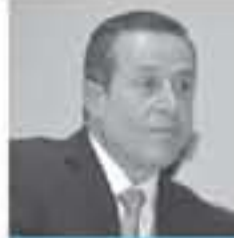
د. خليل أبو سليم

يبدو أن الرزاخ ما زال مرسا على أن لا يتحرك الرابع قبل أن يزرع كل محاسبه ومعارفه في كافة مفاصل الدولة، والذي يبدو أيضا أن دولته ما زال يمارس الاستقبال والاستغفال على شعب بات يحفظ عن ظهر قلب كل الاقوال التي يشتمق بها في حله وترحاله عن سيادة القانون والمعادلة الزعومة وتكافؤ الفرص والنزاهة والشفافية. في مقال سابق قلت أن الرئيس التقدر عدة شهور حتى ينهي احد أسدقائه مشوار عمله في الخليج العربي، وبقي محتفظا له بموقع شاعر لمدة زادت عن الأربعة شهور، ثم أجرى مقابلات وحمية ولا أساس لها من الصحة، وفي نهاية الأمر لم يكن ولن يكون إلا ما أراد الرئيس، ألا وهو تعيين صديقه في منصب مدير عام الضمان الاجتماعي اليوم يطل علينا دولته من نفس التنافذة وبيباغتتنا بحملة من التعيينات تحمل أنفاس التفضية والتوصية التي يدعي محاربتها، ويبدو جليا أيضا أنه ما زال مستمعا بتلك التمييزية التي يعزف على أوتارها، ليقابلنا بدفعة من التعيينات الخرافية - وأرجو أن لا تكون محفظة بعض الحروف - في خمسة من المواقع القيادية، والمزاد ما زال مفتوحا للمزيد من التعيينات. سبق ذلك كله تعيينان وزاريا حملتا نفس الأنفاس، غير عابن بما يقال عنه في الشارع وضاربا عرض الحائط بكل القيم التي يتغنى بها، ولعله سجل سابقة تاريخية في السياسة الأردنية عندما أكمل مسيرة من سبقوه وقام بإلقاء وزارته بعد إنشائها من أجل أن يتولا أمرهما من الهابطين علينا بالفتلات، وحتى يثبت الرئيس أن لا غش له عن تلك الوزيرة اسند لها وزارة السياحة.