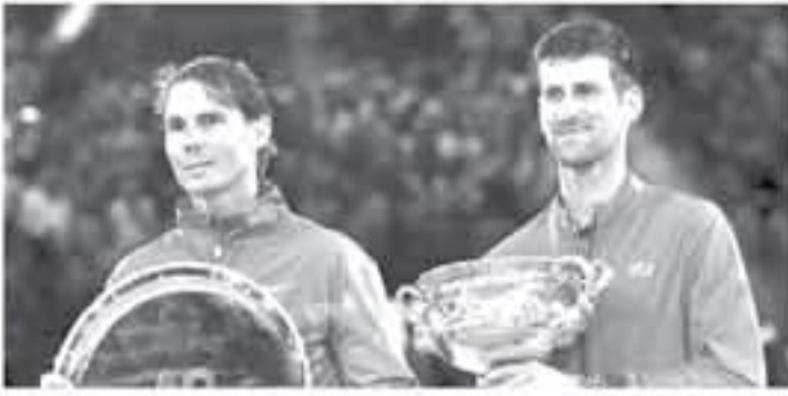
عواصم - وكالات

الإسباني نفسه، وسبق له "تولي" التتويج بلقب ميامي 6 مرات من قبل، لعادل رقم الأمريكي أندريه أجاسي، رغم أنه سقط في مباراته الأولى، بالمضي، والثاني من البطولة، في العام الماضي، وسيشارك في البطولة المصنفة الـ 10 الأولى عالمياً، بحضور السويسري المخضرم روجيه فيدرر والأرجنتيني خوان مارتن ديل بوترو، الذي سقط العام الماضي في نصف نهائي البطولة على يد التتويج بلقب، الأمريكي جون إيسنر، وبمناصات المصنفة، ستكون اليابانية نومي أوساكا، المتوجة بأكثر من 10 مليون دولار، وستكون معها الأمريكية سلوان ستيفنز، حاملة اللقب، ومقاتلتها الخضراء، سيرينا ويليامز، المتوجة بميامي ثنائي مرات من قبل، كما ستشارك أيضاً الشيفقة الكبرى لسيرينا، فينوس ويليامز، والتشيكية بيترا كيتشوكا، والمنتجة الثانية عالمياً ستانفيلد، البطولة يوم 18 مارس/ آذار المقبل، وتستمر حتى نهاية الشهر.