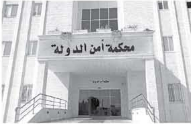
وقررت النيابة العامة لمحكمة أمن الدولة احالة المتهمين المذكورين بالتلازم للمحاكمة امام محكمة أمن الدولة عن تهم جنائية قبول الرشوة لقيام بعمل غير حق وجنائية تقديم رشوة للقيام بعمل غير حق او الامتناع عن القيام بعمل من

اعتدت النيابة العامة لمحكمة أمن الدولة لائحة الاتهام النهائية بالقضية التحقيقية رقم ١٠٠٦٨ / ٢٠١٨ / ن فيما يعرف بقضية الدخان ، واتهم المسددة للمتهمين في القضية المتطورة أمام محكمة أمن الدولة . وكانت النيابة العامة لمحكمة أمن الدولة صادقت يوم اول امس على قرار التلن الصادر عن مدعي عام محكمة أمن الدولة فيما يعرف بقضية الدخان والتي اسند فيها للمشتكى عليهم في القضية تهم، جنائية القيام بأعمال من شأنها تعريض سلامة المجتمع وامنه والموارد الاقتصادية للحخطر و جنائية القيام بأعمال من شأنها تغيير كيان الدولة الاقتصادي او تعريض اوضاع المجتمع الاساسية للحخطر .