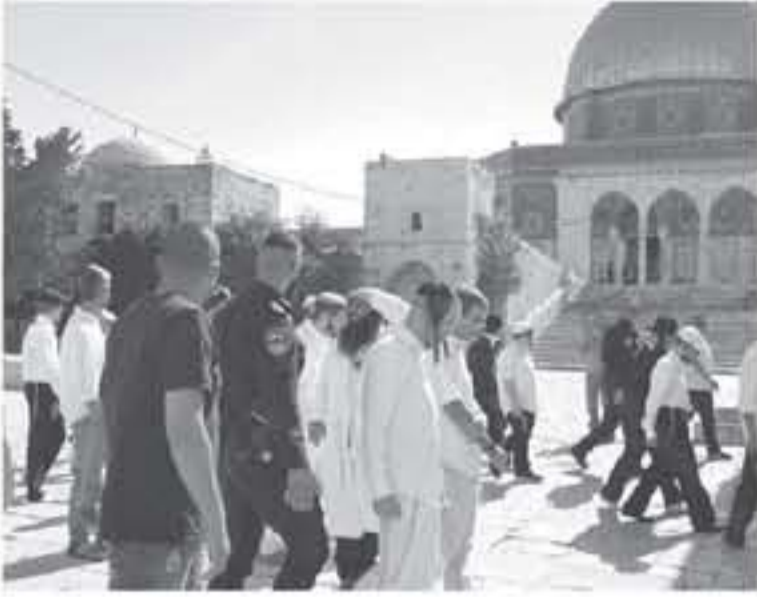
القدس المحتلة - صفا

وأدى بعضهم عشوائياً وتعمدياً في الجهة الشرقية للأقصى، لافتاً إلى أن ٦ موظفين بحكومة الاحتلال اقتحموا ساحات الأقصى أيضاً. وشددت شرطة الاحتلال من إجراءاتها على أبواب الأقصى، واحتجزت بعض هويات المصلين، ودققت فيها، وسط انتشار عناصر الشرطة في داخل المسجد وخارجه، ورغم الأجواء الماطرة إلا أن عشرات المصلين من القدس والداخل الفلسطيني احتلوا توافدهم للأقصى، وانتشروا في أروقته ومصلياته لقراءة القرآن الكريم، والتسبب في اقتحامات المستوطنين واستفزازاتهم المتواصلة. ويشهد المسجد الأقصى في الأونة الأخيرة تصعيداً ملحوظاً في أعداد المستوطنين ومسؤولي وقادة حكومة الاحتلال الفتحمين للمسجد، في ظل قبوه الإسرائيلية مشددة مفروضة على الفلسطينيين.