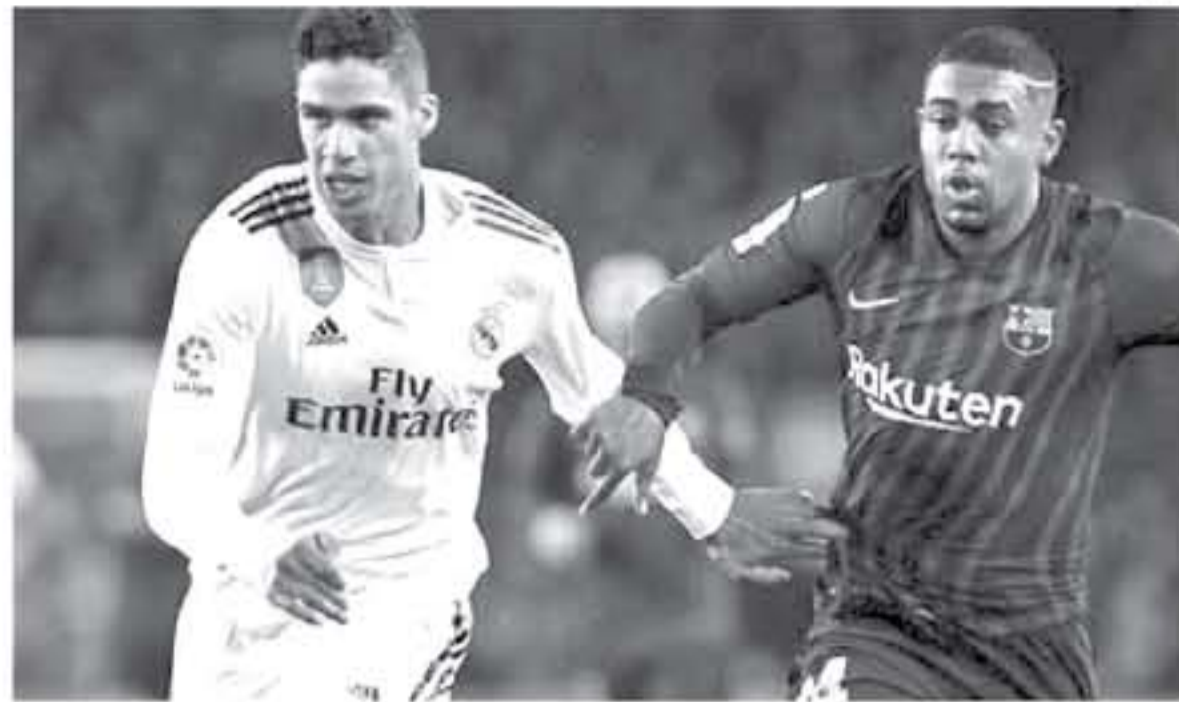
برشلونة - وكالات

من ريال مدريد، وتشاب هيرنانديز من برشلونة، برصيد 12 مباراة لكل منهما، ورغم أن راموس يلعب في خط الدفاع إلا أنه نجح في تسجيل 4 أهداف بقميص ريال مدريد في الكلاسيكو، بواقع هدفين في ملعب "سانتياجو برنابيو"، وثلثهما في "كامب نو"، ويقتلي الفريقان في إياب نصف نهائي كأس الملك، على ملعب سانتياجو برنابيو، يوم 27 فبراير/ شباط الجاري.