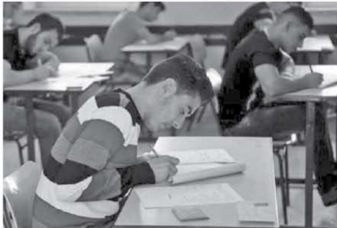
مبحث بعد استئصال الدورات الأربع التي لني السنة النظامية.

للامتحان دون رسوم لأي مبحث لأربع مورات متتالية بعد الدورة النظامية، مقابل 20 ديناراً كرسوم للدورة الامتحانية، فيما يدفع المتقدم للامتحان رسوماً مقابل كل