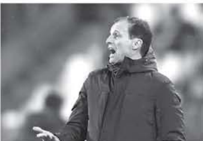
رويا - وكالات

أن يكونوا جديدين وإدارة أنفسهم داخل التيم وخارجها. نحن في مرحلة مهمة من الموسم. لذلك يجب أن يكون الجميع في أفضل حالاتهم البدنية والعقلية. ويسعد بونفانتوس مواجهة نظيره ساموئل. مساء اليوم، ضمن نشاطات الجولة الـ 33 من الدوري الإيطالي. وأكمل مدرب البوية. وأحد من دييالا وأوبرنارديني هومن سيردا. ورافال بيلغوي دي تشيلو بجانب روجاني وكامبرين وساندرو. كاشيو قد يكون تعبيراً رائعاً خلال أحداث المباراة حتى في البداية. وأردف، "أخبرني ساهب مع بيرلديسي. وفي حال قصرت الدافع بدييالا بدلاً من بيرلديسي. سيكون هناك إيجري بشأن أمر بنتلتور. فيما سيغزو تشيلزي إلى حراسة الرمز.