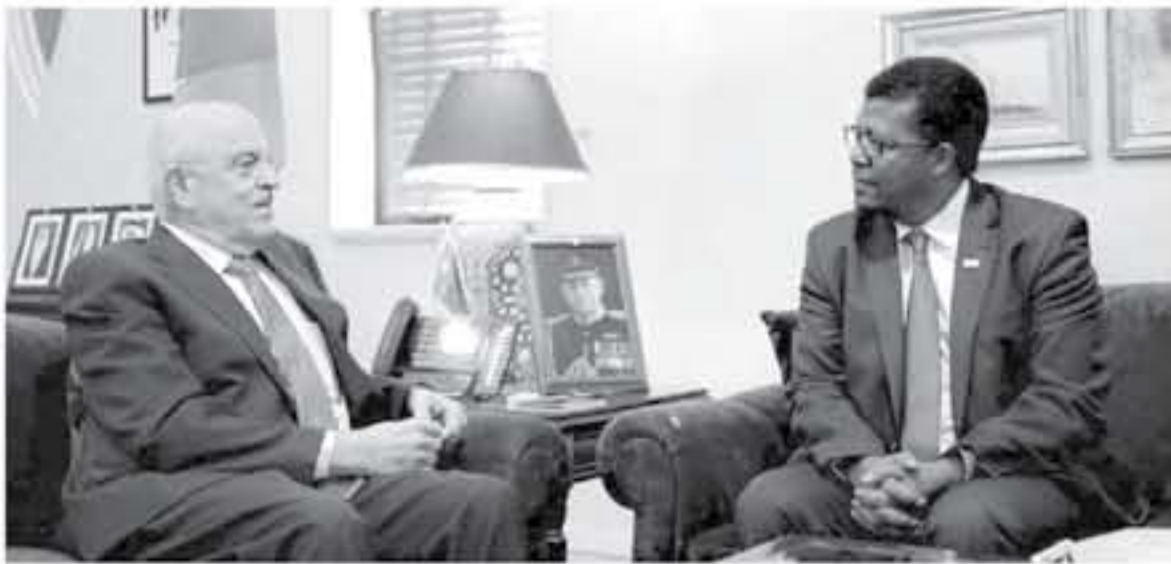
عمان - بترأ

وفي السياسة ليس مهم ان يكون صدرك واسعاً المهم ان يكون ضميرك واسعاً وفي السياسة لا تقال كامل الحقيقة بل نصفها اي ان الدهاء السياسي يستلزم مواهب وهدرات مثل سرعة البديهة وقراءة الواقع جيداً واستشراف المستقبل والاختلاط والتاسب مع الفئات المعنية ، كذلك فان الشجاعة بلا دهاء مثل رجل يساق واحد ولقد كان دهاء العرب اربعة كما اخرج ابن سناكر عن الشعبي وهم معاوية ابن ابي سفيان وعمر بن العاص والمغيرة بن شعبة وزياد بن ابيه ، وكان لكل واحد منهم اختصاصه فمعاوية ابن ابي سفيان والثني مقلوته الشهيرة ( شعرة معاوية ) في اسلوب التعامل مع الآخرين لاحتواء غضب الآخرين وكسبهم ، وكان يتمتع ( بالعلم ) في سياسته ( والقدرة ) ولقد كان له نظرية في حكمه وهي ( اني لا اضع لساني حيث يكفني مالي ولا اضع سوطي حيث يكفني لساني ولا اضع سيطي حيث يكفني سوتي فلما لم اجد من السيد بدا ركبته ) فهو يعتبر ان القوة والعنف والشدة والبطش لا تليد في التعامل مع البشر . وعند الرد على الاساءة في مثلها ليس صعباً بل قوة ، أي ان ادارة شؤون البلاد من خلال الوزراء والمسؤولين في الحكومات يجب ان يتسموا بالعلم مواصفات الدهاء والحلم والحنكة والقدرة وان يفضي هناك قنوات اتصال وتواصل مع كافة طبقات المجتمع صغيراً وكبيراً فحيراً وغنياً حتى يكون هناك الولام والانسجام والقرار المشترك وتحقيق الامن والامان والاستقرار . / /