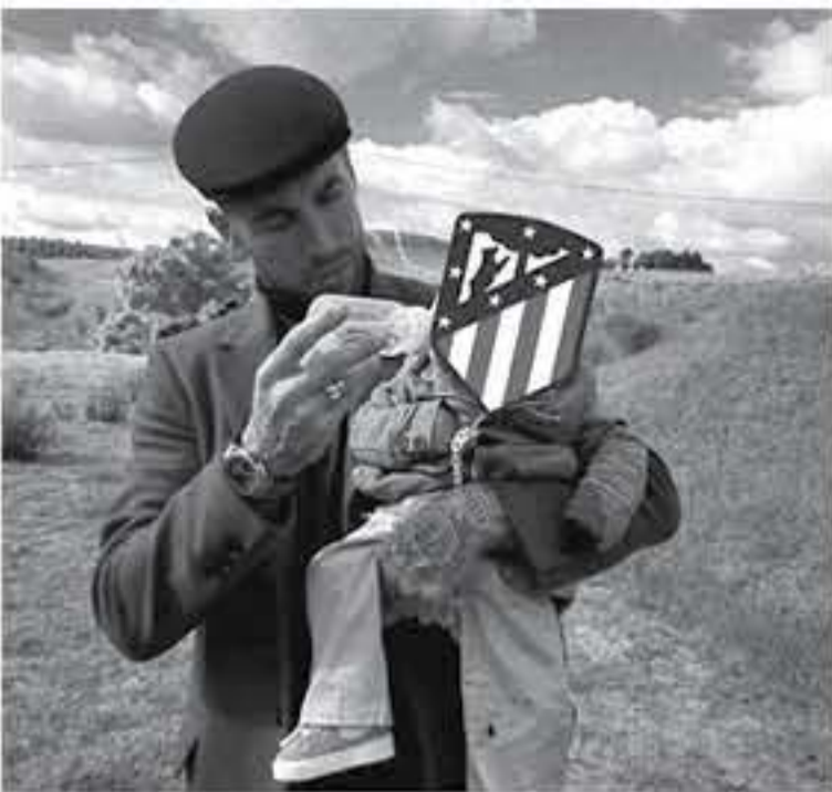
Le gusta a sergioramos y 736 personas más... sergismine Just take the L... #sergioramos #atleticomadrid