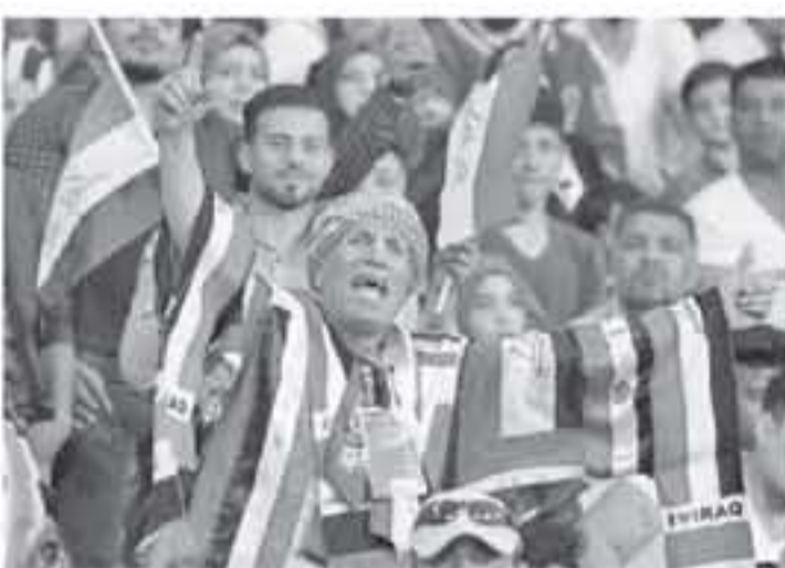
الابتعاد - وكالات

مجموعة من الاتحادات، لتسمية طواقم لتخمينة للبطولة، كما سيتم تخصيص موقع إلكتروني لأخبارها، ويتكون شعار البطولة من 3 أشخاص مترابطين، وهو ما يدل على عمق العلاقة بين البلدان المشاركة. وقد حضر في النسخة الأولى 3 منتخبات وهي العراق، وسوريا، وفلور، وتوج بها العباسي بعد فوزه على أصحاب الأرض (1-3)، وتعادله مع سبور قاسيون (2-2)، وانتهت المباراة الثالثة بين العراق وسوريا بالتعادل (1-1)، وتم اختيار لاعب منتخب قطر، بسام الراوي، كأفضل لاعب في البطولة، بينما توج زميله أكرم عفيف هدافاً لها، برصيد 3 أهداف.