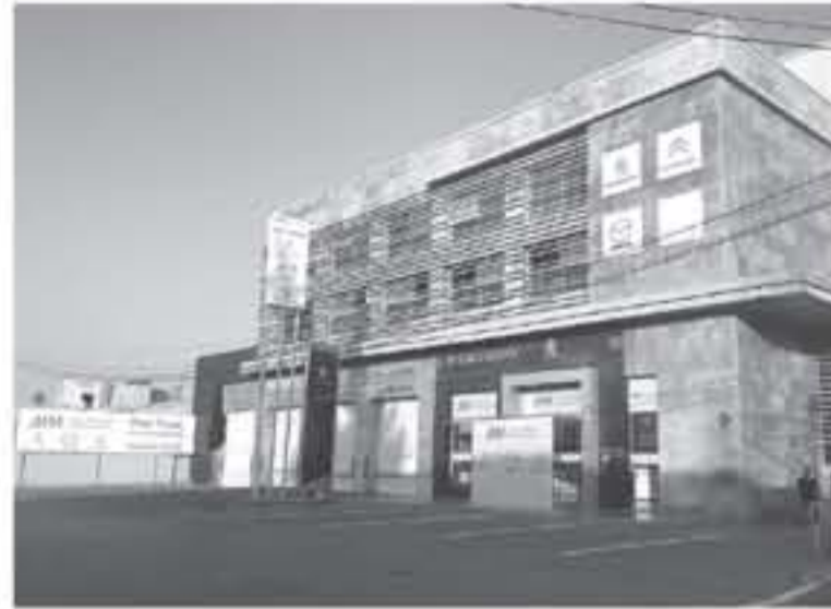
المكان، مما يؤكد تناهية الشركة على صعيد السوق المحلي. وتطبيقاً على هذه الحملة أكد السيد

يذكر أن العرض يشمل جميع فروع مراكز قطع الغيار AKM في عمان، ومراكا الشمالية وإربد، إذ بإمكان زبائن الشركة الإستفسار والإطلاع على العروض من خلال الإتصال على رقم مركز خدمة الزبائن على الرقم 0677777777 أو زيارة موقع الشركة الرسمي www.akm.jo