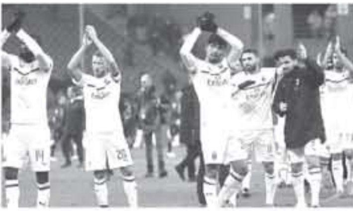
ميلان - وكالات

أوروبا، فإن ليوناردو سمارغا يشراء عقد الفرنسي ليموي ياكوبوكو من تشيلسي بالإضافة إلى التعاقد مع الصربي سيرجي ميليتوفيتش سافيتش من لانسو، وأوضح أن الملاعب الصربي يندر ثمنه بـ140 مليون يورو، ومن المنتظر أن يجد ميلان منافسة قوية على الصفقة من قبل يوفنتوس وباريس سان جيرمان. يذكر أن ميلان يحتل حالياً المركز الرابع في جدول ترتيب الدوري الإيطالي برصيد 34 نقطة.