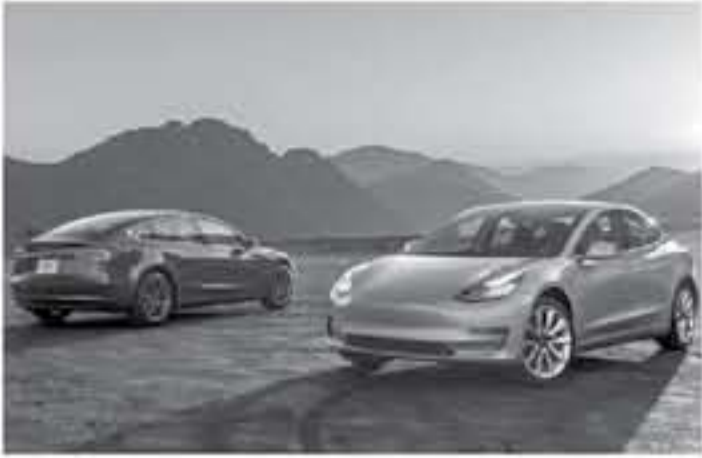
دبي - محمد جني تي

عالمي كبير، حيث تم بيع حوالي 110 ألف نسخة منها وباتت تعتبر من أفضل السيارات التنبؤية مبيعاً في الولايات المتحدة لعام 2018 الماضي. وكما هو الحال مع سيارات تسلا، تجمع موديل 3 بين الأداء المميز والسلامة العالية والتكنولوجيا المتقدمة والقدرة على قطع مسافات طويلة بالتحفة الكهربائية الواحدة ويساهم التصميم المتكامل للسيارة في تعزيز المساحة الداخلية ليمكثها من نقل 4 أشخاص بالعين على منها، ويتيح الحركة الكهربائي القوي للسيارة التسارع من صفر إلى 100 كم/س (61 ميل/س) خلال 3.5 ثانية لنسخة الأداء الأعلى.