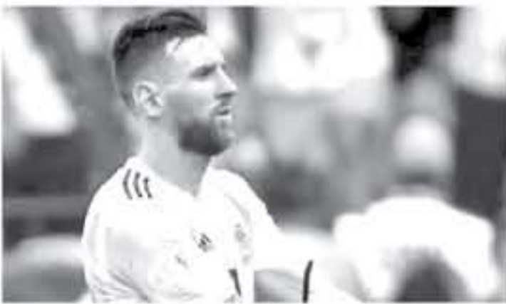
عواصم - وكالات

الثاني، ويحفظ الاتحاد الأرجنتيني لمواجهة فنزويلا على ملعب "وانا متريبوليتانو" بالعاصمة الإسبانية مدريد ثم مواجهة المغرب في المار البيضاء، مارس/ آذار المقبل وديا وكالات العديد من التقارير غير الرسمية، خرجت في الأيام الماضية، لتؤكد اقتراب عودة ميسي لتشغيل الأرجنتين قبل بطولة كوبا أمريكا 2019، الصيف المقبل. ونهائس الأرجنتين، المسماة لإنهاء صياحها عن لقب كوبا أمريكا منذ 1993، ضمن المجموعة الثانية لبطولة كأس كوبا أمريكا المقرر إقامتها الصيف المقبل في البرازيل، بجانب كولومبيا وباراغواي وفلور.