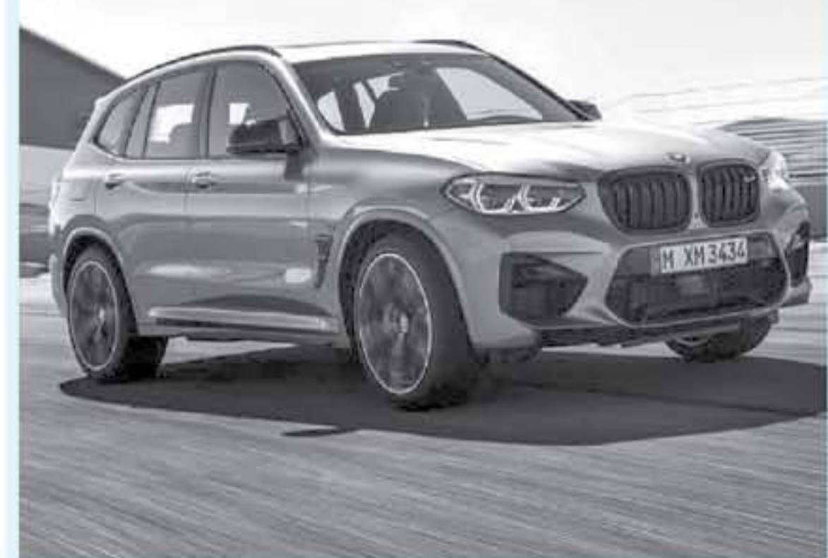
دبي - محمد جني تي

استغلت شركة بي ام دبليو التافارية الانترنت ليم الكشف عن سيارتي بي ام دبليو X3 M 2020 و بي ام دبليو X4 M 2020 بشكل رسمي أحدث سيارات بي ام دبليو ام بور - BMW M Power 2020.