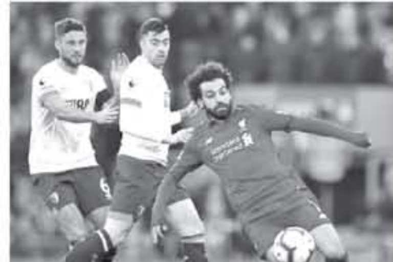
روما - وكالات

كشفت تقارير صحفية إيطالية عن هدفين ليوفنتوس، بيلغان وراه وغبته في ضم نجم ليفربول، محمد صلاح. فقد ذكر موقع "توتو ميركاتو" أن مبادلة ياولو دييالا بصلاح تعد صفقة مناسبة لجميع الأطراف، معتبراً أن هذا الأمر قد يصبح ملموساً، في الفترة المقبلة. وأضافت أن ليفربول يريد حصد بعض الكاسب المالية، لتحسين ميزانيته في السنوات المقبلة، ولهذا السبب قد يسمح برحيل الدولي المصري، وعلى الجهة الأخرى، سيحصل يوفنتوس هدفين، أولهما أن صلاح يحصل على نصف راتب دييالا تقريباً، وهو ما سيقط ما يدفعه البياتكونيري. والثاني أن لاعب روما السابق يعد مثل كريستيانو رونالدو، من الناحية الاقتصادية، خاصة أنه سيحضر لواجب يوفنتوس في السوق