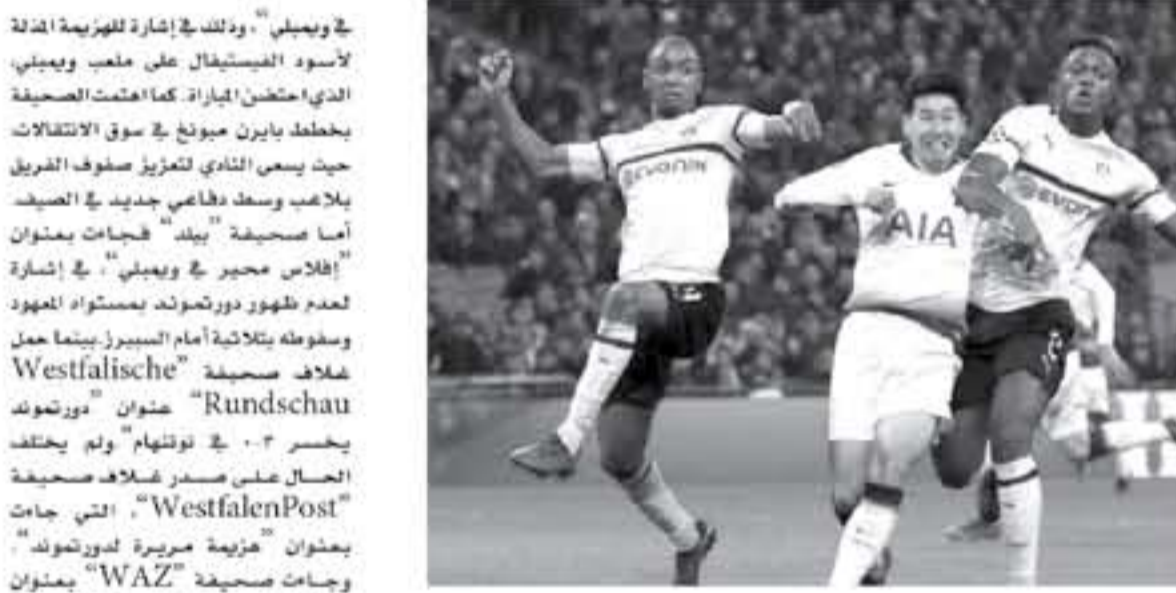
لندن - وكالات

احتفلت الصحف الإنجليزية، بالفوز الكبير لتوتنهام على ضيفه، بوروسيا دورتموند (3-0)، في ذهاب دور ال16 لدوري أبطال أوروبا. وعلوت صحيفة "ديلي إكسبريس"، "سوبر توتنهام.. فريق يوكيتينو يدمر دورتموند في أرض الأحلام"، وعلوت صحيفة "جارديان" عددها الرياضي، "في محب الريح"، وأضافت، "لعبه فيرونوخن الطائفة تلوذ توتنهام لأخذ المباراة"، وفي موضوع آخر، قالت، "ديتلان) رايس يتجه إلى إنجلترا، وينهي أمال إيرلندا". وعن مهمة البلوز الأوروبية، علوت، "ساري يطالب لاعبي تشيلسي بالترد أمام