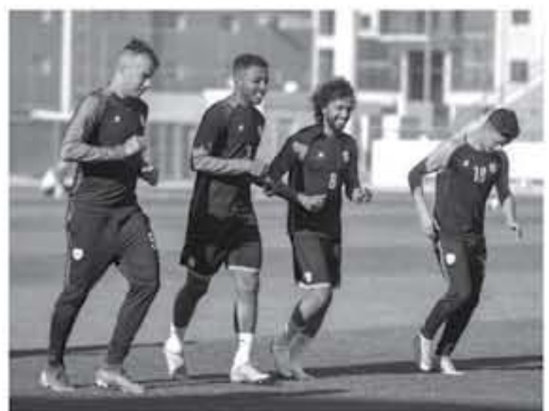
الرياض - وكالات

قد تطمح به قريباً، أزمات التي صفت بطموحات فريق العاصمة في استعادة ذاكرة الانتصارات، وأبرز الحفلات التي فرس ملامح الفريق في قادم الأيام، عبر التقرير التالي، صعوبات الشتاء الصعوبات تكالبت على الليت الأبيض في الفترة الأخيرة، مع اشتداد المنافسة على المركز المؤهل لدوري أبطال آسيا المقبل، فتوالى الإصابات على لاعبيه، لاسيما هدافه الروماني كوستانتين بوديسكو، الذي خسره الفريق تماماً، فيما غادر صفوفه في الميركاتو الشتوي الدوليان هتان باهيري وعبدالله الخبيري، صوب قطبي الرياض الهلال والنصر، الذي لم يظهر بمردود مميز مع الفيحاء، ثم اتحاد جدة ليبنى الأمل معاً على الغربي مبارك بوضوفا، والبرازيلي سيبا، والجامبي أبو بكر تراولي، لتعمل