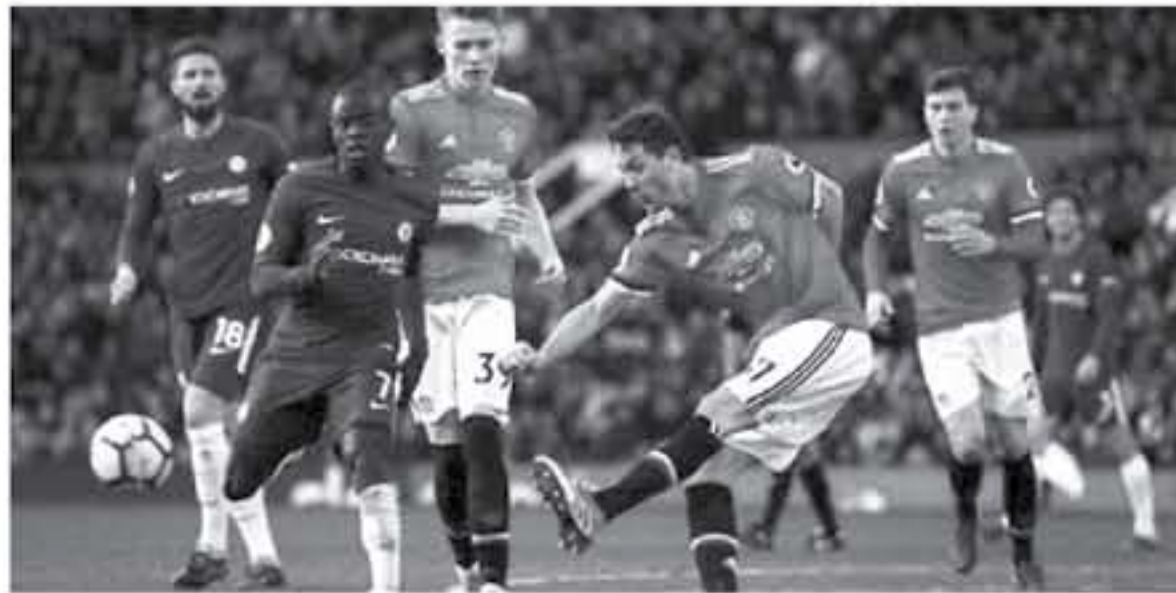
تواجه الإسباني، "اعتدا على الفوز باللقاب، وكنا الفريق الأكثر نجاحاً في إنجلترا طوال السنوات القليلة الماضية، والنشء الوحيد الذي يُمكنني قوله، هو إننا سنبدل كل ما لدينا وسنعمل بجد".

أبيد الإسباني سيزار أزييليكويتا، قائد فريق تشيلسي، استياءه الشديد عقب الخسارة الحاسمة أمام مانشستر يونايتد، في ثمن نهائي بطولة كأس الاتحاد الإنجليزي. وقال أزييليكويتا، خلال تصريحات تلفزيونية، "نحن نشعر بخيبة أمل، وتم إقصائنا من البطولة على معنا". وأضاف: "إنها ليلة مُحبطة، كانت أمسية صعبة على الجميع، لكننا نعرف أن الجماهير تدعمنا في كل لحظة". وتابع الإسباني، "اعتدا على الفوز باللقاب، وكنا الفريق الأكثر نجاحاً في إنجلترا طوال السنوات القليلة الماضية، والنشء الوحيد الذي يُمكنني قوله، هو إننا سنبدل كل ما لدينا وسنعمل بجد".