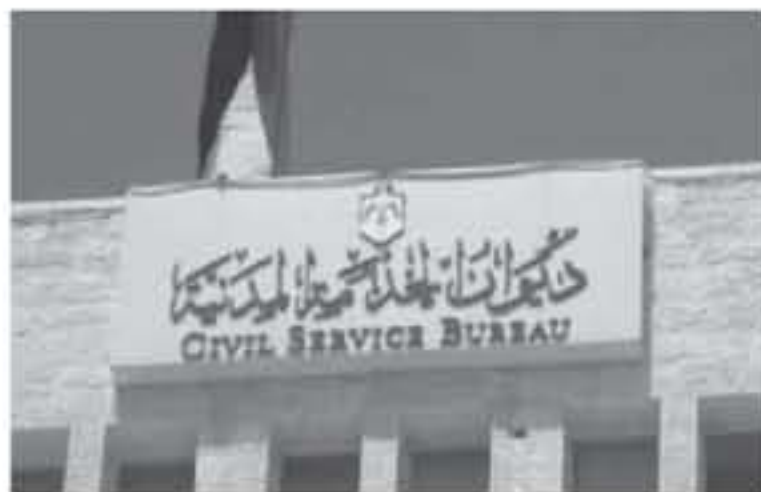
تؤثر بأي حال من الاحوال على دور وأهمية أي مواطن، لأن حقوق المواطن

بأشرف رئيس ديوان الخدمة المدنية نضال البياتية، أمس، لقاءاته المباشرة مع المواطنين في مكتب خدمة الجمهور بمرکز الديوان. وخلص البياتية يوم الثلاثاء من كل اسبوع للقاء المواطنين واستقبال المراجعين والاستماع الى مطالبهم وتوجيه المعنيين بشأنها، مشيراً هذه الخطوة واجباً أساسياً لمسؤول السجماً مع التوجهات الكلية السامية بالعمل المدني، والاستماع الى المواطنين ولتبنيها ضمن الامكانات والقوانين المعمول بها. وأضاف ان لقاء المواطنين لن يقتصر على مرافقي مركز الديوان في العاصمة،