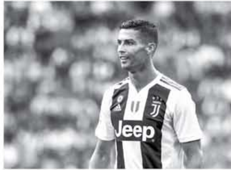
بلاكوس لتحقيق نتيجة إيجابية في هذا اللقاء قبل مباراة العودة بتورينو. يخف الحدير الحلي لتفريق مانشستر سيتي جوارديولا، على أعقاب استعادة ذكرياته على الملاعب الألمانية.

يفتح ملعب واندا ميتربوليتانو أبوابه لاستضافة مباراة تجمع بين أتلتيكو مدريد ويوفنتوس في ذهاب دور الـ16 من دوري أبطال أوروبا 2018-19. وأقيمت قرعة دور المجموعات السيدة المجموع في الجمعة الثامنة رفقة مانشستر يونايتد وفالنسيا ويونج بويز، وتأهل الفريق إلى دور الـ16 من البطولة رفقة الشياطين الحمر بعدما احتلوا المركز الأول في المجموعة برصيد 14 نقطة. فيما أن خاض الفريق 6 مباريات في دور المجموعات، استطاع أن يحقق الفوز في 4 مباريات، وخسر مبارتين فقط. تضاف أتلتيكو مدريد في مجموعة قوية أيضاً ضمت كلا من يوروسيا نورفولك الألماني، وماناكو الفرنسي وكلوب بروج البلجيكي، واستطاع زملاء أنطونيو جريزمان حسم التأهل لدور الـ16 رفقة الجورجوسون بعدما حصدوا 13 نقطة، من أربع انتصارات، وتعادل وخسارة، وسيسعى الروسي