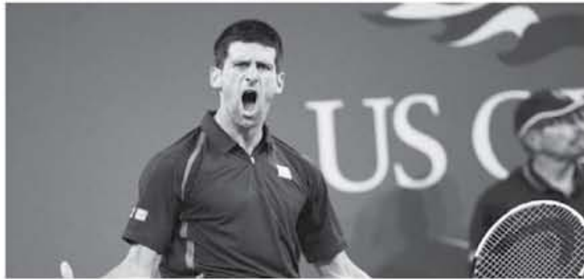
هذه الرحلة الفاصلة ليمس وكأنها خيالية. وأصبحت بايلز، الفائز بعدة ألقاب أولمبية، تتصدر الفئران بعداليات ذهبية في بطولة العالم للجمباز، برقم لباسي بلغ 11 ذهبية، وثلاث لآص

فاز نوفاك ديوكوفيتش، لكسند الأول عالمياً في التنس بجائزة توريس لأفضل رياضي في العالم، خلال العام، بينما لعبت جائزة أفضل رياضية، إلى لاية الجمباز الأمريكية، سينون بايلز. وعاد المصري ديوكوفيتش إلى طريق الانتصارات بعد الخسوة لجرامة في الفرق منذ عام واحد، لكنه حصد لقب ويمبلدون وأمريكا المفتوحة في 2018، قبل أن يحجز لقب بطولة أستراليا المفتوحة في العام الجديد، ويتربع على عرش اللعبة. وبعد حصد اللقب في مليونير برك للمرة السابعة، وتحقق رقم لباسي، اجتاح ديوكوفيتش الأسطورة بيت سامبرسي، وبان يحتل المركز الثالث في قائمة الأكثر حصدًا لألقاب البطولات الأربع الكبرى، برصيد 15 لقباً، يتفوق لقبين عن زاقيل نادال وخمسة ألقاب عن التنس روجر فيدرر. وقال ديوكوفيتش، أمس الأول الاثنين "كنت أفكر في الابتعاد عن التنس.. لم أجد لنسني التوازن المناسب، استقرت عدة أشهر للوصول إلى هنا الأمر، هذه الجائزة تعني هذه الرحلة". //