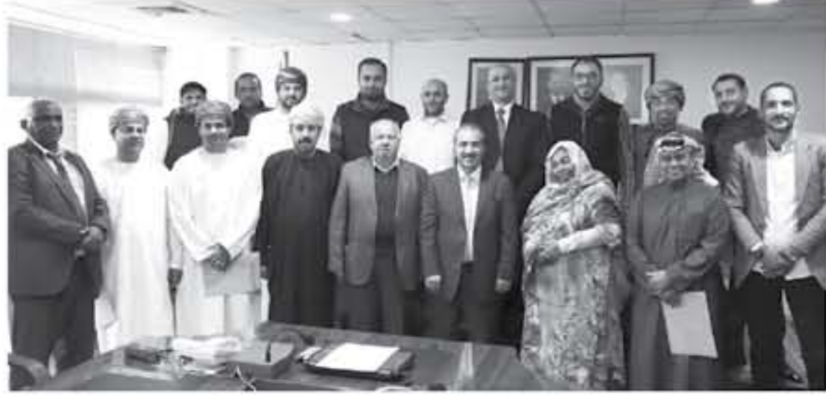
في الأزمات، ودور الإعلام في كشف المخاد والتضليل والإشاعات.