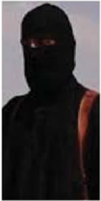
بغداد - وكالات

أعلنت الاستخبارات العسكرية العراقية، عن اعتقال قاطع الرؤوس في تنظيم "داعش" الإرهابي على الحدود العراقية السورية، والذي ظهر في أكثر من فيديو وهو يثبث عمليات إعدام. وقالت المديرية في بيان على صفحتها في موقع "فيسبوك"، إن "مطارز مديرية الاستخبارات العسكرية، واثر معلومات استخبارية دقيقة، أقت القبض على أحد الإرهابيين الذين تسللوا عبر الحدود العراقية السورية والمعروف بـ "قاطع الرؤوس". وأضافت أن "هذا الشخص معروف بقاطع الرؤوس"، و"ظهر بعدة إصدارات لدواعش أمام أشخاص قام بقطع رؤوسهم في العراق وسوريا". //