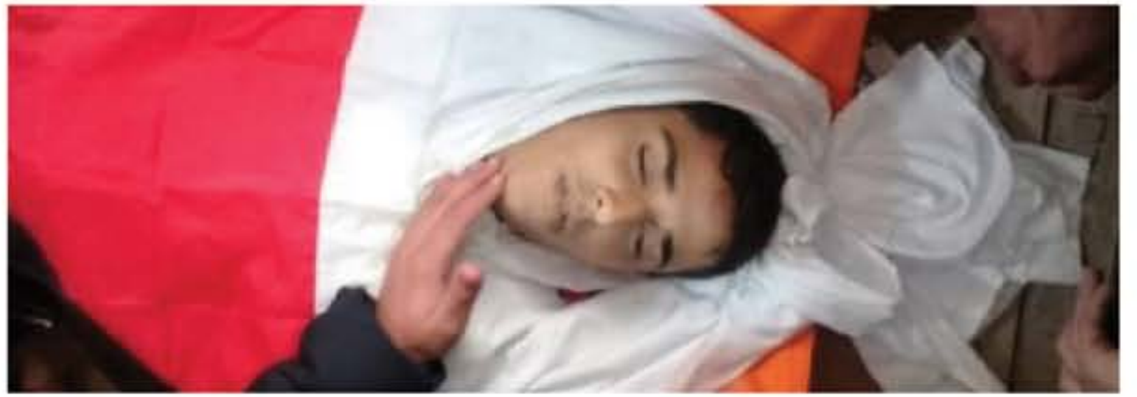
الأنباط - غزة

وأضاف أن (١٦٧٣) فلسطينياً أصيبوا، من بينهم (٣١٢٨) طفلاً، (٦٥٣) سيدة، (١٧١) مسعفاً، و(١١٨) صحابياً، ومن بينهم (٧٧٥٠) أصيبوا بالرصاص الحي، من بينهم (١١٣٣) طفلاً، و(١٥١) سيدة. وأشار إلى أن قوات الاحتلال لا تزال تواصل استهداف المشاركين في مسيرات العودة السلمية على امتداد السياح الفاصل شرقي قطاع غزة، للجمعة الـ (١٨) على التوالي، وتستخدم القوة المفرطة والمميتة في معرض تعاملها مع الأطفال والنساء والشباب المشاركين في تلك المسيرات.