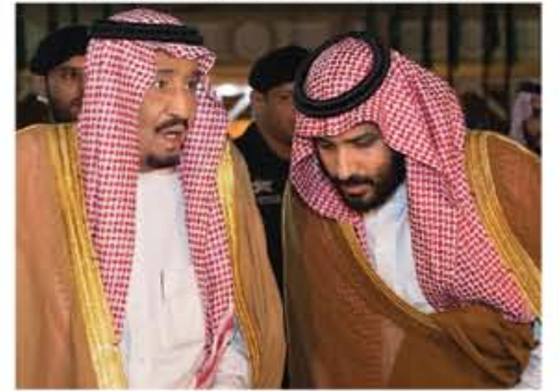
الرياض - وكالات

وقبل مغادرته المملكة، أصدر الملك السعودي أمرًا ملكيًا، بيب وولي العهد، في إدارة شؤون الدولة ورعاية مصالح الشعب خلال فترة غيابه عن المملكة. ووصل الملك السعودي أمس، إلى شرم الشيخ لكي يتراش وقد المملكة في قمة جامعة الدول العربية والاتحاد الأوروبي التي تنطلق اليوم لمدة يومين. وتبحث الدول الأعضاء في الجامعة والاتحاد في أول قمة تعقد بينهما عددا من القضايا من بينها الأمن، والهجرة، والتنمية الاقتصادية.