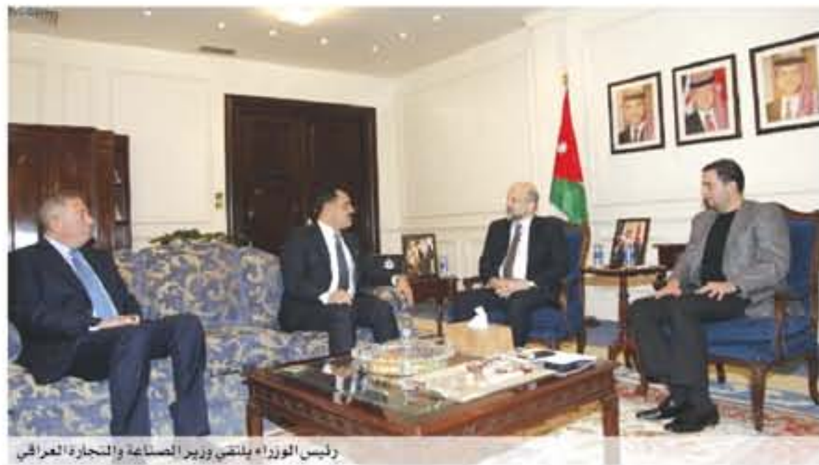
رئيس الوزراء يلتقي وزير الصناعة والتجارة العراقي

يبحث رئيس الوزراء الدكتور عمر الرزاز خلال لقائه في عمان أمس السبت، نخبة من رجال الأعمال العراقيين، لتطوير التعاون الاقتصادي وإيجاد مشاريع توفر فرص عمل لمواطني البلدين والتي قدمها في العمل المثمر المشترك. وقال الرزاز، إن هذا اللقاء مع الفعاليات الاقتصادية العراقية يمثل حالة فيها نبوءة للاستكمال من أجل العمل على تعزيز علاقات التعاون الاقتصادي بين البلدين الشقيقين، ما يسهم في حل المشكلات وتعميق العلاقة بين البلدين وتوسيعها على مختلف الصعد. وأشار رئيس الوزراء إلى أن اللقاءات التي اجرت مع العراق في غاية الأهمية، ونعمل إلى جانب الحكومة العراقية على تذليل الصعوبات وإعادة العلاقات الاقتصادية إلى حالتها الطبيعية. وأوضح أن تعزيز العلاقة الاقتصادية بين البلدين يجب أن يشعر بتأثيرها الشبان الشقيقين، بحيث تعمل على إيجاد فرص عمل وتسهم في تطوير العمل الاقتصادي بين البلدين. وأكد الرزاز أن الحكومة تسعى لفتح آفاق التعاون والتبادل التجاري