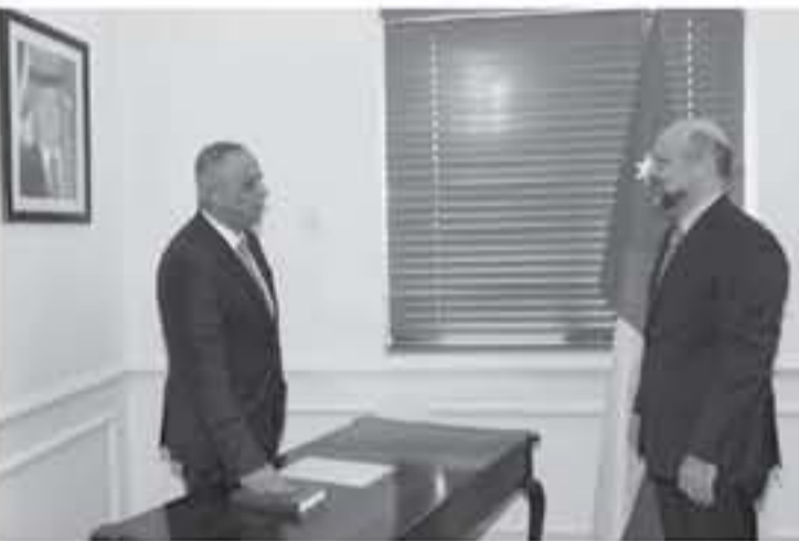
الأنباط - عمان

السامية بالمواقفة على قرار مجلس الوزراء بتعيينه رئيساً لمجلس مفوضي منطقة العقبة الاقتصادية الخاصة. //