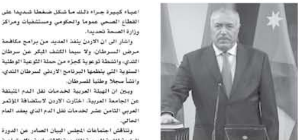
الأنباط - عمان

يشارك وفد أردني برئاسة وزير الصحة الدكتور غازي الزرين، في اجتماعات الدورة الحادية والخمسين لمجلس وزراء الصحة العرب، والمكثب التلفزيوني في القاهرة خلال الفترة من ٢٧ إلى ٢٨ الشهر الحالي. ويضم الوفد سفير الاردن في القاهرة على العايد ومساعدا امين عام الوزارة لشؤون الرعاية الصحية الأولية الدكتور عدنان اسحق. وقال الناطق الاعلامي باسم الوزارة حاتم الأزري: ان الوزير يتراس حالياً الدورين العادييتين التاسعة والاربعين والخمسين لمجلس وزراء الصحة العرب، وسيتم رئاسة الدورة العادية الحادية والخمسين إلى وزير الصحة في دولة الامارات العربية المتحدة عبد الرحمن بن محمد العويس، كما سيلقي الوزير في افتتاح الدورة. وأشار إلى ان جدول أعمال الاجتماعات يتضمن قضايا صحية حيوية في مقدمتها التغطية الصحية الشاملة ودور المجلس العربي للاختصاصات الطبية في تحديث