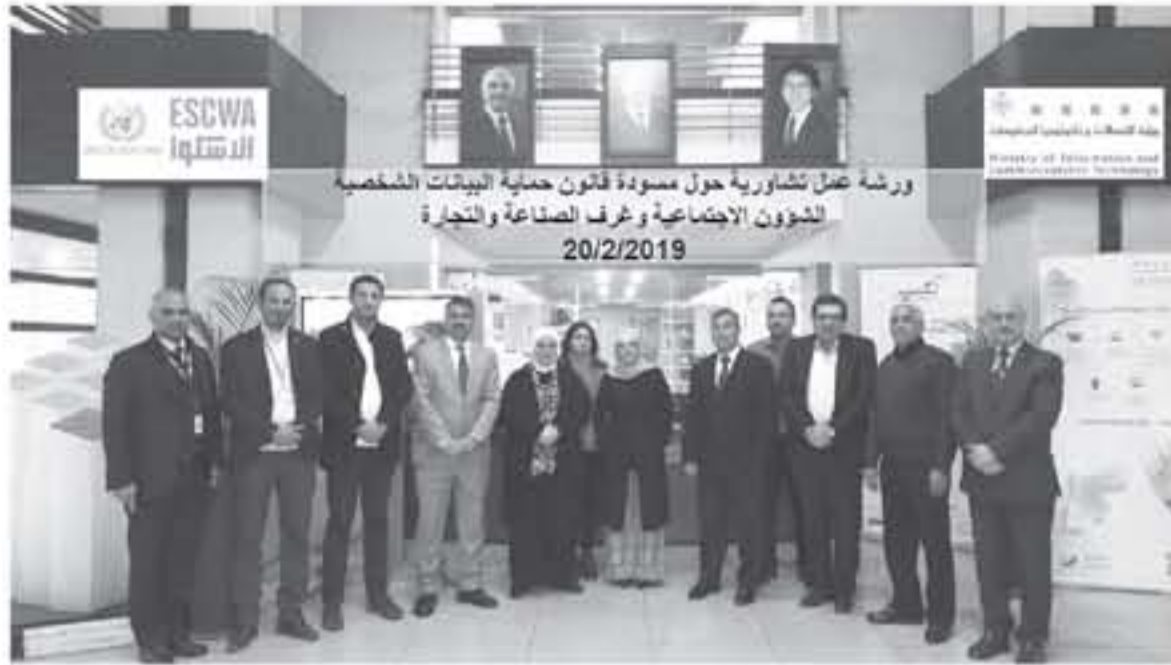
مسودة المشروع بنهاية عام ٢٠١٨ ولدة ثلاث أشهر، وتلت خلالها العديد من الملاحظات والآراء حول مسودة القانون من الشركاء وأصحاب العلاقة والهيئات من القطاعين العام والخاص. //