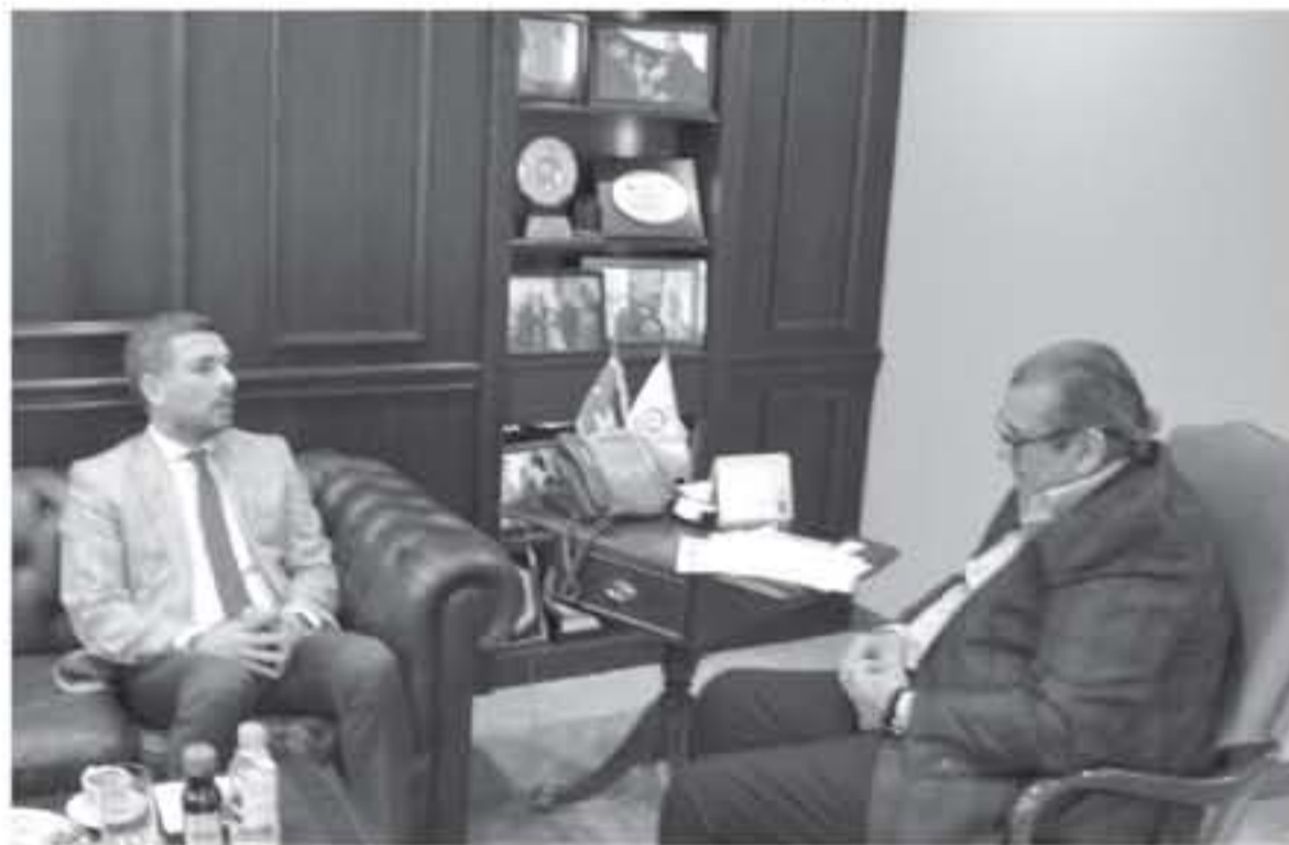
ستشهد قريباً زخماً كبيراً بمختلف المجالات كون الأردن يحظى بمكانة كبيرة ومرموقة لدى رومانيا. //