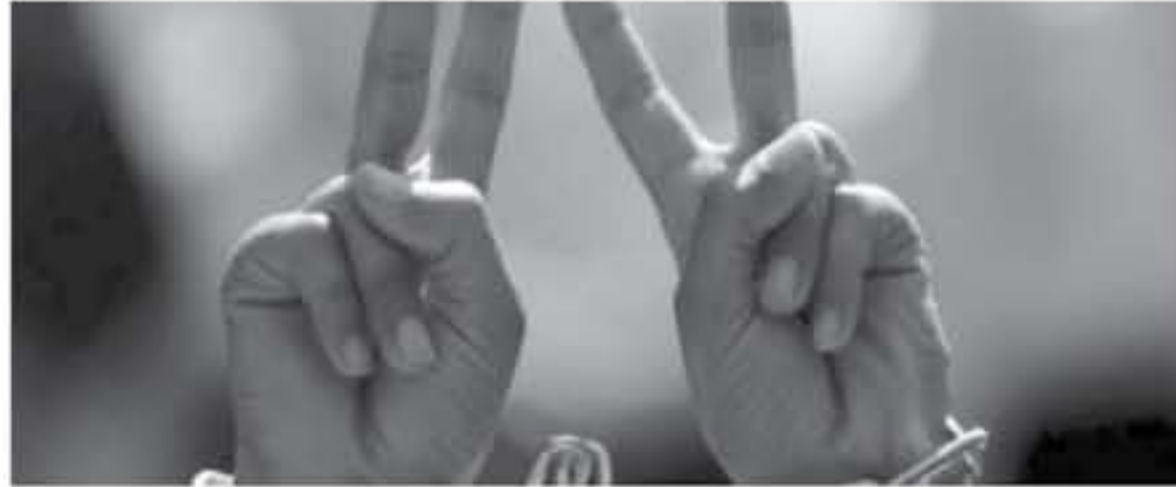
الانباط. رام الله

أكدت الحركة الأسيرة في سجون الاحتلال أن الأسرى ذاهبون نحو النهاية في مواجهة أجهزة التشويش التي يتوي الاحتلال تركيبها بالسجون، منبهة إلى أن الاحتلال يريد حرقنا وقتلنا من خلالها ولو كلفنا ذلك كل الأثمان. ولفتت الحركة في بيان صحفي أمس، أن الأمور قد تصل في أي لحظة من اللحظات القادمة داخل سجن القصب لأن يرتقى منه الشهداء، وسيحول المشهد إلى ساحة مواجهة ومسلحة حفيضة يتصدى بها الصدر العربي المنيء بالإيمان والتحدى أمام بنافق القتل والإجراء. وقالت، إن التهديد دولة الاحتلال لنا بالضرب بيد من حديد لا يخيفنا وإن يدعهم الحديدية ستقابلها نفوس وهم بعزم الجبال وصلابة الخولا، وسيرى العدو من ثباتنا أن تهديده لا يخيفنا ولا ينتبنا عن رفضنا لجبروته. وتجبت إن الاحتلال قد يقتل أهدانا يبرر بها تشهدها فيما بعد، إن يقتلنا داخل أفسانها وقرقنا.