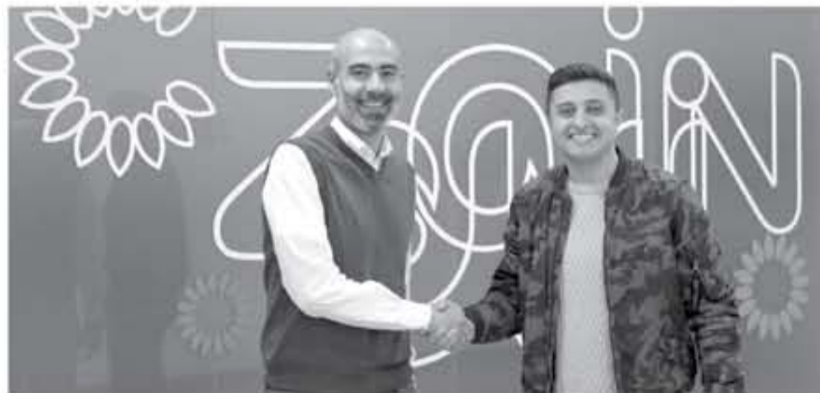
التجديد للاعتماد على المحتوى الرقمي والأفكار المبتكرة لإنتاج هذا المحتوى. //