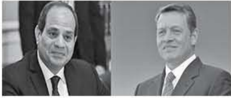
الابتناب - عمان

وهنا جلالة الملك الرئيس المصري على نجاح جمهورية مصر العربية في استضافة القمة العربية الأوروبية الأولى، معرباً جلالته عن تمنياته في أن تشكل القمة محطة جديدة من التعاون والشراكة بين الدول العربية والأوروبية.