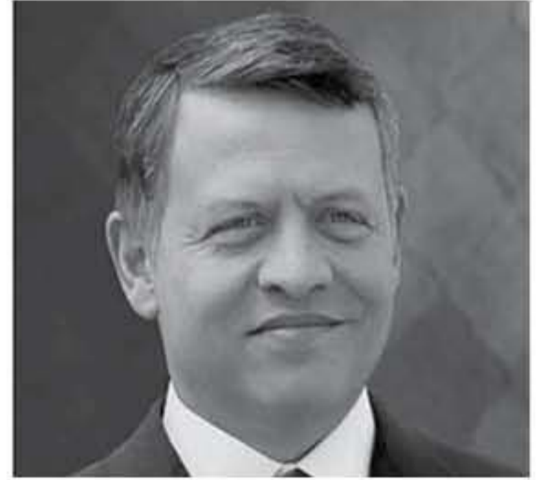
الابتناب - الولايات المتحدة

شارك جلالة الملك عبدالله الثاني، امس، في «اجتماعات العقبة» التي استضافتها الولايات المتحدة الأميركية بالشراكة مع الأردن لتابعة بحث وتنسيق الجهود الدولية في الحرب على الإرهاب. وركزت هذه الجولة من الاجتماعات، التي عقدت بحضور سمو الأمير الحسين بن عبدالله الثاني، ولي العهد، وشارك فيها مسؤولون سياسيون وأمنيون من العديد من الدول وممثلون عن منظمات دولية وشركات تكنولوجيا عالية، على سبل التصدي للتحديات الأمنية المرتبطة باستخدام الإرهابيين والجماعات المتطرفة للإنترنت والتكنولوجيا ووسائل التواصل الاجتماعي لنشر أفكارهم