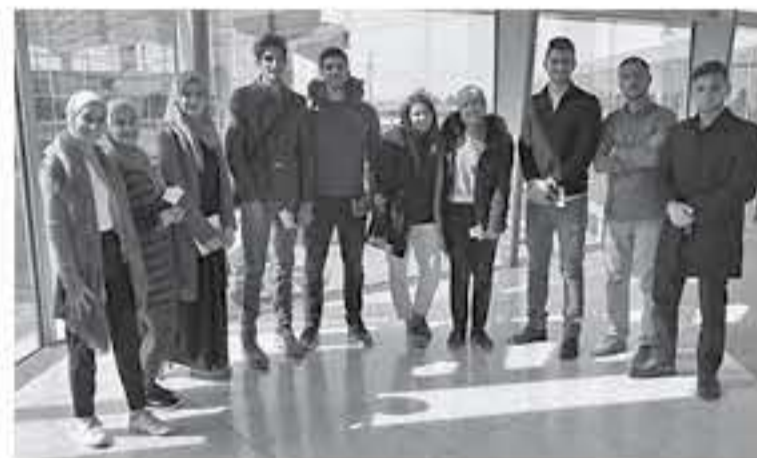
الابتناب - عمان

يشارك عشرة شباب أردنيين من مختلف محافظات المملكة، بفعاليات مؤتمر مبادرة لندن ٢٠١٩، الذي يعقد في الثامن والعشرين من الشهر الحالي، لدعم الاقتصاد والاستثمار بالبلد.