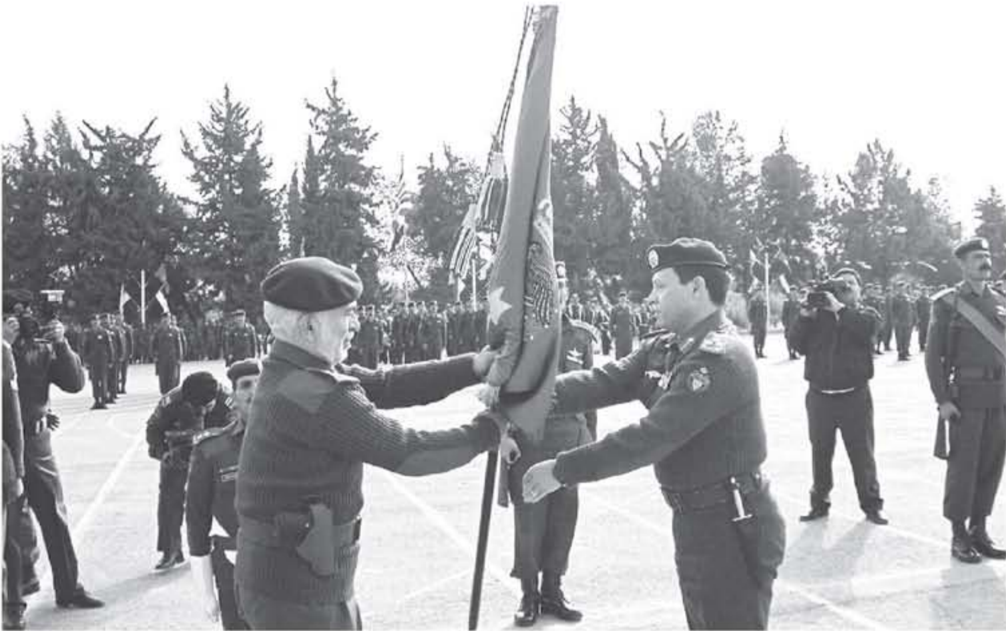
الابناب : عماد : مديرية التوجيه المنوي

قرار تعريب قيادة الجيش قرار وطني وقومي جريء مثل شجاعة وحكمة وقوة بصيرة قيادة هاشمية حملت مسؤوليتها التاريخية لعزلة أمتهما وإعلاء شأنها واستقلال قرارها السياسي، بشرت بولادة مستقبل واحد وغد مشرق وهي التي جعلت من الجيش العربي قوة متطورة للوطن والأمة.