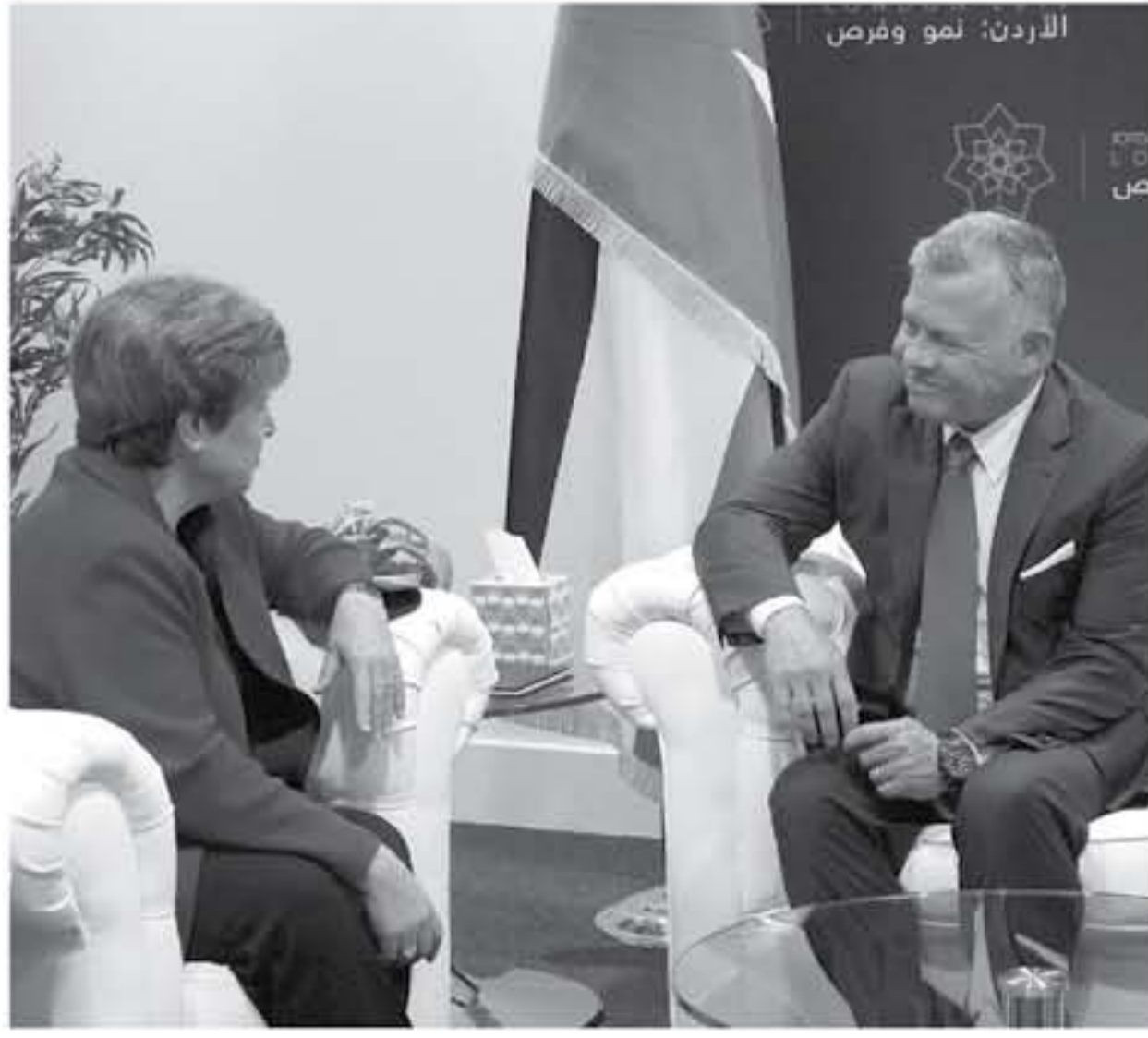
الانباط - لندن

التقى جلالة الملك عبدالله الثاني، على هامش مؤتمر مبادرة لندن أمس، الرئيسة المؤقتة لمجموعة البنك الدولي كريستالينا جورجيفا، وتم خلال اللقاء استعراض فرص التعاون خصوصاً في القطاعات التنموية، ولتسائل النساء الخطة الاقتصادية والتنموية التي يتبعها الأردن، الهادفة إلى توفير فرص العمل للشباب وزيادة الاستثمارات وتحسين بيئة الأعمال.