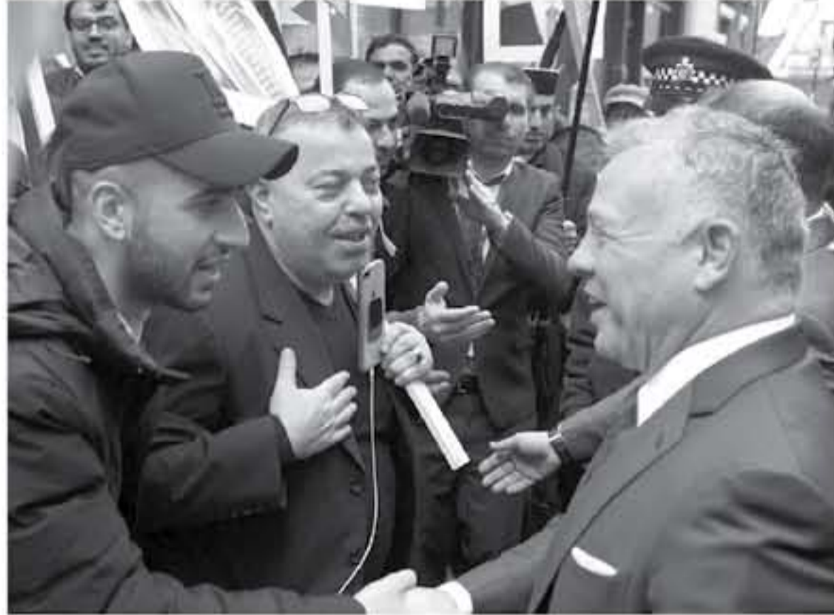
الانباط - لندن

دعا جلالة الملك عبدالله الثاني المستثمرين ومجتمع الأعمال في العالم للاستفادة من الفرص والميزات التنافسية التي يوفرها الاقتصاد الأردني من مواهب بشرية موهبة ومطموحة، وموقع استراتيجي يشكل نقطة نلاق لتفارات والأسواق العالمية. وقال جلالتة في كلمة رئيسية ألقاها في مؤتمر مبادرة لندن أمس إن الانفاقيات التجارية المتعددة التي وقعها الأردن تمكن الشركات العاملة فيه من الوصول إلى أسواق تضم مليار مستهلك حول العالم، لافتاً إلى أن الاحترام الدولي الذي يحظى به الأردن يمثل الركيزة للعلاقات التجارية الراسخة. ونالها النقص الكامل للكلمة التي ألقاها جلالتة بحضور جلالة الملكة رانيا العبدالله.