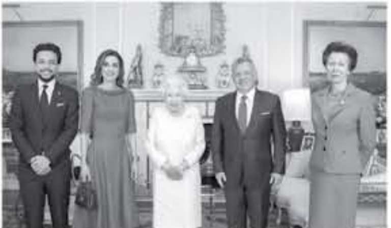
الانباط - لندن

استقبلت جلالتة الملكة إليزابيث الثانية ملكة بريطانيا في قصر باكنغهام في لندن أمس جلالتة الملك عبدالله الثاني وجلالتة الملكة رانيا العبدالله وسمو الأمير الحسين