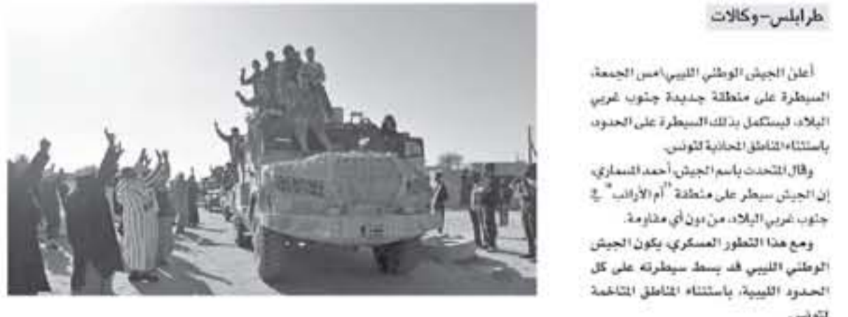
من ليبيا، ومنطقة العوينات الغربية على الشريط الحدودي مع الجزائر.

والغربية، مع نشاء والتيجر والجزائر. وفي يناير الماضي، أعلن الجيش الوطني الليبي إطلاق عملية عسكرية في جنوب البلاد، بهدف "دحر الجماعات الإرهابية والإرهابية والعمليات العابرة للحدود". واستطاع الجيش من خلالها استعادة السيطرة على حقل الشراة، الذي يعد الأكبر في البلاد، فضلا عن تحرير مدينة سبها، وغيرها من المناطق والمدن. وعرفت المناطق الجنوبية بليبيا في فوضى عارمة منذ عام ٢٠١١، وظلت الأوضاع الأمنية فيها مترددة للغاية، نظرا لبعدها عن المناطق السكنية الرئيسية على الساحل الشمالي والنيهار حكم الفاعلون وشهدت المنطقة مرارا هجمات للمعارضة الشعبية.