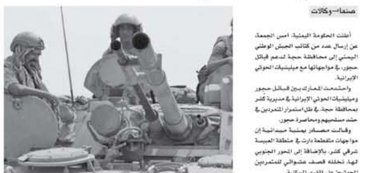
كندر. وفيما عتد شيوخ قبائل من حجة اجتماعا للتأكيد على دعم قبائل حجور، أصدرت وزارة الدفاع اليمنية توجيهات عسكرية إلى عدد

اليمتي، نصت التوجيهات على تحريك ٨ كتائب عسكرية من مناطق مختلفة لتتوجه إلى محافظة حجة لقمع الاحتجاجات على قبائل حجور. ووفقا للتوقيت، فقد شملت التوجيهات قادة المنطقة العسكرية الأثرى والثالثة والسادسة والسابعة ومحور العبيسة، من أجل تحريك الكتائب إلى معسكر التحالف في التويمة لتتجه إلى المنطقة العسكرية الخامسة. وبعد فشل الهجمات المتكررة للحوثيين في اقتحام مناطق حجور، قالت مصادر يمنية إن زعيم التمرد عبد الملك الحوثي أصدر توجيهات للشرقيين في مديريات العاصمة صنعاء بتجهيز ٤ آلاف مسلح بشكل عاجل، وتقدم إلى مديرية كندر. وأضرت المصادر إلى أن إعلان حالة طوارئ وسط قيادة الحوثيين بشأن حجور، أدت إلى قطع إجازات المسجلين وسط سحب الحرين من الجهات الأخرى استعدادا لتقدمهم إلى محافظة حجة.