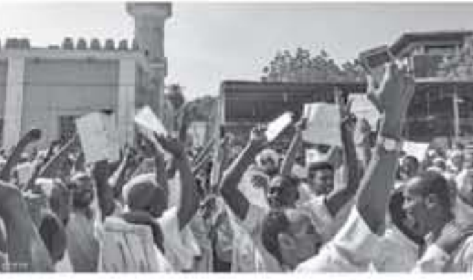
الخرطوم - وكالات

أعداء كبيرة من قوات الشرطة تحسبا للتظاهرات التي دعا إليها "تجمع المهنيين" وحلفاءه من المعارضة، وكان تجمع المهنيين وقوى المعارضة السودانية قد دعا إلى خروج لتظاهرات يوم الجمعة في مختلف أنحاء البلاد، إلى جانب احتجاجات ليلية. وشهدت مدن العاصمة السودانية الثلاثة - الخرطوم، أم درمان، بحري - تظاهرات شعبية واسعة، في تحد جديد لحالة الطوارئ المعلنة في البلاد. يذكر أن الرئيس السوداني، عمر البشير، قد فرض الجمعة الماضي حالة الطوارئ، ملحقاً بإيها، بعد يومين، بأوامر طوارئ تحظر التجمع والتظاهر وإغلاق الطرق والتوقف عن العمل.