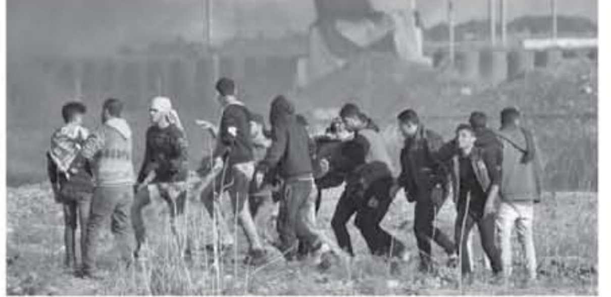
غزة - وكالات

وفي ٢٠٠٣، أغلقت قوات الاحتلال "باب الرحمة" بدعوى وجود مؤسسة غير قانونية فيه، وتجمد أمر الإغلاق سنويا منذ ذلك الحين، وأقرت محكمة إسرائيلية في ٢٠١٧ استمرار إغلاقه. وتشترب العشرات من إكمال عامها الأول منذ انطلاقها في ٣٠ مارس الماضي، وأسفرت اعتداءات قوات الاحتلال على المتظاهرين السلميين عن استشهاد نحو ٢٥٠ مواطناً، بينهم ثناء وأطفال، وإصابة أكثر من ٢٣ ألفاً آخرين بجراح متفاوتة الخطورة. وهاجم مستوطنون أمس الجمعة، متعطشون عين سامية ومرج الذهب في قرية القبر شمال شرق مدينة رام الله. وذكرت مصادر محلية أن مستوطنتي "جبعوت" الخامة على أراضي القرية، هاجموا المزارعين وحاولوا زرع أعنام في أراضيهم، حيث تصدى لهم الأهالي وطردوهم من المكان. وأضافت المصادر أن القرية تعرضت بشكل دائم لهجوم من قبل المستوطنين المدعومين والمحميين من جيش الاحتلال الإسرائيلي، وذلك بهدف الاستيلاء على أراضي القرية