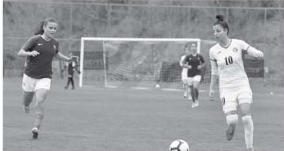
بعمارة تحديد المركز النهائي يوم غد الثلاثاء .