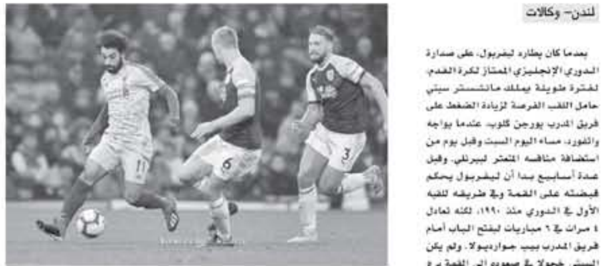
لندن - وكالات

بأنها ب ٦ نقاط، وفاز اليوناني بجميع مبارياته خارج أرضه منذ تولي سولسكاير المسؤولية في ديسمبر ولو حافظ على سجله سيتقدم ب ٤ نقاط على أرسنال. وسيحصل لوتنهام هوتسبير صاحب المركز الثالث على دفعة معنوية بعد بلوغ دور الثمانية في دوري الأبطال أيضا عقب الانتصار ١-٠ على بوروسيا دورتموند في النتيجة الإجمالية. ويحل الفريق ضيفا اليوم السبت على ساوثهامبتون المتعثر ولو فاز سيتقدم ب ٦ نقاط على ابولونايك و٢ على أرسنال و٨ على تشيلسي الذي يستضيف وولفرهامبتون، يوم غد الأحد، وسيخوض لوتنهام، الذي حصد نقطة واحدة في آخر ٣ مباريات في الدوري، المباراة بدون مدربه موريسيو بوكيتينو وأوقف مدرب ساوثهامبتون السابق شيراتين بعد شجاره مع مايك دين حكم مباراة ضد بيرنلي الشهر الماضي. وسيعتبر استراب هيدبرسفيند لاعبون وفوتبالم من الهبوط ستكون المنافسة على تجنب إلقاء الموسم في المركز ١٨، ويبدو أن كارديف سيتي، صاحب المركز ١٨، بلا حول ولا قوة في وقت غير مناسب ويستضيف وست هام يونايتد اليوم السبت في محاولة لإيقاف ٣ هزائم متتالية.