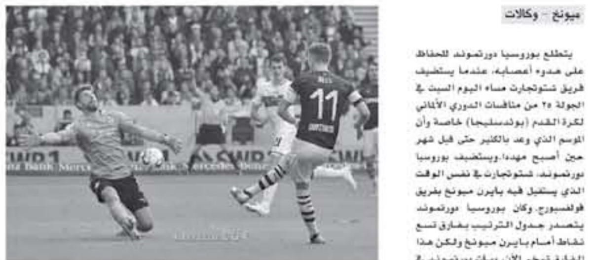
ميونخ - وكالات

يتطلع بوروسيا دورتموند للحفاظ على هدوء أعضائه، عندما يستضيف فريق شتوتجارت مساء اليوم السبت في الجولة ٢٥ من منافسات الدوري الألماني لكرة القدم (بوندسليجا) خاصة وأن الموسم الذي يعد بالكثير حتى قبل شهر حين أصبح مهيباً، ويستضيف بوروسيا دورتموند، شتوتجارت في نفس الوقت الذي يستقبل فيه بايرن ميونخ بفريق فولفسبورج. وكان بوروسيا دورتموند يتصدر جدول الترتيب بفارق تسع نقاط أمام بايرن ميونخ ولكن هذا الفارق يتخسر الآن، وبات دورتموند في الصدارة بفارق هدفين أمام بايرن ميونخ.