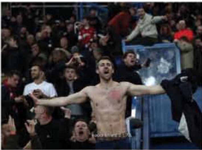
لندن - وكالات

الصدر، بعد واقعة في سيارة أجرة، وقالت وزارة الخارجية في بيان «لتواصل مع السلطات الفرنسية لتابعة واقعة المشجع البريطاني في باريس، نحن على استعداد لتقديم المساعدة»، وانتصر مانشستر يونايتد ١-٣ على بطل فرنسا، بعد الخسارة ٢-٠ في الذهاب ليبلغ دور الثمانية بفضل قاعدة فارق الأهداف خارج الأرض.