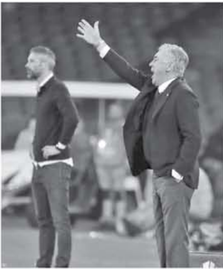
روما - وكالات

مانشستر يونايتد الأخيرة (١-٣)، كنت سألّف من أول جسر أقبله عقب اللقاء، ومن انتصار فريقه (٣-٠) على ريد بول ساوثويچ النمساوي، في الدوري الأوروبي، قال، «النتيجة جيدة، لكن لا زال هناك ٩٠ دقيقة أخرى، سنخوضها من أجل حسم التأهل.. وواصل، «لا يجب علينا القيام بأي حسابات الآن.. اليوم قلنا ببعض الأمور الجيدة، بينما كنا أقل في المستوى خلال بعض أوقات المباراة».