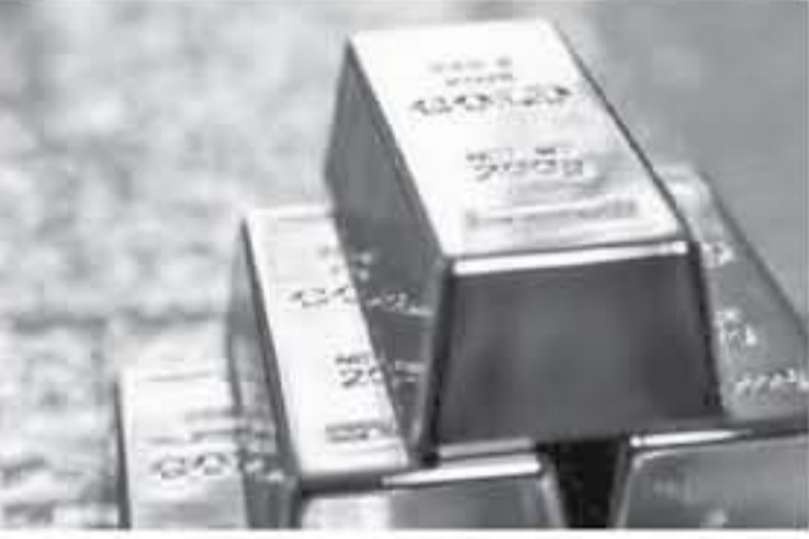
وارتفع البلاتين 0,2 بالمئة إلى 812,43 دولار للأوقية.