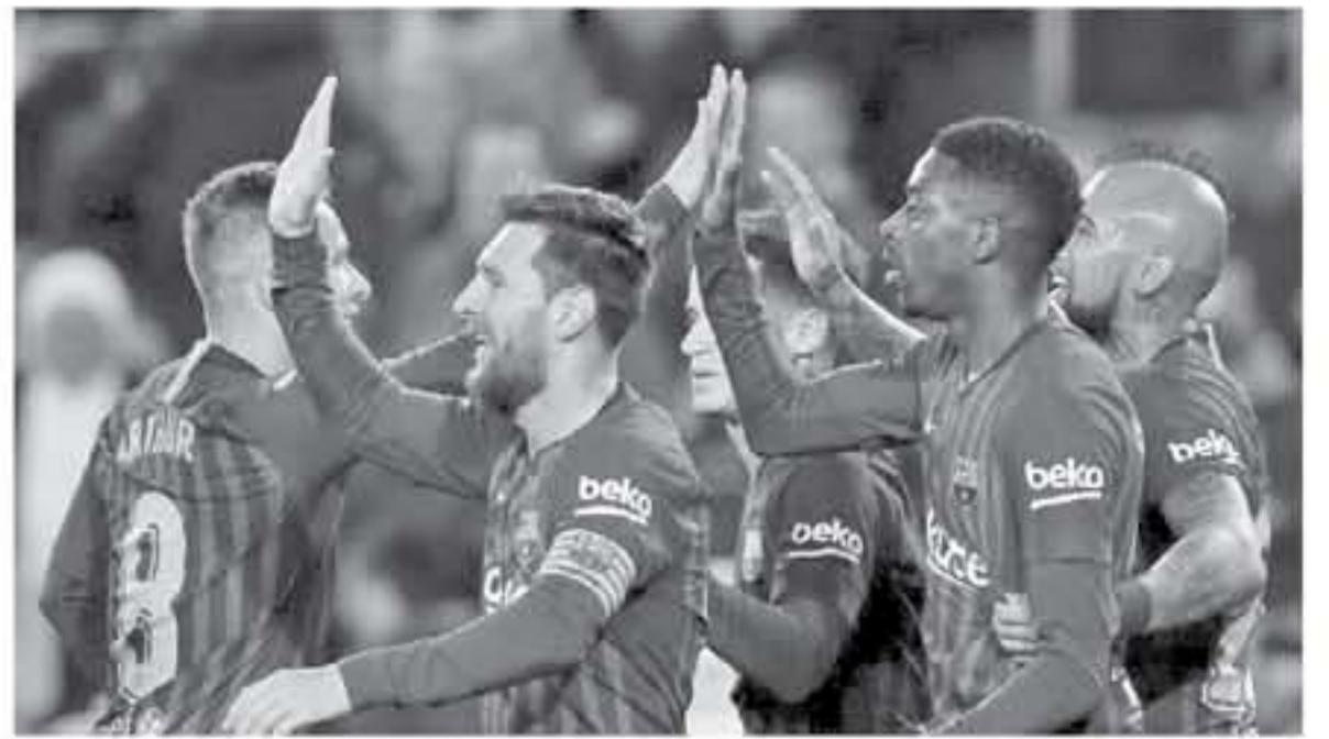
خديزيت - وكالات

بمباراة ١٢ نقطة، وبعد ذلك شاهد برشلونة خروج الريال من دوري أبطال أوروبا أمام أياكس، وبعثت ريال مدريد، ومع باريس سان جيرمان وروما، فاهر برشلونة في الموسم الماضي، منافسات دوري أبطال أوروبا أمام مانشستر يونايتد، وبارتو على الترتيب، ما تركه كل الاحتمالات مفتوحة، وحصل نجوم برشلونة على راحة، حيث خاض اللاعبون الاحتياطيون مباراة كأس السوبر الكتلوني أمام جيرونا، وسيكون لاعبون أمثال جيرارد بيكيه وكويس سواريز جاهزون لمواجهة رايو في ملعب كامب نو.