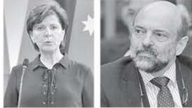
الأنباط - عمان - عمر كلاب

يخدر ما هي أزمة متدرجة تستهدف حالة الاستمرار العامة في البلاد. حالة التراخي الحكومية وسيولة المواقف الرسمية فتحت شهية كثيرين نحو ابتزاز الحكومة والضغط عليها. بعد ان تزلزلت الحكومة طوعا عن دورها وهيئتها الادارية بالرضوخ الى تعيينات جائرة لاشقاء الثواب وبعض المحاسب لصناديد الشريق الحكومي، مما افقد الحكومة قدرتها على التصدي او الدفاع عن اي تعيين لاحق، وتحديدًا وان لغة التبرير الحكومية ركيكة ومغلقة ولا تحمل الحزم والتوضيح اللازمين، مما دفع من سيل التهمك على القرارات الحكومية وادواتها، وجعل الشكالات الاعتراض اكثر انقلاتا وتخرج من حدود الجغرافيا الاردنية، تلك الجغرافيا التي ظلت مسككة على جرحها امام العالم.