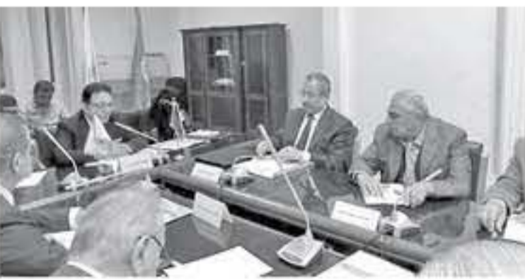
للتطورات التكنولوجية. وأوصى المشاركون برفع مستوى التنسيق

ترأس الأردن، أمس السبت، اجتماعا في القاهرة للاتحادات العربية للنقل بكافة أنشطتها، برئاسة سبل تطوير هذا القطاع الحيوي، بحضور رؤساء الاتحادات والأمانة العامة.