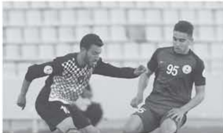
رصيد الرمثا عند 1٠ نقاط وبقي بالتركز العاشر.

اتحاد كرة القدم مطالب وعبر لجنة التأديبية بالخروج بقنوات قوية وحازمة.. تجاه ما حدث في مباراة الفيصلي والوحدات من خروج عن الأخلاق والقيم والسلوك المثالي.. أن كان من جمهور الفريقين أو من اللاعبين والإداريين الذين همسوا أجواء المباراة.. وساهموا بخلق حالات الاحتقان والتوتر والتشغب طوال زمن المباراة!!!