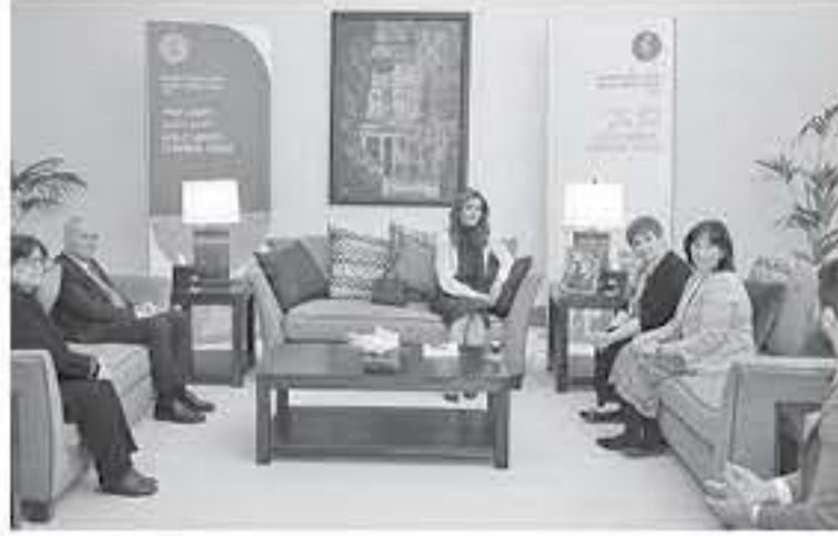
الابناب - البحر الميت

وقال إن "التعلم الجديد لا يعني إعطاء المعرفة بالإكراه أو الإيجاب ولكن يتطلب إضراء الطلبة لتكريس المعرفة والتعلم، بدور بين الرئيس التنفيذي لمعهد التطوير التربوي البريطاني الدكتور باتريك برازير، أن الوقت يتطلب التركيز على جودة التعلم ومدى ارتباطه بمهارات القرن 21 ومتطلبات العمل، مشيراً إلى أهمية أن تلعب المجتمعات دوراً أكبر في تحقيق ذلك.