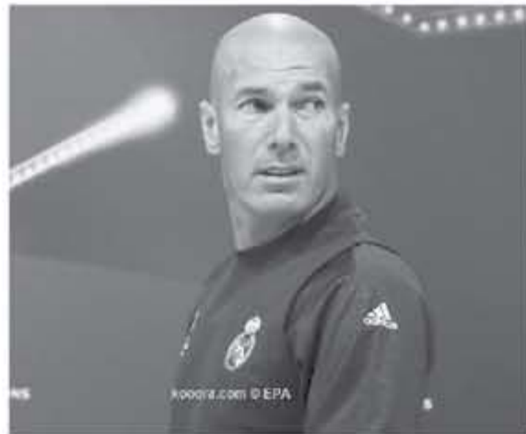
روما - وكالات

أنه يمكن أن يكون هناك سبب وراء تلك الزيارة، وهي أن كبير مدينة تورينو ينظر إلى أنه على رأس أولوياته في الصيف. وتابع الصحيفة، أن ديكيولا أموروزو، لاعب يوفنتوس السابق وزميل زيدان، قام بنشر صورة سابقة تجمعهم بزييدان، خلال زيارتهم لأحد أكاديميات كرة القدم بمدينة تورينو، يُزيد من شائعات الاقتراب من اليويفا. وتفسير تقارير صحفية إلى اقتراب أليجيري من الرحيل عن يوفنتوس عقب نهاية الموسم، بعدما أمضى 5 أعوام بين جدان السيدة العجوز، منذ احتل منصب المدير الفني في صيف 2011، قادماً من التعرير ميلان.