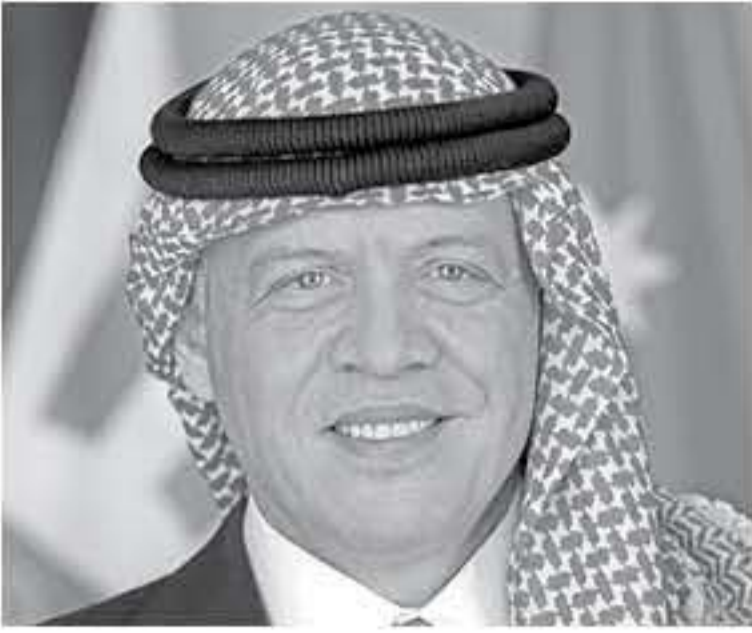
الابناب - عمان

الداعمة للقضية الفلسطينية، ومرصه على إيمان حبل عادل يحسن لأخشاها الفلسطينيين مهم المشروع في إقامة دولتهم المستقلة على ترابهم الوطني وعاصمتها القدس الشرقية.