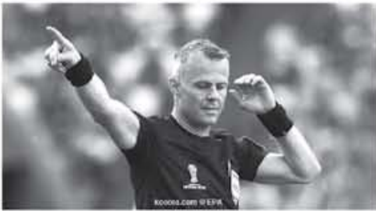
باريس - وكالات

حساب أتليكو مدريد في لشبونة (1-1). كانت مباراة الذهاب بين أتليكو وبيوفنتوس في ملعب "واندا متروبوليتانو" بمدريد قد انتهت بنتيجة (1-0). ومباراة مانشستر سيتي وشالكه، الثلاثة أيضاً، على ملعب "الاتحاد" أعلن الجيوش أن الحكم الفرنسي كليمن توربان سيديرها. كان لقاء الذهاب انتهى بنتيجة (2-1) على ملعب شالكه.