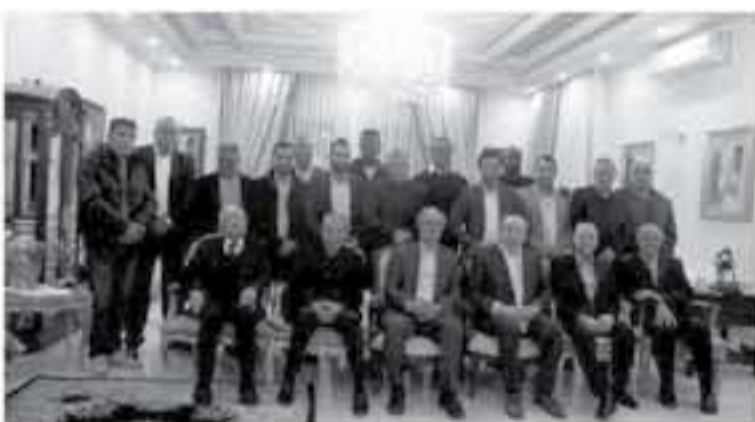
الابتباط - أريد