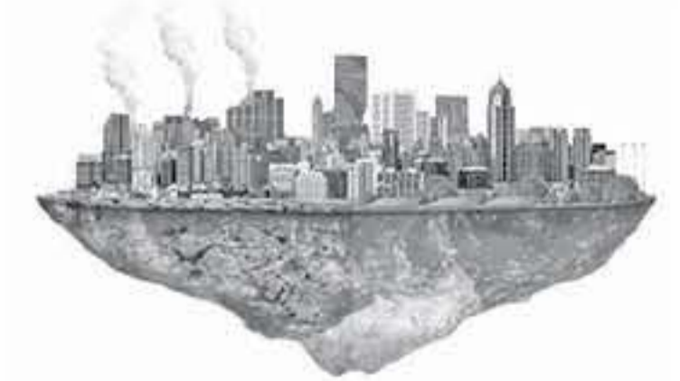
الابناب - عمان - ساهر تايك عبد العاليم

والصحة والزراعة. من الجدير ذكره ان الأردن كثيراً من دول العالم تتمركزها طريرية، قد تضررت من الجفاف البيئي، حيثان يسود فيها تالماناً رايان الجوف من اخلاستيناً في مجال إضافة إلى مناخ السراوتو سطيفهلسناروجافيسوا ليطريرها فيالشت ام، ومعنا جلا لتصدبيلها مناخاً راياناً التيشترعالي تيتو يميل جميداً لولاالاتحاد فيمابينها على مذ عاتيرها انا تخية لتجهدها لجميع.