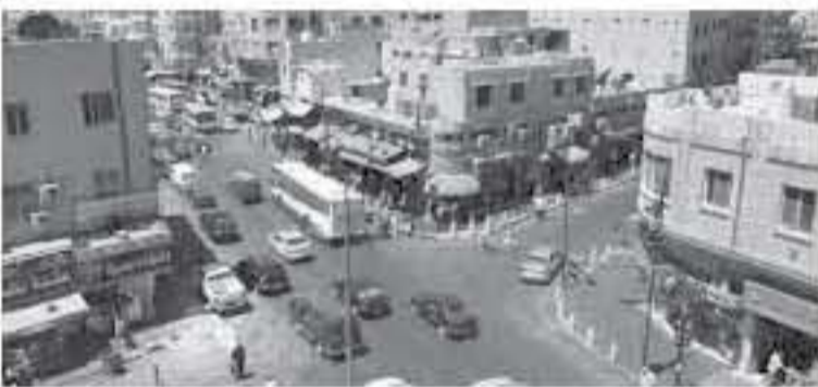
الابناب - عمان

تحتية سليمة وأمنة تحمي القطاع التجاري من أي كوارث طبيعية كبرى.