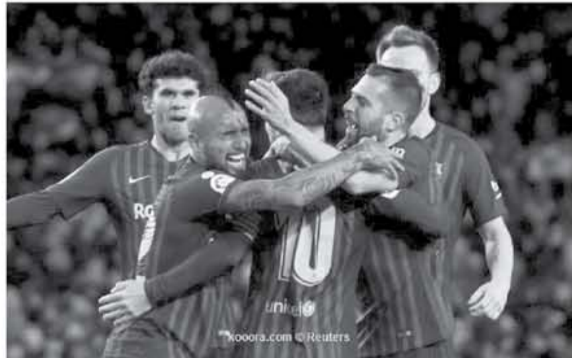
مدريد - وكالات

نجح فريق برشلونه، في تحويل تأخره بهدف إلى فوز صعب بنتيجة 3-1، على ضيفه رايو فايكانو على ملعب الكامب نو، في إطار الجولة الـ 17 من عمر الدوري الإسباني. ثلاثة برشلونه حملت توقيع جيرارد بيكيه في الدقيقة 38، وليونيل ميسي من ركلة جزاء في الدقيقة 41، ولويس سواريز في الدقيقة 42، بينما سجل راؤول دي توماس الهدف الوحيد لرايو فايكانو في الدقيقة 71. وتكررت شبكة أوبسا، للأحصائيات أن برشلونه بات أكثر فريق في الدوريات الخمس الكبرى في أوروبا، بتتس نقاطا من المباريات التي يتأخر فيها بالنتيجة، بواقع 20 نقطة هذا الموسم. ولهذا الانتصار، ارتفع رصيد برشلونه إلى 73 نقطة في صدارة ترتيب التيجا، بينما تجعد رصيد رايو فايكانو عند 33 نقطة في المركز التاسع عشر.