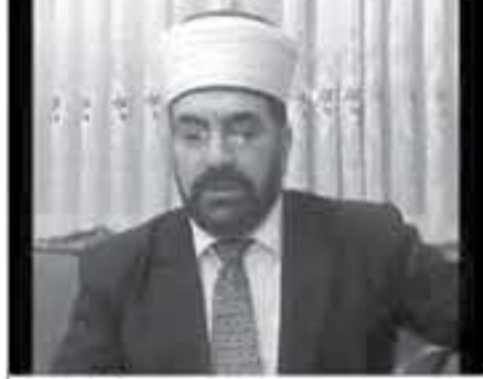
القاضي عمر الجاني (أرتمية)

اللزامة حول معلومات شبهات الفساد المقدمة من طرفه والتي نيه إليها دون بيان هويته، وهفا للتشريعات الناظمة لعمل الهيئة. وأكد ان الهيئة ستقوم أيضا، وبنه على المعلومات الواردة على لسان الخبير، في الفيديو المتداول بالتحقق فيما اذا كانت هناك علاقة سببية بين حالته الى التناعد والمعلومات المقدمة منه ام لا.