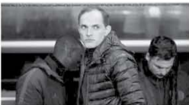
باريس - وكالات

وتفادي حالة الغضب الجماهيري، وأشارت إلى أن الجماهير الباريسية أطلقت حملة عبر مواقع التواصل الاجتماعي ضد الفريق، ورفضتها بملعب مسرانيس إس جي. واستأنف الفريق الباريسي تدريباته يوم أمس بعد راحة سلبية حصل عليها لمدة 3 أيام. ويستعد إس جي، لمواجهة دييجون، يوم غد الثلاثاء، في لقاء من الجولة 18 للدوري الفرنسي.