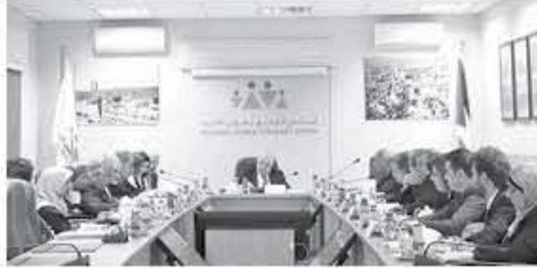
الابناب - عمان

والصديق لحقوق الطفل والذي ساهم في إعادة مجموعة من الأطفال واليهافيين لتعريف أقرانهم بحقوقهم واحتياجاتهم سواء من الناحية الصحية أو التعليمية أو الاجتماعية أو القانونية، وجاء بلفة مبسطة من خلال كتابة يسرد ما وجد لأطفاله، واشتماله على مواد من اتفاقية حقوق الطفل تحت شعار "هل تعلم" وسيميل المجلس على إعداد التقرير الوطني الدوري لحقوق الطفل وتقرير الظل لحقوق الطفل من قبل اليافيين.