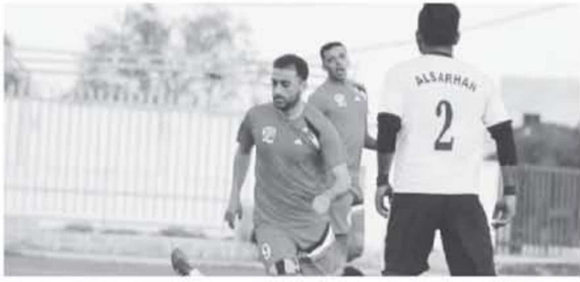
المرحلة الثانية، فيد التعادل ١-١، احتكم الطرفان الى ركلات الترجيح، لتتسلم للمنشية ٢-١، وكانت فرق الفيصلي والعقبة وام القطيف وشباب الاردن والخلدية سيل وأن تأهلت الى دور الستة عشر بالبطولة.

حفل كل من البقعة واليرموك والمنشية الفوز في الدور ٢٢ من بطولة كأس الاردن ليتأهلون الى الدور ١٦، ويواصلون متوارهم في البطولة. واستطاع البقعة (درجة محترفين) ان يتجاوز فريق سعا السرحان (درجة اول) بهدفين دون رد، في لقاء شهد افضلية واضحة للبقعة في اغلب فترات اللقاء، ليتجح في تجاوز الدور، وحجز مقعد في الدور ١٦. وضرب اليرموك (درجة اول) شيكاً ضيقه الهائض (درجة ثانية) بأربعة اهداف مقابل هدف وحيد، ليتهيئ اليرموك مشوار الهاشمية في بطولة الكأس الذي وصل للدور ٢٢ بعد فوزه على نادي صفا (درجة ثانية). وفي لقاء منير، كان المنشية (درجة اول) قريب من مغادرة بطولة الكأس، لولا ان انصهته ضربات الحظ، امام نادي جرش