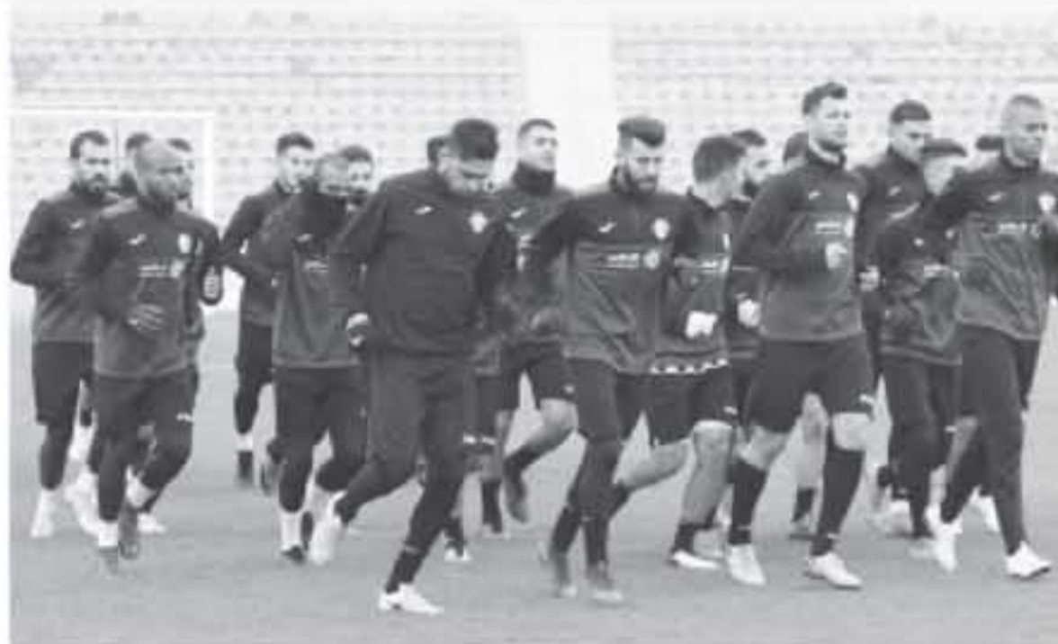
بمواجهة نسور قاسيون، تم في (٢٩) امام اسود الراشدين.