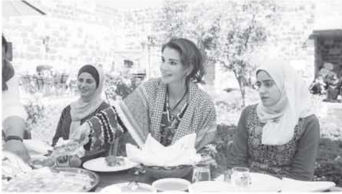
الملكة على اليوم الاربعي وفازت في كثير من الاحيان لاجلها لتصبح الامور وتتناسي الاجازات والقدرات والشغلات التي استطاع المواطن الاردني من خلالها تجاوز الكثير من التحديات والصعاب...

التياب في الخدمات العامة وإطلاق قراهم في بناء المجتمع، وترسيخ مفهوم المواطنة الفاعلة في المجتمع، وتعزيز العمل التطوعي والثقافة، وتعزيز الثقة بالنفس والعمل الجماعي وتنمية القدرات.