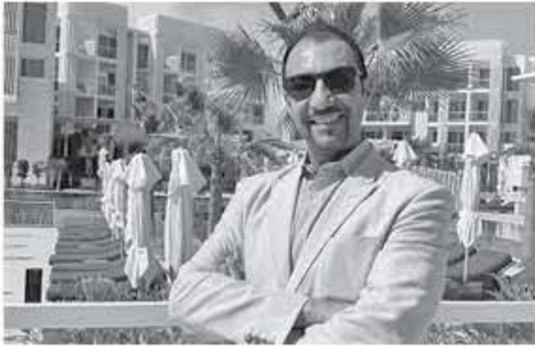
الانباط - العقبة

يفتح أبوابه يوماً بيوماً ليُتيح للضيوف فرصة استعادة الطاقة والحيوية طيلة فترة الإقامة، فهو مجهز بأحدث المعدات الرياضية، ومنها آلات الجري والدراجات الثابتة وآلات الوزن، بالإضافة إلى الأوزان الحرة. ويستمتع الضيوف الصغار في نادي الأطفال من خلال المقامرات والأنشطة والألعاب لظهاء أوقات مبهلة بالمرح ومع احتشاق ضائفة لاينالغ الأكثر ديناميكية في العقبة، سيتمكن الضيوف من تجربة أروع الأجواء الترفيهية مع المدي جى والعديد من النشاطات والعروض المباشرة. ومن الجدير بالذكر أن منتجج حياة ريجنسي العقبة آيلة يعد أول فندق يخطوي تحت العلامة التجارية المرموقة حياة ريجنسي، وثاني فنادق المجموعة في المملكة الأردنية الهاشمية، إلى جانب فندق جراند حياة عمان. ويعد المنتجج الجديد أول منشأة فندقية يتم افتتاحها ضمن مشروع آيلة على الشواطئ الشمالية لمدينة العقبة. ويضم المنتجج 286 غرفة وجناحاً توفر جميعها إطلالات ساحرة ومناظر خلابة على البحيرات الشاطئية الصافية وجبال العقبة الشاهقة وقرية الرمس. //