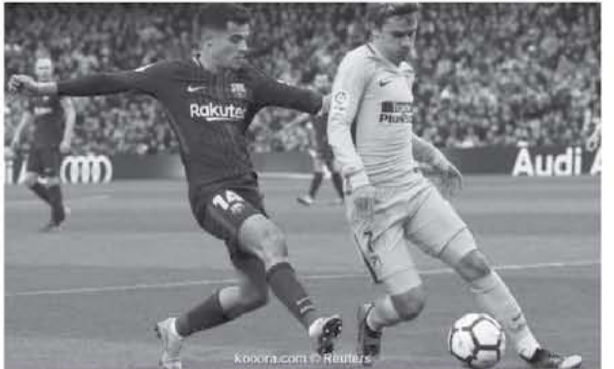
برشلونة - وكالات

وأوضح المصدر أن برشلونه، لم بعد متمسكا بخدعات النجم البرازيلي كوتينيو، إذ يريد النادي الكتالوني بيع لاعبه بمبلغ ١٠٠ مليون يورو، وأضاف أن "البوجرانا" سيستفيد من هذا المبلغ الكبير من أجل إقناع إدارة أثلنتيكو مدريد بالسماح تجريزمان بالانتقال إلى برشلونه / ونوه نفس المصدر إلى أن مدريد اليارسا إرنستو فالبيردي لن يجد صعوبة كبيرة في منح جريزمان في كتيبة الفريق، إذ يعرف الدولي الفرنسي أجواء الدوري الإسباني جيداً، فضلاً عن مواجهته لبرشلونه في أكثر من مرة، ويرتبط أنطوان جريزمان (٢٨ عاماً) بعدد مع أثلنتيكو مدريد منذ حتى صيف ٢٠٢٣، بيد أن خروج "الروخيبلاكوس" من دوري أبطال أوروبا على يد يوفنتوس، قد يدفع النجم الفرنسي إلى تغيير وجهته الكروية والانتقال إلى برشلونه، الذي كان قريباً للغاية من ضم اللاعب صيف السنة الماضية / في المقابل، يعيش فيليب كوتينو (٢٦ عاماً) فترة صعبة في برشلونه، فقد لازم الدولي البرازيلي دكة البدلاء في أكثر من مرة، بالإضافة إلى تعرضه إلى الإصابة، التي أبعدته عن المنطيل الأخضر فترة طويلة.