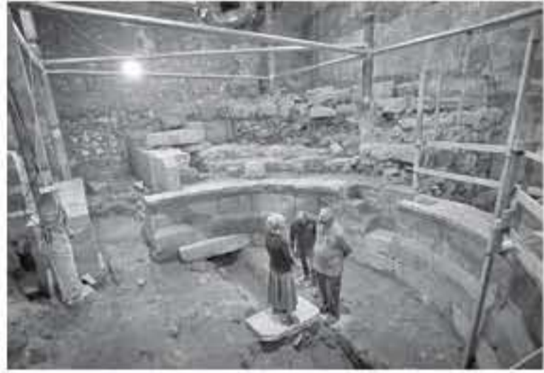
القدس المحتلة - وكالات

بدأت جمعية "إعاد" الاستيطانية و"سلطة الآثار" الإسرائيلية مؤخراَ بأعمال لفتح حفرة تحت أسوار القدس العتيقة بهدف تمكين السائحون من الدخول من "مدينة داود" المزعومة في بلدة سلوان إلى منطقة "الحديدة الأثرية" قرب حائط البراق. وذكرت صحيفة "هآرتس" العبرية أن فتح هذا الدخول يلزم بتفكيك جزء من مبنى يعود تاريخه إلى العصر الأموي. وأشارت إلى أنه فيما يطلق عليه "الحديدة الوطنية عبر قاهد" (سلوان) جنوبى البلدة العتيقة، والتي تديرها جمعية "إعاد"، تم حفر عدة أنفاق تحت الأرض يفترض أن ترتبط بشروع سياحية كبير باسم "طريق الحجاج"، بينها النفق الذي يطلق عليه "الشارح المدرج"، ويبدأ من عين أم الدرج في سلوان