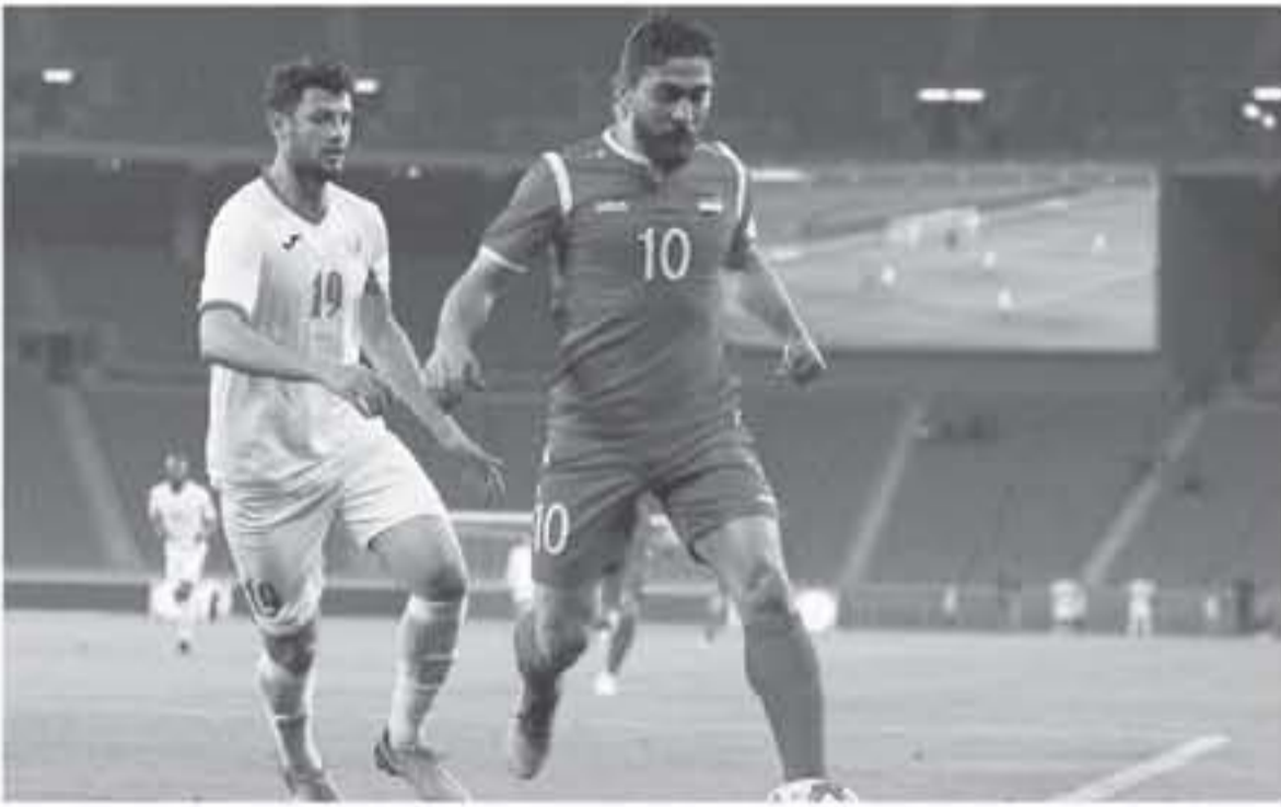
البطولة حيث يتوجب على منتخبنا الفوز بفارق هدفين للتأهل بالبطولة.