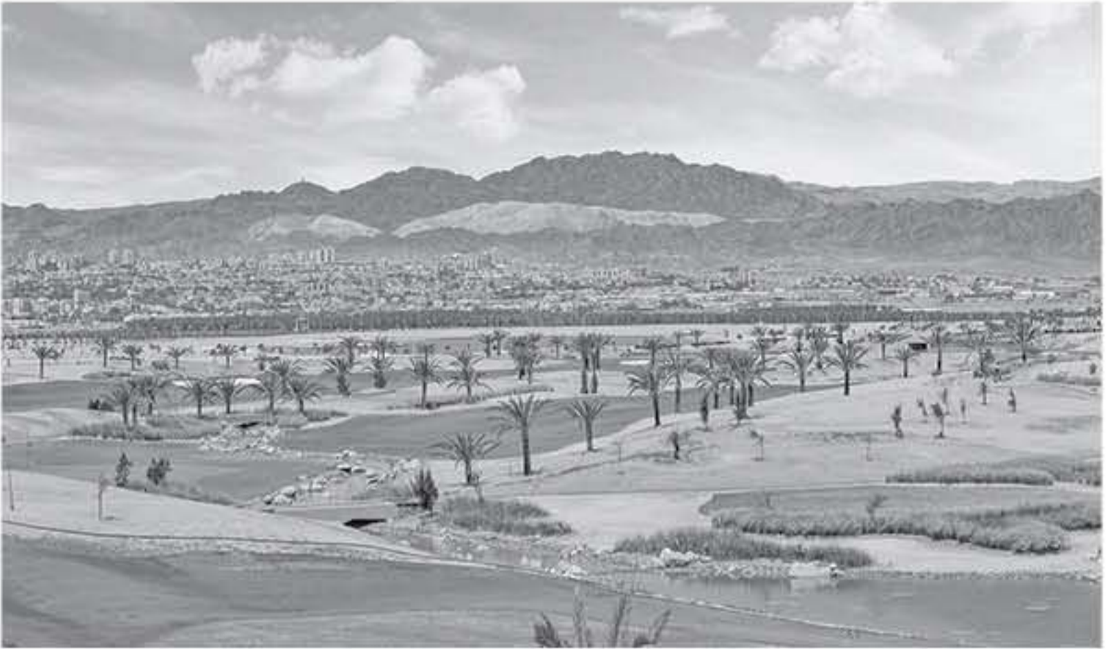
الانباط - العقبة

دودين، تظاهرة كبرى ترؤج لإمكانات العقبة السياحية وقدرتها على التنظيم عالية المستوى