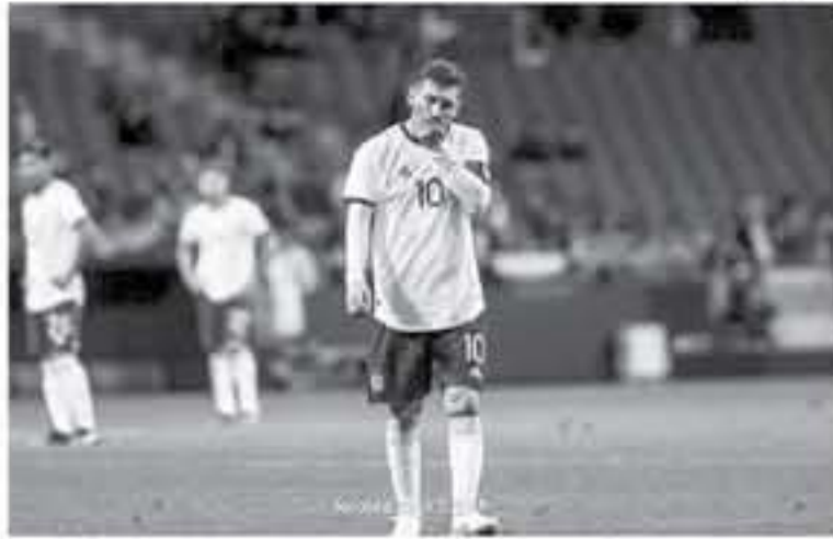
عواصم - وكالات

الجولة الأولى من التصفيات المؤهلة لبطولة يورو ٢٠٢٠، وحصلت البرتغال وأوكرانيا على نقطة وحيدة لاحتلال المركزين الثاني والثالث، خلف التصدير لوكسمبورج ب٣ نقاط، عقب فوزه على لستونيا (١-٢)، وفشل كريستيانو رونالدو، قائد المنتخب البرتغالي، في إنقاذ فريقه أمام الدفاع المحكم من الضيف، في أول مباراة له بعد عودته لتصوف الضيف، الربع ساعة الأولى من المباراة لم تشهد أي خطورة على كلا المرشحين، فيما كان المنتخب البرتغالي هو المستحوذ على أول دقيقة لكن بدون خطورة، بينما لعب المنتخب الأوكراني على إغراق المساحات ومحاولة استغلال الهجمات المرتدة، وألقى حكم المباراة هدفا سهلا وييام كارفاتو، لاعب وسط البرتغال، بالدقيقة ١٧، بعد عرضية من الناحية اليمنى حولها كارفاتو بالرأس في الرمي، ليقرر الحكم إلغاء ما ياتي وجود حالة لنيل.