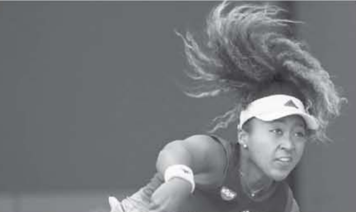
ميامي - وكالات

فازت ٢-٠ و٥-٧، على الأمريكية أليسون ريكس.