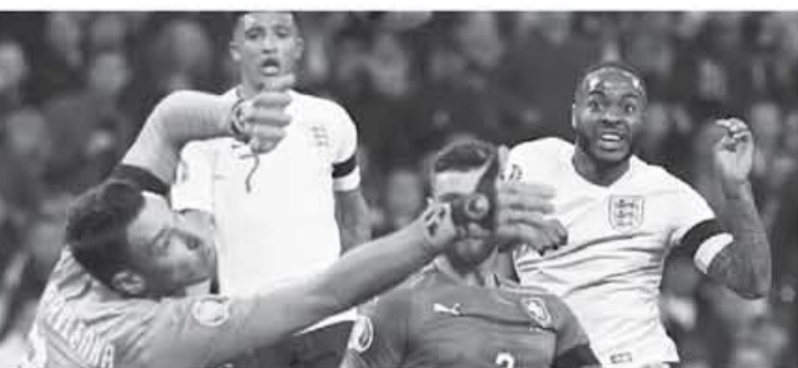
لندن - وكالات

يهدى هدفاً إلى أكبر المنتخب، مع صورة للاعب وهو يركض من فحميص داخلي في إهداء لتراجل الياق.