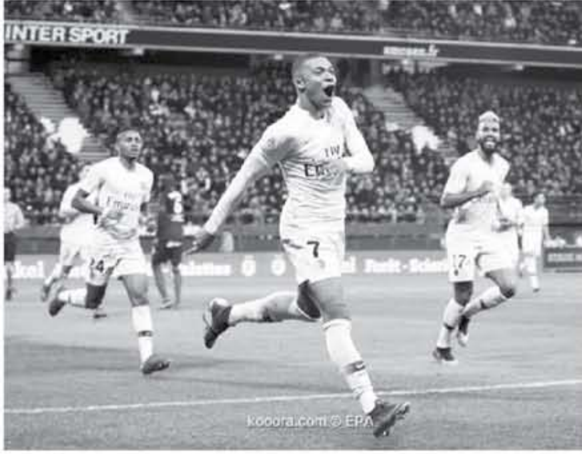
أشارت إلى أن ريال مدريد خصص ٣٠٠ مليون يورو، لإبرام صفقات قوية في الميركاتو الصيفي المقبل، يأتي على رأسها النشر بخدمات جوهرية

أرجح تقرير صحفي فرنسي، يوم امس المستنار عن التسرع الذي وضعه كليان مبابي، مهاجم باريس سان جيرمان، من أجل الموافقة على الانتقال إلى صفوف ريال مدريد، في الموسم المقبل، ووفقاً لصحيفة "ليكيب، الفرنسية، فإن صفقة انتقال مهاجم سان جيرمان إلى المرينجي، ستكلف خزنة النادي الملكي قرابة ٣٠٠ مليون يورو، مقسمة إلى ٢٥٠ مليوناً للنادي الفرنسي، و٥٠ مليوناً لصالح مهاجم الديوك. وأشارت إلى أن مبابي سيحصل فإن في الموسم المقبل مع سان جيرمان إلى ١٣.٢ مليون يورو، وبالتالي فإنه لن يوافق على التوقيع لريال مدريد، إلا إذا حصل على ١٥ مليوناً في العام. ويهدد الرقم فإن مبابي سيصبح الأعلى راتباً في ريال مدريد، متخوفاً على نجوم بحجم جاريث بيل، كريم بنزيما، سيرجيو راموس، ولوكا مودريتش، وأكدت الصحيفة أن فلورنتينو بيريز، رئيس ريال مدريد، يفضل إتمام صفقة مبابي، عن التعاقد مع زميله البرازيلي نيمار دا سيلفا، في الموسم المقبل. يذكر أن العديد من التقارير،