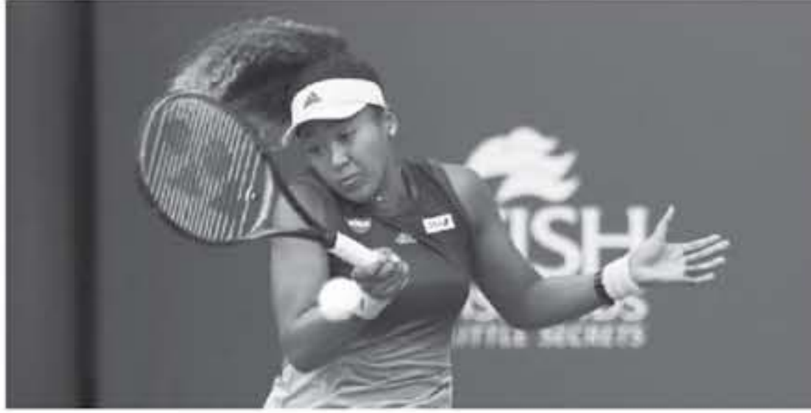
ميامي - وكالات

وعدت اليابانية نومي أوساكا، المصنفة الأولى عالمياً، بطولتي ميامي المفتوحة للتنس، بعد خسارتها في لقاء من ٣ مجموعات أمام الكابولية هيبه سو وي المصنفة الـ ٢٧. وخسرت هيبه المجموعة الأولى، لكنها فازت (٦-٤)، و(٦-٧) و(٦-٣) لتحقق الانتصار المفاجئ على بطلة أمريكا المفتوحة، وأستراليا المفتوحة. وجاء خروج أوساكا بعد انسحاب سيرينا ويليامز الفائزة باللقب ٨ مرات، بسبب معاناتها من إصابة في ركبتيها اليسرى. وهذه الإصابة الثانية على التوالي التي تتسبب عنها سيرينا، بعدما فعلت ذلك في بطولة إنديان ويلز الأسبوع الماضي بسبب المرض.