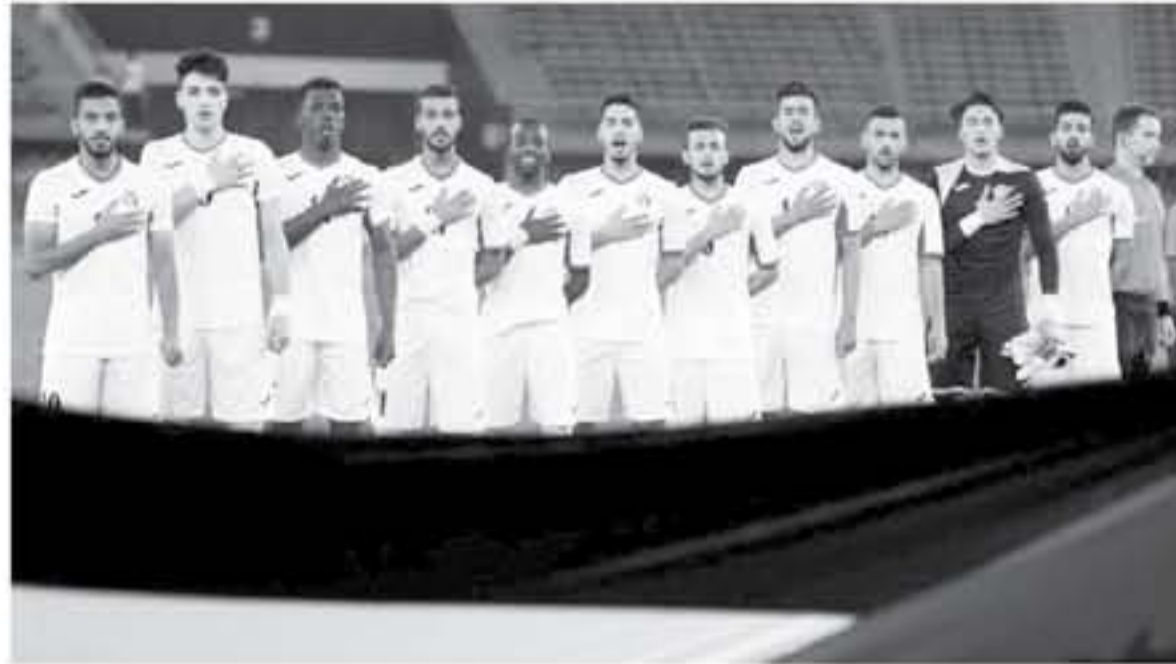
وحيدا المجموعة الخامسة، فيما بقي منتخب قيرغيزستان بلا نقاط.