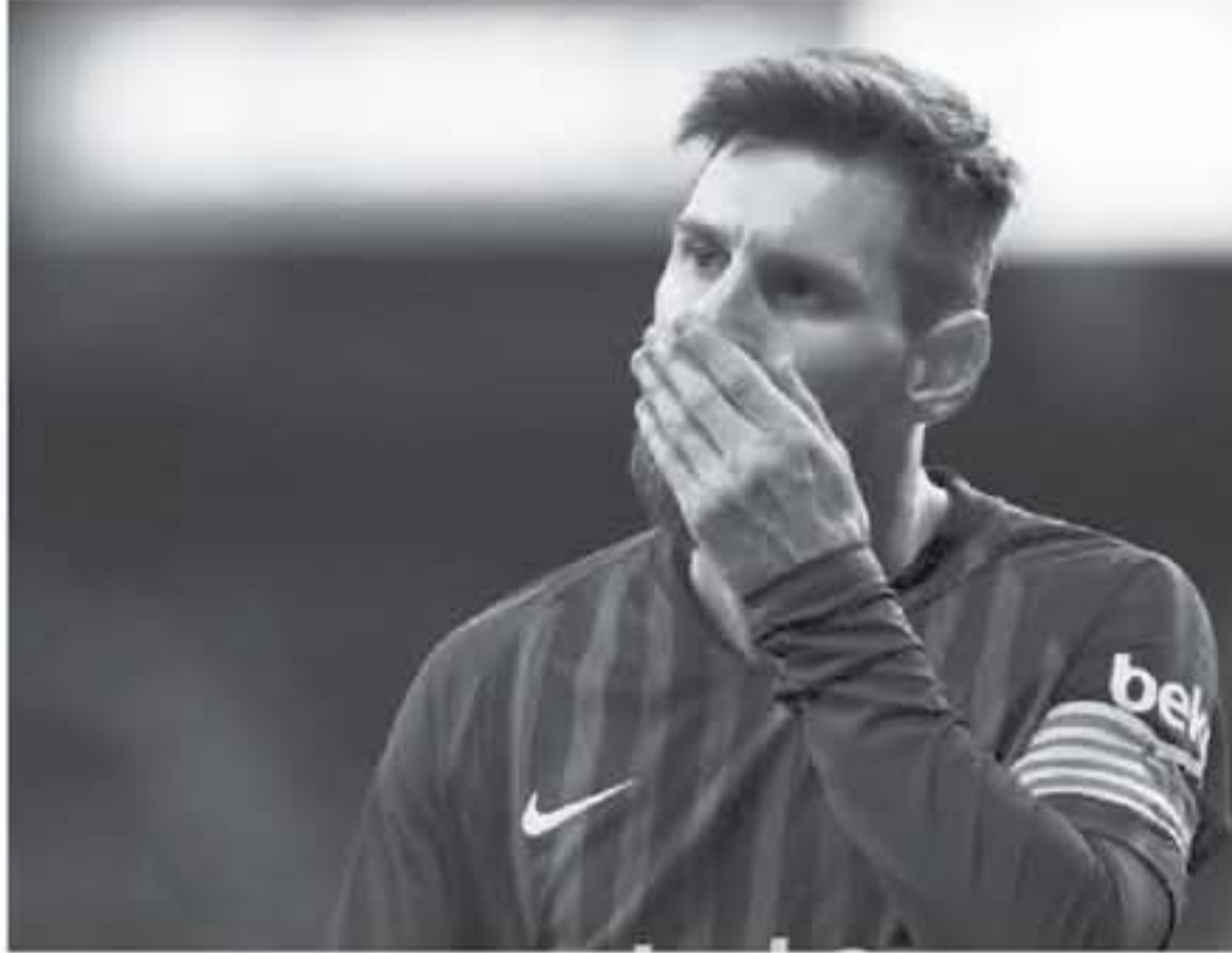
برشلونة - وكالات

كشفت تقرير إسرائيلي، يوم امس عن مفاجأة تتعلق بإصابة ليونيل ميسي، نجم برشلونة، خلال مشاركته مع منتخب الأرجنتين أمام فنزويلا، يوم الجمعة الماضي، والتي خسرها فريقه بنتيجة ١-٣. ووفقاً لصحيفة "موندو ديبورتيفو، الإسبانية، فإن ميسي كان يشعر بالألم في الحوض قبل الانضمام إلى منتخب الأرجنتين، بل إنه خاض مباراتي ريال مدريد في سانتياجو برنابيو، وسجل هاتريك مرتين في إشبيلية وريال بيتيس أثناء معاناته من نرس الإصابة. وأشارت إلى أن ميسي سيحصل على راحة لمدة أسبوع قبل أن يعود للمشاركة مع برشلونة مرة أخرى، لأنه يريد أن يصل إلى المرحلة الحاسمة من الموسم بكامل لياقته البدنية والفنية. وكان ميسي شعر بتفاقم الألم الحوض خلال لقاء فنزويلا، ولذلك انقل مع ليونيل سكالوني، مدرب الأرجنتين، على غيابه عن مباراة الأرجنتين الودية أمام المغرب، غد الثلاثاء. ويستضيف البوجرانا نظيره إسبانيول في ديربي إقليم كتالونيا، السبت المقبل. ضمن منافسات الجولة الـ ٢٩ من الليجا.