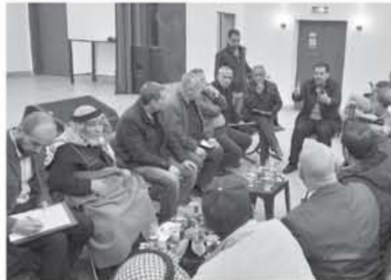
عمل في الحسبة لانه سيكون سوقاً تجارياً مميّزا ولأول مرة وضمن اشراف هندسي المتدجج، ويما يحافظ على جمالية السوق التجاري. وتضمن جهود التجار والذين ابدوا معنات كامل التعاون لتنفيذ المشروع على ارض

أكد رئيس بلدية المفرق الكبرى عامر نابل الدغمي، التوصل مع جميع تجار الحسبة إلى البدء بإعادة تأهيل سوق الحسبة وضمن مواصفات حديثة تلبي متطلبات المرحلة في تطوير الوسط التجاري. وأضاف الدغمي خلال لقائه بممثلي التجار في الحسبة وبحضور أعضاء اللجنة المشرفة على مشروع الحسبة امس، ان البلدية وضعت على سلم أولوياتها تقديم خدمة أفضل للمواطنين، حيث جاء مشروع إعادة الحسبة والتي تعد نقلة نوعية وقرراً تاريخياً بمشاركة اصحاب العلاقة لتصويب السوق التجاري في المدينة والذي سيكون تغييراً ملحوظاً سيستفيد المواطن في العرب العاجل بعد ان تم طمر المعطاة بشأن الحسبة والذي سيبدأ في الايام المقبلة. وبين الدغمي ان المشروع من المتوقع ان يبدأ ان يوفر فرصاً تشغيلية لحوالي 10 فرصة