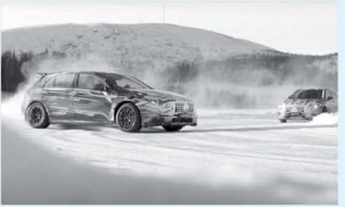
دبي - عرب جي تي

هذا ليس أول استعراض تشويقي لتقوم به نسخة تجريبية من سيارة مرسيدس AMG A45 2020 الجديدة كلياً القادمة قريباً، ولكن هذا أول استعراض دريفت على الثلج تقوم به سيارة الهالكاتيك الأتالية عالية الأداء يتم نشره من خلال فيديو رسمي على قناة Mercedes AMG على اليوتيوب. استعراض دريفت على الثلج قامت به نسختين تجريبيتين من سيارات مرسيدس ام جي ام جي ام جي - Mercedes AMG A45 2020 بالتصميم على مضمار ثلجي خاص في السويد. فبعد أن زودناكم في أخبار سابقة بالصور ومعلومات الرسمية الأولى لسيارة مرسيدس AMG A45