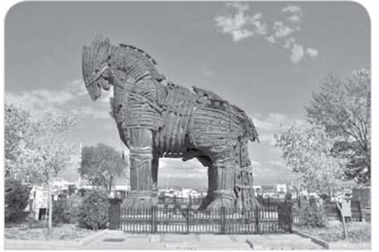
الأنباط - رصد جمانة خنفر

وأكثرها شعبية بين السالحين، حيث يعود تاريخه إلى عام ١٩٤٠ ويهدف إلى الحفاظ على التقاليد والثقافة الخاصة بالأجيال الماضية من خلال مجموعة متنوعة من الأطعمة والأطباق التركية الأصيلة التي يتم تقديمها.