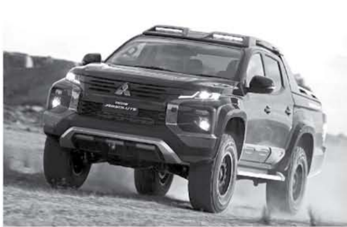
دبي - عرب جي تي

ستعرفكم في هذا الخبر لأول مرة على بيك اب ميتسوبيشي تريتون ايسلوت - Mitsubishi Triton Absolute الاختيارية التي ظهرت رسمياً على الإنترنت لتمهد الطريق نحو مركبة بيك اب عالية الأداء قادمة من شركة ميتسوبيشي اليابانية لتنافس بالتحديد فورد رينجر رابتر. تعتبر مركبة ايسلوت الاختيارية نسخة خاصة من بيك اب ميتسوبيشي تريتون، الذي يحمل اسم ميتسوبيشي A35 في أسواقنا، ويعد ظهور هذه المركبة من خلال صوراً رسمية على الشبكة العنكبوتية سبب إطلاقها رسمياً ضمن فعاليات معرض بانكوك للسيارات 2019 إن شاء الله، لتمهد هذه المركبة الاختيارية نحو نسخة إنتاجية قادمة في المستقبل. تتميز مركبة بيك اب ميتسوبيشي تريتون ايسلوت الاختيارية من الخارج، مقارنة مع طراز تريتون الأساسي، بزيادة ارتفاعها بمقدار 1,87 إنش مما يجعل هذه المركبة الاختيارية تستطيع اقتحام أصعب الطرق الوعرة بدون أن تتعرض لأضرار، كما حصلت على أقواس عجلات أكبر وحولتها أطرافها Falken Wildpeak التي مخصصة للطرق الوعرة، وعمل الصانع الياباني على تحسين نظام التعليق في مركبة البيك اب الاختيارية