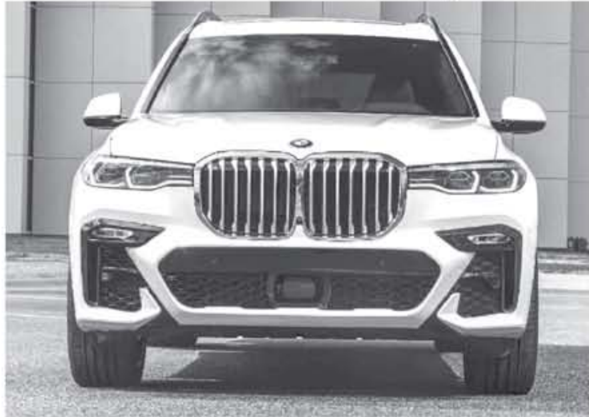
دبي - عرب جي تي

بي ام دبليو X7 2019 أضخم وأجدد سيارة في أسطول عائلة سيارات بي ام دبليو الكس - BMW X - ستكون نجمة تثيرنا هذا وتضم تجارب قيادة هذه السيارة الفاخرة مؤخرًا في مدينة ساغانا بولاية جورجيا الأمريكية. التصميم الخارجي لـ سيارة بي ام دبليو X7 2019 مستمد من نسخها الاختيارية لتتميز بحصولها على واجهة أمامية مع شبكة ضخمة تجعل هوية سيارات بي ام دبليو الشهيرة، يحيط بهذا الشكل مصابيح تصورية التتصيم مع أضواء هاي بيم ليزر LED متوفرة بشكل قياسي على كافة النسخ، أسفل هذه المصابيح صادم عريض يحتوي على فتحات تهوية ضخمة.