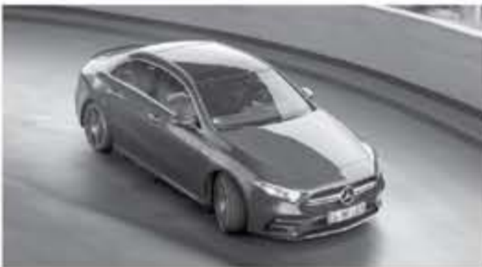
دبي - عرب جي تي