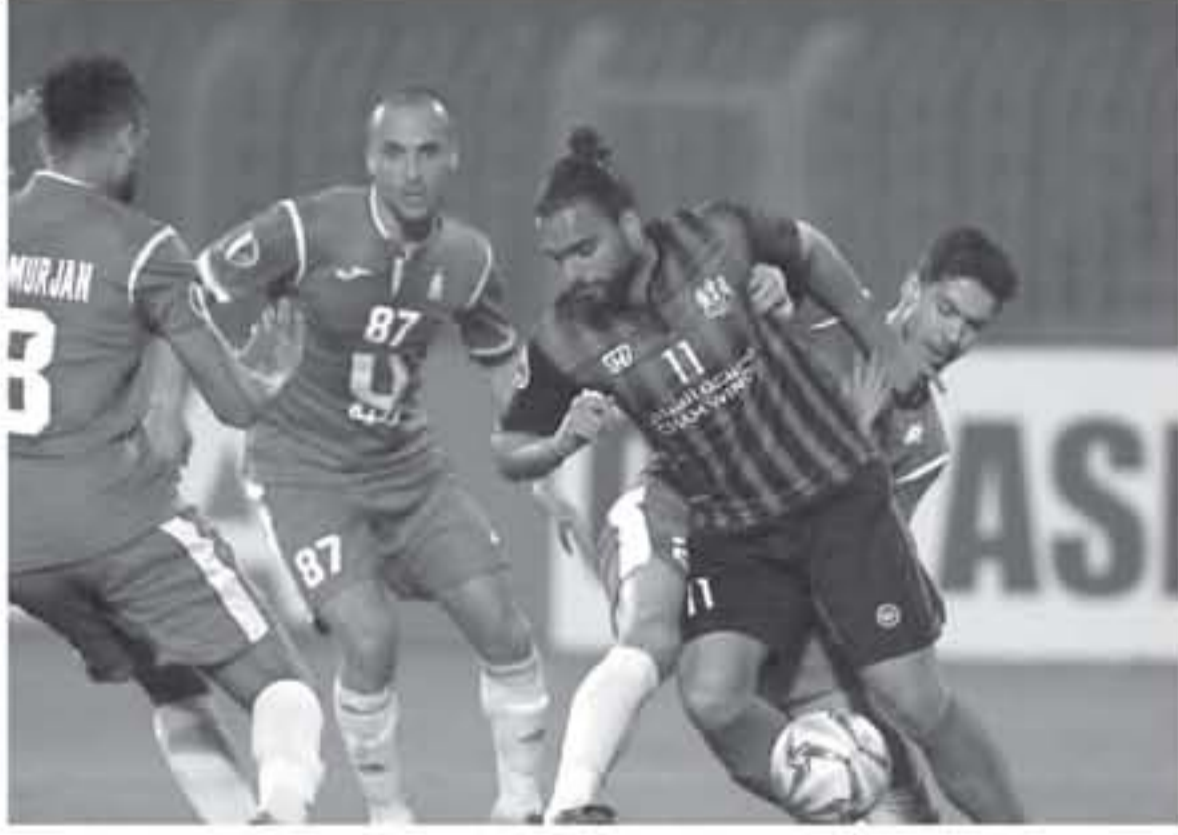
صاحب المركز الأول في كل مجموعة، إلى جانب أفضل فريق يحصل على المركز الثاني في المجموعات الثلاث.