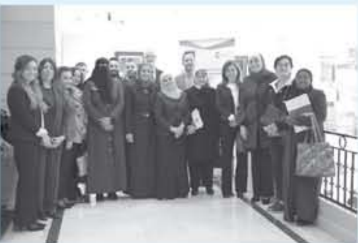
وقالت عضو الهيئة المنتلفة للتدريب المكنتورة مسمرا الحجاج إن كل الإجراءات

اجتماعياً والعمل على نشر التوعية بأهمية مشاركتها في شتى المجالات حتى ينسني لها القدرة على خوض المنافسة السياسية مع الرجال.