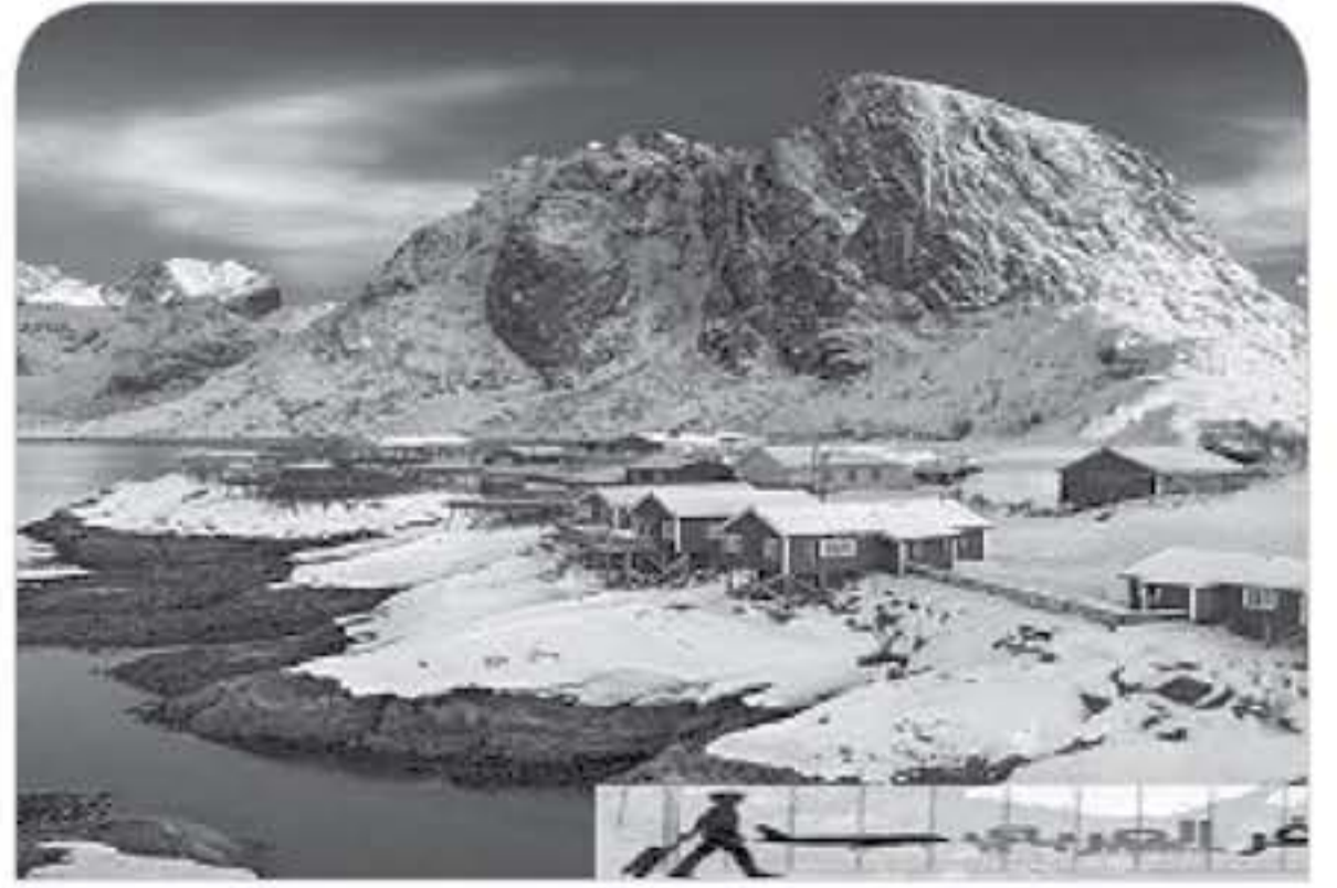
الأنباط - رصد جمانة خنجر