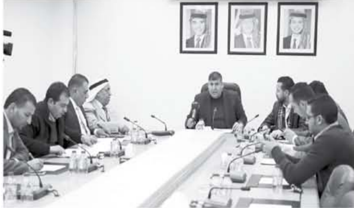
تعريف الطلبة بالقدس، وإعادة لتدريس مادة القضية الفلسطينية، ولتعميق

بحث لجنة فلسطين النيابية، امس برئاسة النائب يحيى السعود، التوصيات التي خلصت اليها ندوة "الإعلام والقدس" التي نظمتها اللجنة مؤخرا.