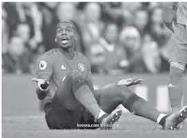
لندن - وكالات

يوفنتوس السابق في الصيف المقبل. وأوضحت الصحيفة أن بول بوجبا يطلب الحصول على راتب أسبوعي يصل إلى 50 ألف جنيه إسترليني، من أجل التوقيع على عقد جديد مع مانشستر يونايتد. ويحصل اللاعب الفرنسي، حالياً على راتب أسبوعي يبلغ 30 ألف جنيه إسترليني، بينما يأتي التقييمي أليكسيس سانتيز على قمة هرم الرواتب في قلعة أولد ترافورد، بـ 50 ألف جنيه إسترليني أسبوعياً. وتؤكد الصحيفة أن راؤول ليركس، وأشارت إلى أن اليونانيته سيبقى في مدريد بوجبا حتى الصيف 2021، لقطع الطريق أمام ريال مدريد الذي يطمح للانضمام على لاعب