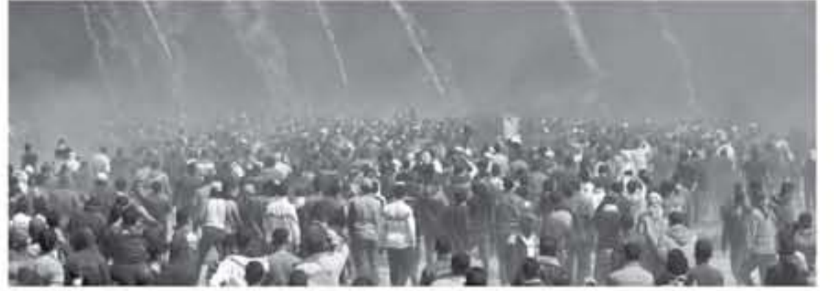
غزة - وكالات

أصيب عدد من المواطنين بالرصاص الحي والخطأ والاختلال جراء اعتداء قوات الاحتلال الإسرائيلي على المتظاهرين السلميين المشاركين في جمعة «انتصار الكرامة» شرقي قطاع غزة. وأعلنت وزارة الصحة إصابة ٣٣ مواطناً بجروح مختلفة، جراء اعتداء جنود الاحتلال على المتظاهرين بصيحات العودة شرقي محافظات القطاع، وذكر الصحة أن الإصابات وصلت إلى مستشفىها بالقطاع لتلقي العلاج اللازم. وأشار مراسل "صفا" بمخيم العودة قرب موقع "ملكة" شرقي مدينة غزة عدد من المواطنين بالرصاص الحي والخطأ، فيما أصيب آخرون بالاختلال بالغاز المسيل للدموع. وذكر أن جنود الاحتلال المتمركزين قرب السياج الأمني الفاصل أطلقوا قنابل الغاز بتكلفة صوب جموع المتظاهرين السلميين، ولتت إلى أن جنود الاحتلال أطلقوا صوب