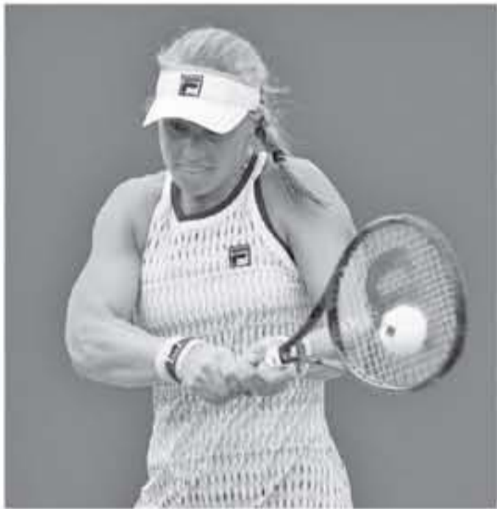
أمريكا - وكالات

الهولندية، والتي كانت تلعب على أرضيتها المفضلة. وفات ساكاري، أنا سيرة للغاية ولا يمكنني الحديث. مرتت بشهرين في غاية الصعوبة لعب بطولة أستراليا المفتوحة. وفي وقت سابق، واصلت السويسرية بليندا بنتشيتش، عروضها المميزة بفرزها 2-0 على تيلور لاونسند لتبلغ دور الثمانية، بينما فازت الكرواتيّة بشرا ماريتش على جيسكا بيجولا بنتيجة 2-0 و 2-1.