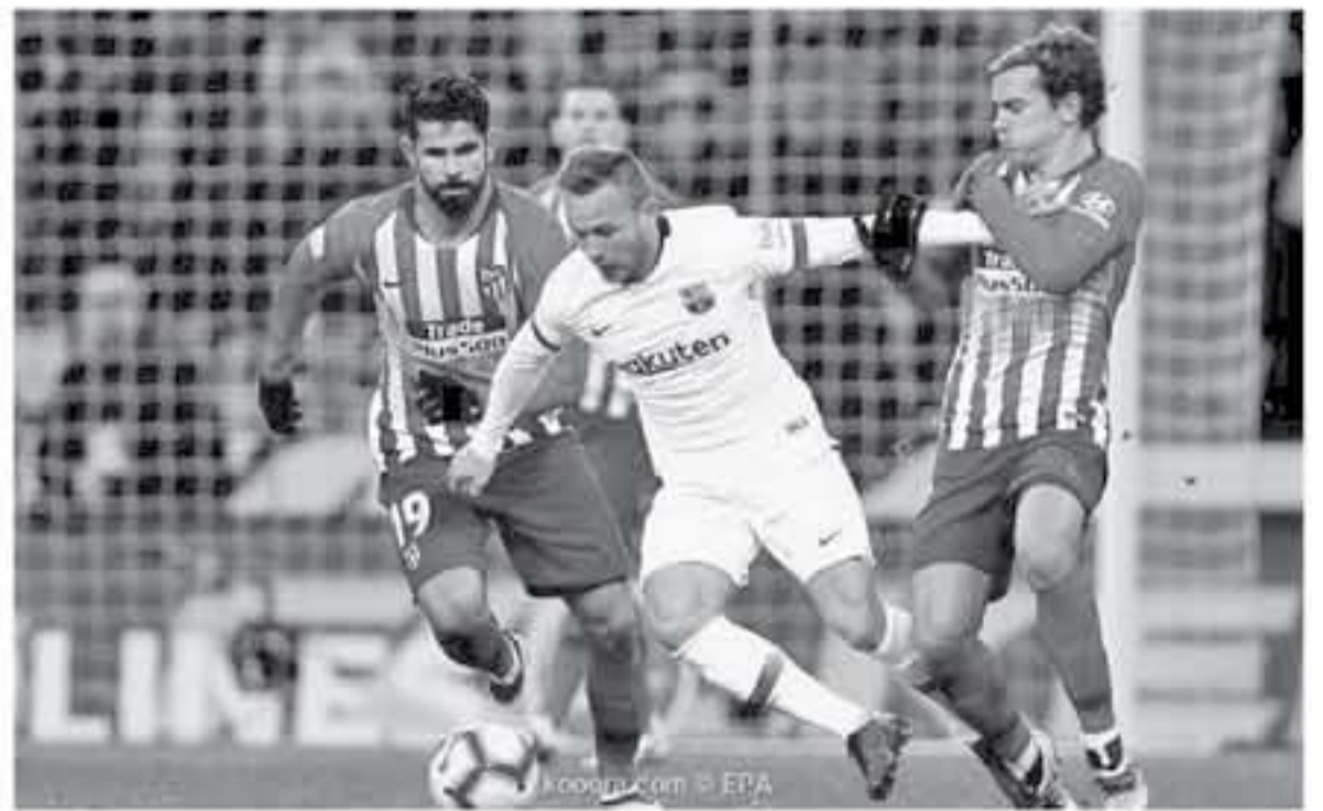
مدريد - وكالات

مدريد، بعدما انشغلت تعادلاً مثيرة أمام فياريال بنتيجة 1-1 في الجولة الماضية من الليجا، أما اتليكو مدريد، واصل الضغوط على متصدر الترتيب، بعد أن فاز 7 مرات في آخر 8 مواجهات وتعادل برشلونة مع اتليكو مدريد بنتيجة 1-1 في مباراة الدور الأول بالليجا. وقال زين الدين زيدان، مدرب ريال مدريد، إن فريقه سيواصل المنافسة على لقب الليجا، طالما أن هناك احتمالاً حسابياً