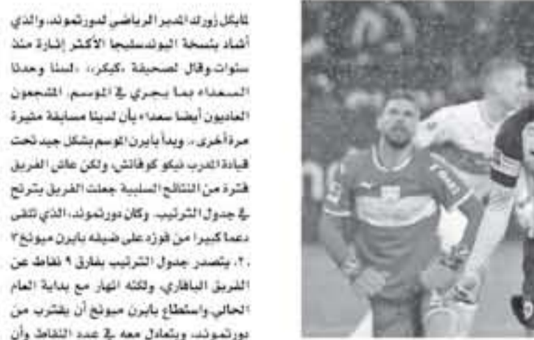
ميونيخ - وكالات

ميونيخ متصدراً لجدول الترتيب برصيد 74 نقطة، ويسعى للتتويج بلقب الدوري للمرة الأولى منذ 2012. فيما يسعى بايرن ميونيخ الوصيف بفارق نقطتين للتتويج باللقب السابع على التوالي ولكنه ينتظر للحظة الأخيرة للمرة الأولى منذ سنوات. ورغم أن بايرن ميونيخ لا يتصدر جدول الترتيب ولكنه يمثل المرشح الأبرز للفوز باللقب. وها