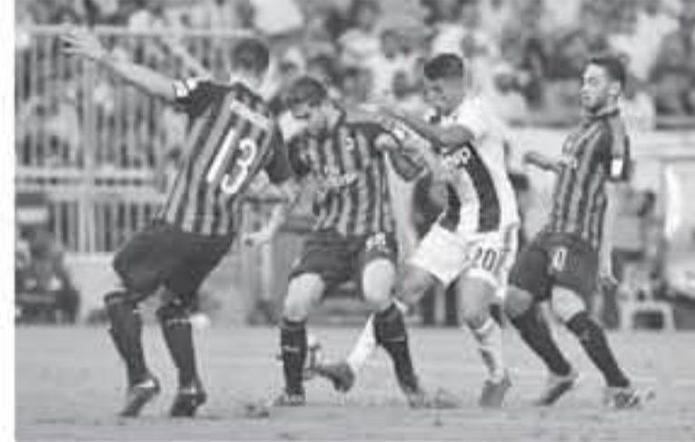
روما - وكالات

وه الانتصارات بفارق 3 أهداف وسجل أكثر من 3 أهداف في مباراة واحدة فقط بالدوري. وشهدت مسيرته في السابعة حتى الآن عدداً محدوداً من الانتصارات المثيرة والعمدة في النتيجة وفي معظمها كان هدف الفريق تحقيق الفوز بأقل مجهود وتوفير الجهد للهدف الأساسي وهو دوري أبطال أوروبا. ويفيد رونالدو، بسبب إصابة في فخذه من مباراة ميلانو، وأصبحت مشاركته في نهاب دور الثمانية لدوري أبطال أوروبا أمام أياكس أمستردام يوم الأربعاء المقبل محالاً. في المقابل، تمثل المباراة اختياراً صعباً لفريق المدرب جينارو جالوزو صاحب المركز الرابع، آخر المراكز المؤهلة إلى دوري الأبطال. لكنها تأتي بعد الانتصارات في الدوري ثم اقتناص نقطة واحدة من آخر 3 مباريات وقال جالوزو عقب التمثال (1-0) على ملعبه أمام أوبينيزي المتواضع، واقتعدنا الأداء القوي الذي كنا عليه منذ 14 شهراً.. وأضاف: «منذنا الثاقبين شعوراً بضعفنا. يجب الاحتفاء بالهجوم، فركزنا أننا نمر بسرعة صعبة ويجب تجاوزها».