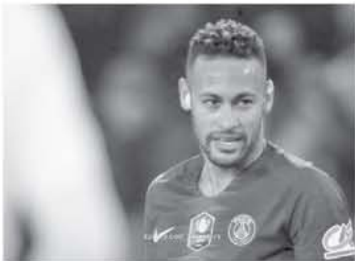
مدريد - وكالات

مع برشلونة، كنا فريقاً مميزاً داخل وخارج الملعب.. وأضاف ليمار، كانت العلاقة بيننا جيماً خاصة، وبشكل أقرب من لويس سواريز وليونيل ميسي، أعتقد تلك اللحظات بشدة. وعن إصابته التي منعت من المشاركة مع سان جيرمان في فترات حاسمة، أوضح أصعب اللحظات في حياة اللاعب، هي التي أعيشها، حيث أكون بعيداً عن الملعب وأخضع للجراحة، إنه أمر قهقري. وألم، لا التحمل البقاء دون الفريق وهو أمر ليس جيداً، لكنه جزء من عملنا.