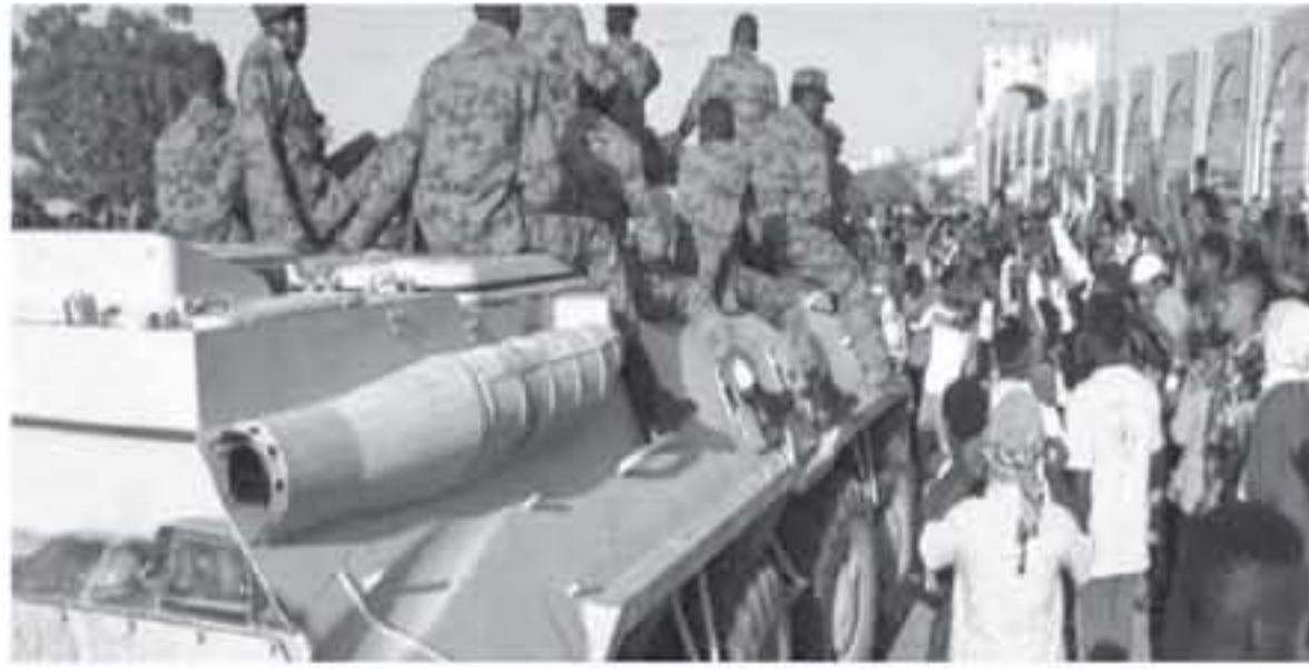
الانباط . وكالات

البشير، الرجل الذي ظهر إلى العلن من حشخ جماعة الإخوان المسلمين، واعتلى السلطة بحكم كونه الضابط الأعلى رتبة في الجيش السوداني المرتبط بالجماعة، انقلب على من أتوا به، وحكم السودان لـ ٣٠ عاماً، قبل الإعلان عن اعتقاله والتحكف عليه في بيان للقوات المسلحة امس.