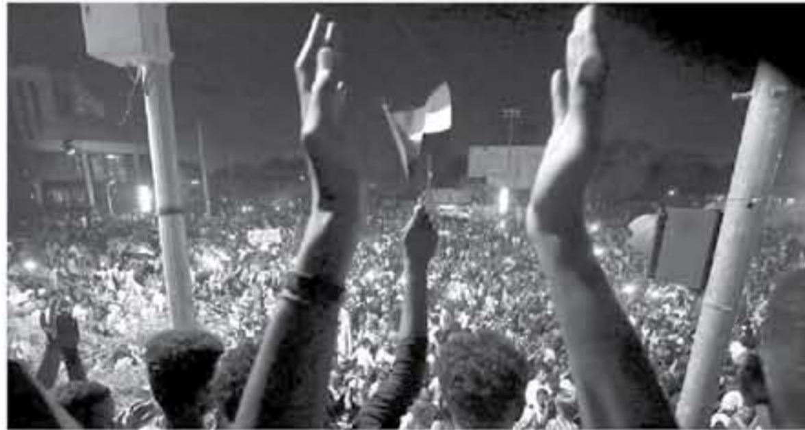
الانباط . وكالات

قال مصدر سوداني، إن التحرك السريع للجيش وقيامه بنزل البشير، لم يكن مرتباً بتلك السرعة، موضحاً ان ما دفعهم للاستتجال هو ورود أنباء بأن هناك مجموعات كانت تريد ان تفضي اعتصام المتظاهرين أمام القيادة العامة للجيش بالقوة صباح الخميس. وتابع المصدر، أن تلك الأنباء دفعت القوات المسلحة واللجنة الأمنية لسرعة التحرك خوفاً من وقوع مجازر بين المعتصمين، مشيراً إلى ان الجيش واللجنة الأمنية يبادروا قبل أن يربوا أمرهم بإعلان استلام الجيش للسلطة حتى يوقفوا أية تحركات أخرى يمكن أن تؤدي إلى إصابات وخسائر في الأرواح للمعتصمين أمام القيادة العامة للجيش.