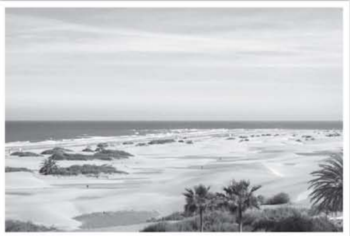
الأنباط - رصد جمانة خنفر

تعتبر غران كناريا بالتأكد واحدة من أجمل الجزر الإسبانية وأكثرها شهرة بين السالحين، حيث تقع على بعد 130 ميلاً من الساحل الأفريقي، وتعد ثالث أكبر جزر الكناري، وتعرف بين محبيها باسم جزيرة التناقضات، حيث تضم مزيجاً رائعاً من السكان المحليين مع التقاليد المحلية الرائعة والثقافة المتنوعة، ومع مساحة تبلغ حوالي 1.832 كيلومتر مربع، توفر غران كناريا فرصة رائعة للاستمتاع بالشواطئ الذهبية والرمالية، مع المسير على طول الكتيان الرملية في وسط الجزيرة، ذلك فضلاً عن الاستمتاع بالقرى الصغيرة المبهجة والتي تمتاز بالسحر الأصلي، ناهيك عن اكتشاف الحياة المفعمة بالحياة في مدينة لاس بالاس دي جران كناريا.