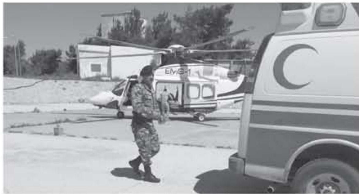
مركبة إسعاف تابعة لقيادة شرطة عمان السلطانية تنقل جوا ابن متقاعد عسكري تعرض لحادث سير في منطقة صلالة بمحافظة ظفار. وتقدمت الإسعاف الطبية لخدمة جوا ابن متقاعد عسكري تعرض لحادث سير في منطقة صلالة بمحافظة ظفار. وتقدمت الإسعاف الطبية لخدمة جوا ابن متقاعد عسكري تعرض لحادث سير في منطقة صلالة بمحافظة ظفار.

أوعز المدير العام للمديرية العامة لقوات الدرك اللواء الركن حسين الحوامة، بتسيب نداء أحد المتقاعدين العسكريين لإسعاف ابنة المصاب جواً بعد تعرضه لحادث سير. وذكرت مديرية قوات الدرك في بيان لها أمس، أنه تم وبالتعاون مع مركز الإسعاف الجوي الأرضي إخلاء المصاب جواً من مستشفى الكرك الحكومي إلى المدينة الطبية، نظراً لحالته الصحية الحرجة، وتم إخضاعه للعناية الحثيثة خلال عملية النقل.