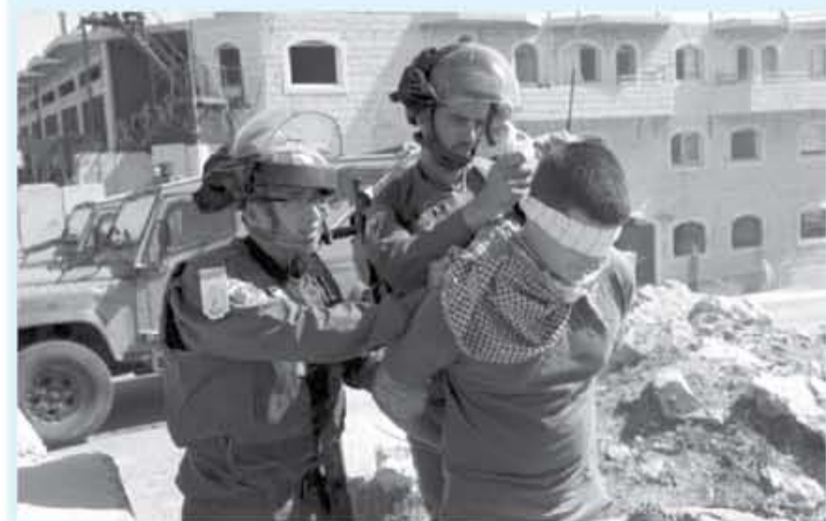
الانباط . وكالات

اعتداءات والشهكات يومية يتعرض لها آلاف المعلمين والتلاميذ والمواطنين الفلسطينيين المزل، في البلدة القديمة والمنطقة الجنوبية من مدينة الخليل، كان آخرها يوم الثلاثاء، حيث أطلقت قوات الاحتلال قنابل الغاز والرصاصة صوب تلاميذ عدد من المدارس وفي داخل أسوارها، وأرعبت وأهدت على الأهالي واحتجزت المركبات والحذت منها سواير لإطلاق القنابل صوبهم أثناء دخولهم مدارسهم.