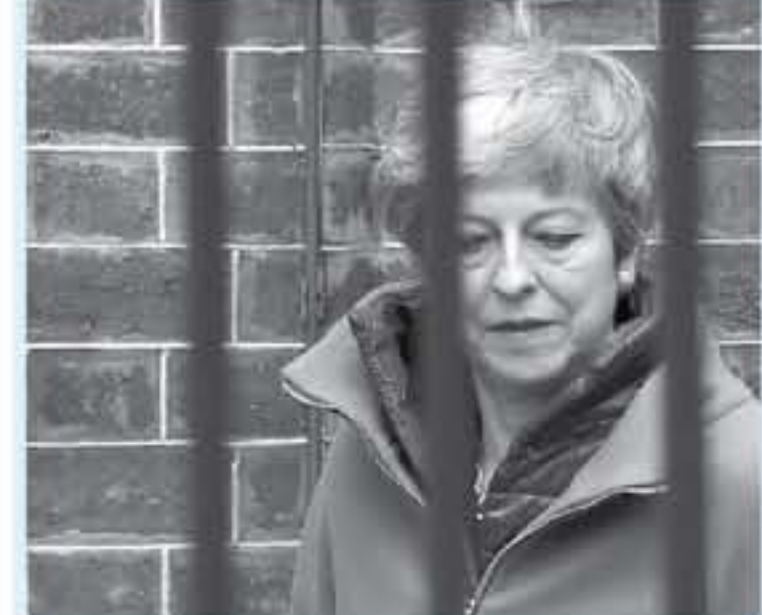
تيريزا ماي شجعت على التوصل إلى اتفاق. وقالت مصادر أوروبية إن هذا الاقتراح الذي تم الاتفاق عليه بعد مفاوضات شاقة