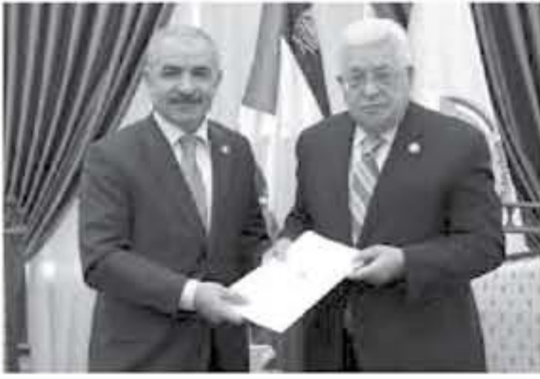
الانباط . وكالات

اسماء أعضاء الحكومة السابقة. يمن فيهم «وزراء الرئيس، خاصة الخارجية والمالية».