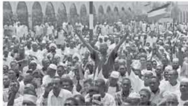
كما سارت المظاهرات في ولايات شمال كردفان والشيل الأزرق والفاشر

شهدت العاصمة السودانية الخرطوم ومختلف المدن مسيرات معاصرة حاشدة امس الجمعة، وطالب المواطنون بمحاكمات فورية للرئيس الخلع عمر البشير ورموز نظامه ومحاسبة المتورطين في جرائم هاء مالي وإداري. فيما طالبت أمهات ضحايا الثورة في موكب ضخم المطلق من صاحبة بئر، بمحاسبة قتلة أبنائهن وحل جهاز الأمن وشهدت مختلف المدن مسيرات مطالبة بإصلاح الخدمة المدنية وحل الشكائات المعالية وإعادة تشكيلها.