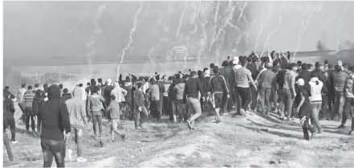
غزة - وكالات

زعم جيش الاحتلال الإسرائيلي طهر امس الجمعة، تعرض دورية عسكرية تابعة له لإطلاق نار إلى الشرق من مدينة رفح جنوبي قطاع غزة، وقصف نقطة رصد للمقاومة شرقي المحافظة الوسطى، وأخرى شرقي مدينة غزة. وذكر موقع "104" العبري أن قوة عسكرية إسرائيلية تعرضت لثيران على مقربة من السياج الأمني جنوبي القطاع، دون وقوع إصابات وأشار إلى أن إطلاق النار تسبب بتضرر معدات عسكرية. أما مرسل وكالة "صفا" فأفاد بقصف قوات الاحتلال الإسرائيلي نقطة رصد للمقاومة شرقي المحافظة الوسطى، وأخرى شرقي حي الزيتون جنوبي شرق مدينة غزة.