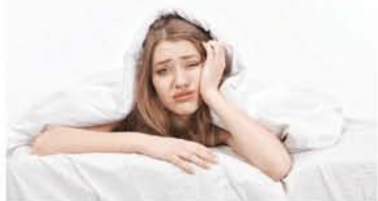
ديبي - وكالات

فقدت دراسة بحثية حديثة عدداً من المعتقدات الخاطئة التي نمارسها ونعتقد أنها تساعدنا على النوم، وأشارت إلى أن هناك مفاهيم شائعة عن النوم قد تدمر صحتنا وحياتنا.