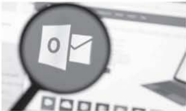
ديبي - البوابة العربية للأخبار التقنية

حصل ولم تُر الشركة بذلك إلا بعد أن عُرضت دلائل تؤكد أن الاختراق الأمني كان أسوأ مما أعلن عنه بائني الأمر لأولئك المستخدمين.