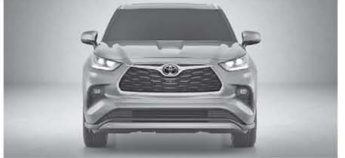
ديبي - عرب جي تي

يشكل رسمي على الانترنت . ستحدث البداية من التصميم الخارجي لسيارة تويوتا هايلاندر ٢٠٢٠ في أيار الرابع الجديد كإحدى أكبر كرنال قبل قليل لتسليم أحدث SUV من تويوتا مستمد من شقيقتها الأصغر حجماً منها تويوتا راف فور ٢٠١٩ التي ظهرت العام الماضي وتعتبر سيارة هايلاندر الجديدة بالكامل على منصة Toyota New Global Architecture