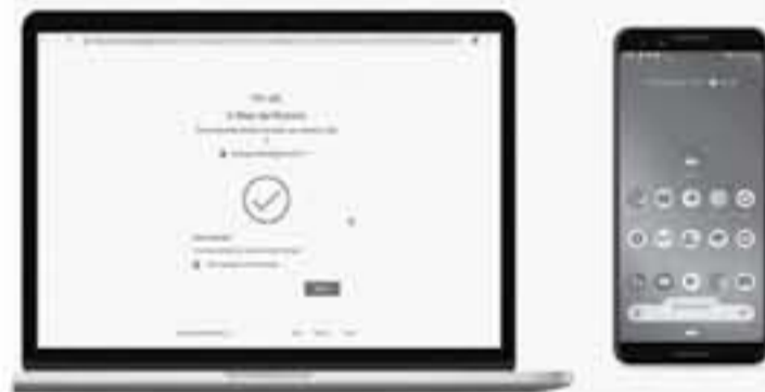
ديبي - البوابة العربية للأخبار التقنية

إلى MacOS يجب استخدام أحدث إصدار من متصفح فوكل كوم مكمية تعمل البرية الجديدة على هاتفك، ملاحظة: إن تتكمن من تقبل استخدام هاتفك كمتاح آمن إن لم تستخدم متصفح فوكل كوم للوصول لحساب فوكل الخاص بك، كمل ستحتاج إلى تشييط البيوتوت والشوق على هاتفك حتى تتكمن فوكل من إنشاء الاتصال والتحقق من فريق من موقع تسجيل الدخول. • انتقل إلى حساب فوكل الخاص بك من خلال هذا الرابط: https://myaccount.google.com/section اضغط على قسم الأمان Security section • سرر لأسفل حتى تصل إلى قسم الدخول إلى فوكل Signing in to Google • ستجد الخيار الثاني يحمل اسم التحقق بخطوتين 2-Step Verification، اضغط عليه • قم بالتصديق لأسفل حتى تصل إلى خيار إضافة مفتاح أمان Add Security Key، سيتم بعد ذلك عرض قائمة الهواتف التي تدعم الميزة • حدد الجهاز الثالث، ثم اضغط على خيار إضافة Add • كيفية استخدام الميزة على جهاز الكمبيوتر الخاص بك • قم بتشيط البيوتوت على جهاز الكمبيوتر الخاص بك (لا يلزمك تشييط الاتصال بهاتفك) • قم بتسجيل الدخول إلى حساب فوكل على حاسوبك • تحقق من استقبال إشعار على هاتفك الذي الذي يعمل بنظام أندرويد، ثم انقر مررتين على الإشعار "هل تحاول تسجيل الدخول؟" • اتبع باقي التعليمات لإثبات أنك أنت من تقوم بتسجيل الدخول باستخدام هذه الطريقة الجديدة • سيصبح حساب فوكل الخاص بك والبيانات التي يحوي عليها محمياً بشكل أفضل، ومن المتوقع أن تطور فوكل هذه البرية إلى أمد من ذلك بحيث يتم تأمين تسجيل الدخول إلى مواقع وصمعت الويب الأخرى باستخدامها.