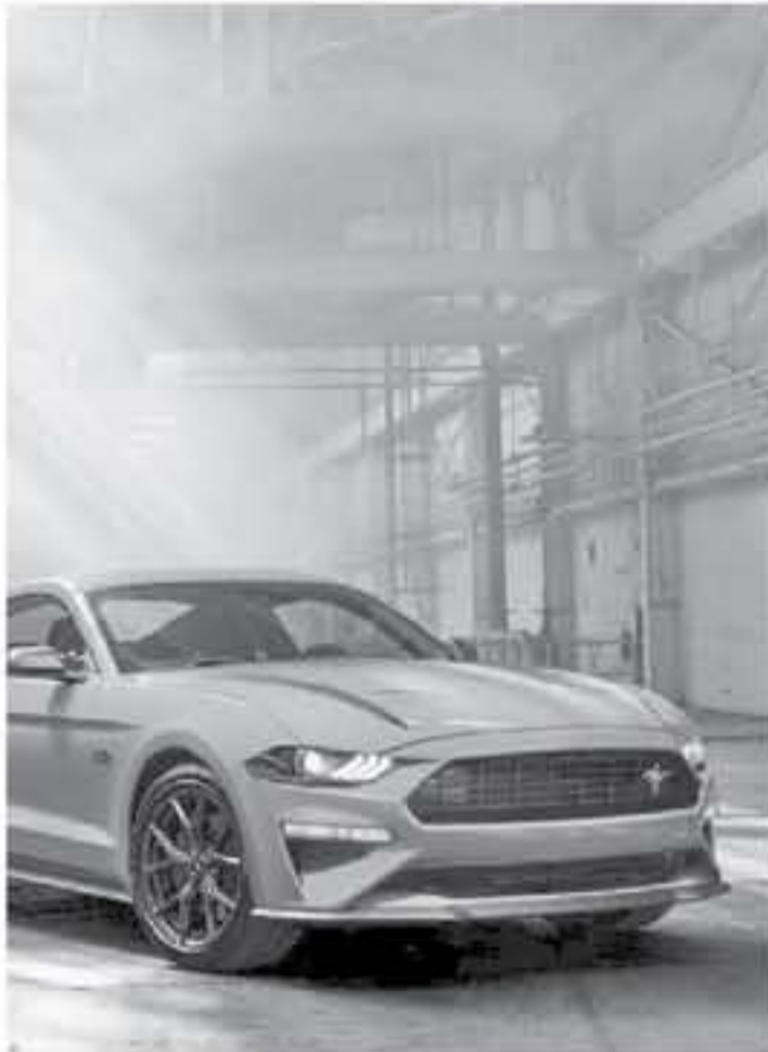
ديبي - عرب جي تي

٢٠ حصان عن نسختها الرياضية المبالغ قوة محركها الايكوبوست ٢١٠ حصان EcoBoost High Performance من سيارة موستنج ٢٠٢٠ المتأخر من ١٠ إلى ٩٩ كم/س (٦٠ ميل/س) في ١ ثواني.