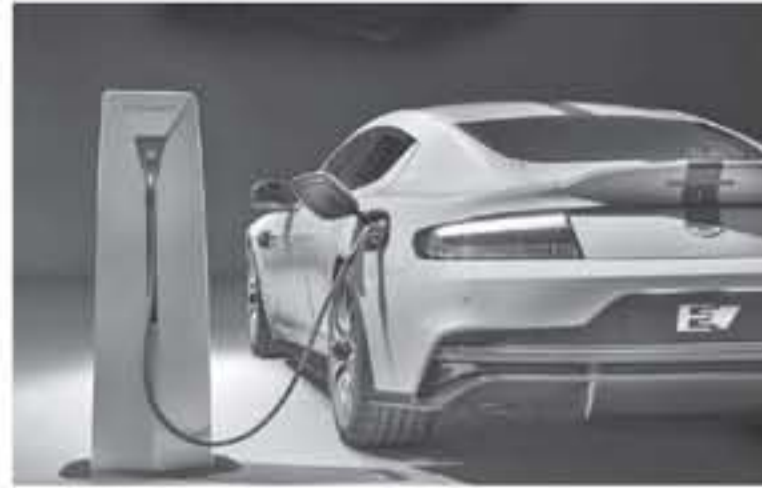
ديبي - عرب جي تي