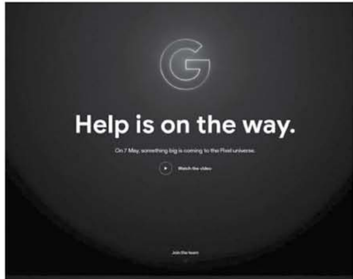
ديبي - البوابة العربية للأخبار التقنية

بدأت غوغل، الاثنين، التشويق لشبه جديد تعتمد الإعلان منه في أيار/مايو المقبل ويتعلق بعلامتها التجارية "بكسل" Pixel، ويتوقع أن تكون الشركة تلمح إلى الإعلان عن هواتف Pixel جديدة. على مدار الأسابيع الماضية، سُربت صور وتفصيل مواصفات هاتف "بكسل ٣" Pixel ٣ و"بكسل ٣ تي إكس إل" Pixel 3 XL، اللذين يعدان نسخة بمواصفات أقل من هاتفي Pixel ٢، Pixel ٢ XL، والتي أعلن عنها أيضاً في وقت سابق الاثنين وفي نسخة التشويق على متجر فوكل، Google Store، والآن تُسردت فوكل على متجرها الإلكتروني تشويقاً بعنوان "المساعدة القادمة"، ثم كتبت: "في ٧ أيار/ مايو، شيء كبير قائم إلى كون بكسل". كما ركزت في التشويق على مميزات الواقع المعزز القائمة على فيلم Avengers: Endgame، والتي أعلن عنها أيضاً في وقت سابق الاثنين وفي نسخة التشويق على متجر فوكل، ذكرت الشركة أنه بإمكان المستخدمين الاشتراك للحصول على التحديثات المتوقعة "بما هو قائم في أيار/مايو"، مع الإشارة إلى التاريخ الذي حددته في التشويق وبصاف اليوم الأول للإطلاق مؤتمر المليون السنوي الخاص بالشركة Google I/O ٢٠١٩، وبالذات إلى أن فوكل اعتادت الإعلان عن هواتفها الجديدة من سلسلة Pixel في تشرين الأول/ أكتوبر من كل عام، يُتوقع أن تستغل مؤتمر Google I/O ٢٠١٩