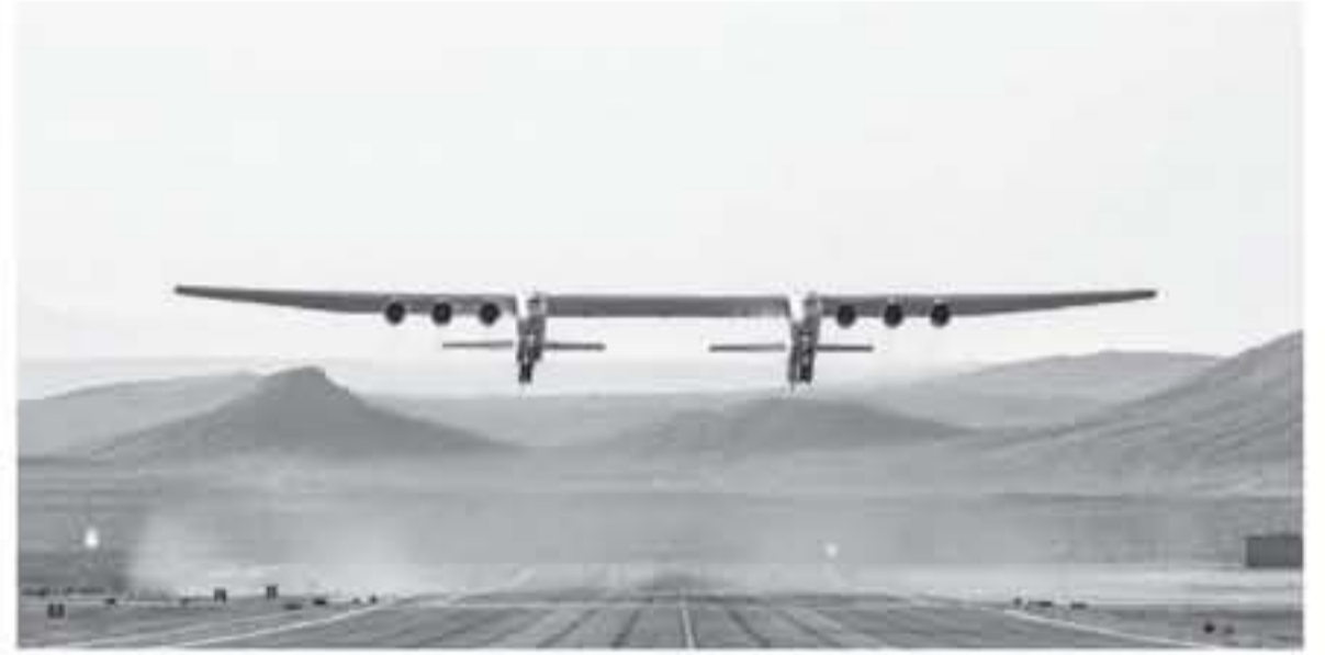
ديبي - البوابة العربية للأخبار التقنية

أعلنت الطائرة الأكبر في العالم أول رحلة لها فوق صحراء موهافي في ولاية كاليفورنيا الأميركية يوم السبت، لتدخل بذلك الشركة الصانعة لها، "ستراتولاunch Stratolaunch"، التي أسسها مؤسس شركة مايكروسوفت الراحل بول ألين، سوق الفضاء الخاص المريح.