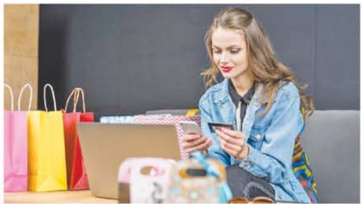
ديبي - وكالات

على التسوق بسهولة والحصول على خصومات كبيرة،