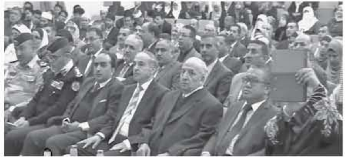
الإلتباط - يوسف المشاقبة

في حفل مهيب اقامته جامعة آل البيت، منح وزير التعليم الماليزي درجة الدكتوراه الفخرية في الفقه وأصوله تقديراً لتفكيرها به لتبوء مواقع قيادية مؤثرة في مملكة ماليزيا وتمنح وزير التربية والتعليم الماليزي معالي الدكتور مزلي بن مالك، خلال كلمة القاها بهذه المناسبة التوجهات الملكية السامية المتواصلة من صاحب الجلالة الهاشمية الملك عبدالله الثاني ابن الحسين المعظم حفظه الله ورعاه في دعم التطوير التربوي ورفع مستوى التعليم بالأساس التعليمية في الاردن من خلال تركيز جلالتك على رأس المال العمري والذي كان له آثار ايجابية على التنمية الاجتماعية والاقتصادية المتنامية.