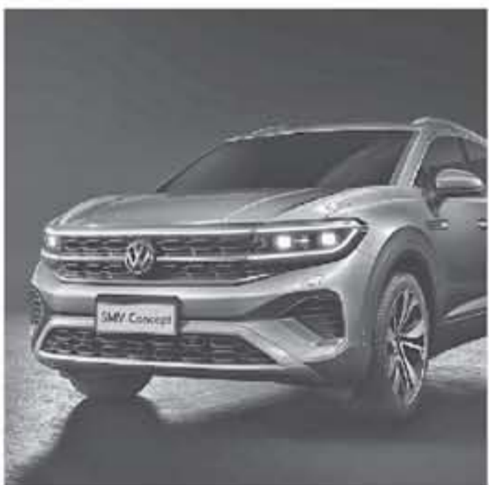
ديبي - عرب جي تي

متأكد أن فولكس فاجن SMV عندما يتم توفاها بنسخ الإنتاج التجاري ستباع فقط في السوق الصيني . المعلومات الأولية تشير إلى أن هذه السيارة الأكبر من فولكس فاجن تيرامونت ستوفر خيارات من المحركات