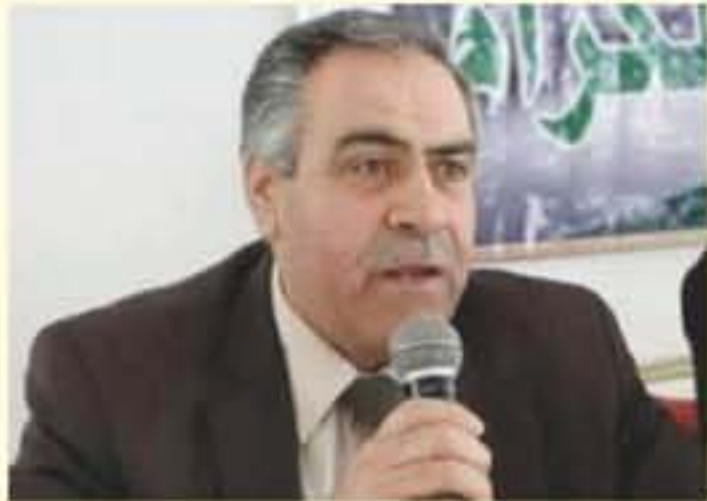
(1) بقلم: عبيد بن عظيم العوده الزبي

هذا النص ليس معمول به ومعطل تماماً من الناحية الفعلية والتطبيق العملي، بل أن هذا النص صورياً لا زال حبر على ورق، ولا بد من إعادة النظر بما يتناسب وطبيعة المجتمع الأردني بخصوص صفة الضليعة العدلية للمختار من الناحية القانونية. وكذلك نجد أن المادة (12) من القانون قد أجازت للمختارين المنتخبين أن يتقاضوا الرسوم أو الرواتب التي يقررها وزير الداخلية بنظام إلا أنه لا تصرف أية رواتب للمختارين ولا يتقاضون أية رسوم لهم لقاء قيامهم بمهامهم وواجباتهم الخصوصي، مع الإشارة بأنه فعلياً لا يتم صرف أية رواتب أو رسوم للمختارين لقاء قيامهم بهذه المهام (12) من ذات القانون والنسب يعود لعدم إصدار نظام خاص من وزير الداخلية بشأنه ولغاية الآن بهذا الخصوص، مع الإشارة بأنه فعلياً لا يتم صرف أية رواتب أو رسوم للمختارين لقاء قيامهم بهذه المهام (12) من ذات القانون وأمرنا إليها. فالمختار بحاجة إلى تفعيل دورهم ونخصيص رواتب شهرية لهم للقيام بواجباتهم والواجبات المناطة بهم والشغرف بشأن المادة (12) أجازت للمختارين بأن يتقاضوا الرسوم كما ورد بالقانون، فالرسوم تدفع للخرانة العامة وليس للأشخاص تدفع للخرانة الوظيفية، فلا يفرض رسم على أحد إلا مقابل خدمة تقدمها الحكومة للمستفيد من تلك الخدمة (قاعدة قانونية). فالمختار يحتاج كم هي المهام والواجبات المناطة بالمختار وفقاً للقانون كما أسلفنا أعلاه والتي سنذكرها تفصيلاً في مقال القاء القادم، ومن هنا أصبح الأمر بحاجة ملحة لإعادة ترتيب منطقيات المختار والعناية به غاية الموظف الحكومي من حيث تخصيص راتب له وتوفير مستلزمات وظلته بهذه الصفة التي يتمتع بها كأحد أفراد الضليعة العدلية.