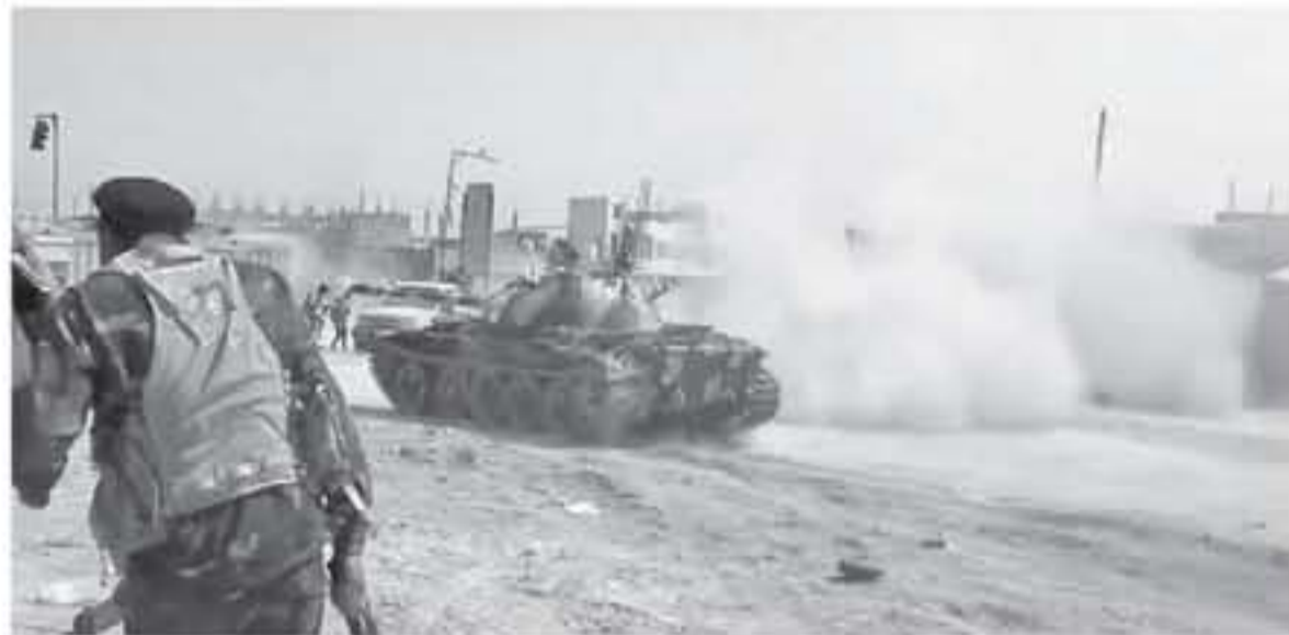
وكان المتحدث باسم الجيش الوطني الليبي اللواء أحمد السماري، قد أكد أن الجيش حقق تقدماً جدياً في طرابلس خصوصاً من الجهة الشرقية، مشيراً إلى أن هناك مجموعات مسلحة قدمت من تشاد لتشارك الوفاق في معركة طرابلس، وقد شنت هجوماً على قاعدة تمتهنت. وأشار إلى أن القتال في طرابلس مستمر

أفادت مصادر عربية، امس الجمعة، بأن الجيش الليبي أفضى القبض بغريان على مجموعة مسلحة أطلقت النار على موريات أمنية. وأضافت المصادر أن المجموعة حاولت زعزعة الاستقرار في المدينة لتشتيت الانتباه عن عملية طرابلس. كما أكدت أن الوضع الأمني في غريان تحت سيطرة الجيش الليبي بعد القبض على المجموعة المسلحة، مشيرة إلى أن الجيش الليبي يحقق تقدماً كبيراً خاصة في خلة الفرجان وصلاح الدين جنوب طرابلس.