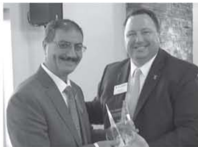
المؤتمرات لمدة سنة وهماها في جامعة بيردو في ولاية انديانا. وفي عام 2005 قضى اجازة تفرغ علمي في جامعة الينوي لمدة سنة. وعمل الخوالدة في جامعة العلوم والتكنولوجيا لمدة سنة وهماها في جامعة بيردو في ولاية انديانا. وفي عام 2005 قضى اجازة تفرغ علمي في جامعة الينوي لمدة سنة. ورئيسا لفرع الجامعة في العقبة ورئيسا

وحصل العين الخوالدة على درجة الدكتوراه مختصا في التقانات الحيوية من قسم الميسته في الجامعة عام 1990 وهاء اليها عام 1996 كمراسة ما بعد الدكتوراه مدعوما من البنك الاسلامي للتكسية لمدة عام. وفي عام 1999 حصل على منحة