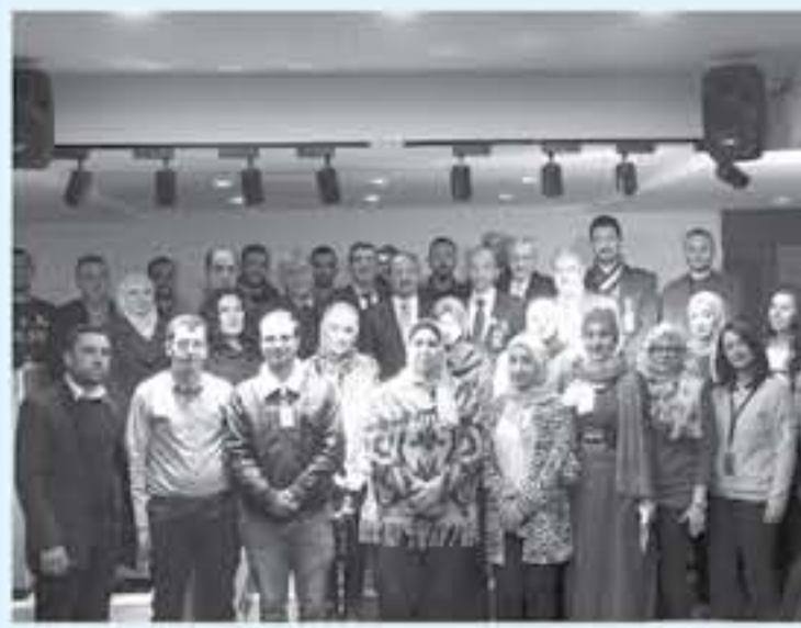
أقاموا بتقديم عدد من الاطراف الائتمانية خلال العام ٢٠١٨.

قالت رئيس صندوق استثمار أموال الضمان الاجتماعي خلود السقاف، إن القرار الاستثماري للصندوق يقوم على أسس مهنية يحته لضمان تحقيق عائد مجد ضمن مستويات مخاطر مقبولة، ودون إغفال لدور التنموي الذي يقوم به الصندوق من خلال الدخول باستثمارات وانشاء مشروعات بمختلف المحافظات. وبيّنت السقاف خلال لقائها امس الأحد، رئيس وأعضاء جمعية سيدات ورجال الأعمال الأردنيين المغتربين "كواصل" أن قيام الصندوق على تلك الاسس المهنية، يسهم بتحسين مستوى الخدمات من صحة وتعليم ونقل، إضافة إلى إيجاد فرص العمل والتوظيف والتشغيل، وتنشيط القطاعات الاقتصادية المرتبطة، إضافة الى تفعيل النشاط الاقتصادي في تلك المحافظات، لافتة الى ان الاستثمارات المباشرة للصندوق وقررت حوالي ٣٥٠٠ فرصة عمل عالمياً. وبيّنت السقاف أهمية الدور الذي يمكن أن تلعبه جمعية