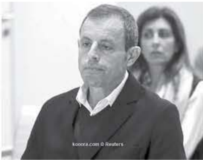
koora.com © Reuters