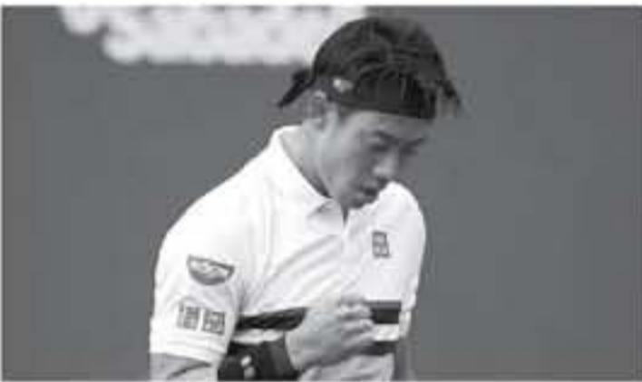
برشلونة - وكالات

2011 و 2014، إلى جانب خسارته نهائي البطولة في عام 2016 على يد الإسباني رافاييل نادال. كما حجز الروسي ثايل ميدفيدف مسعده في ربع النهائي هو الآخر. بعد التغلب على الأمريكي ماكينليز ساكودنالد بمجموعتين دون رد بواقع (2-6) و (2-6). ويواجه الروسي في ربع النهائي الفائز من مباراة النيفاري جريجوري ديمتروف والنشيطي نيكولاس جاري.