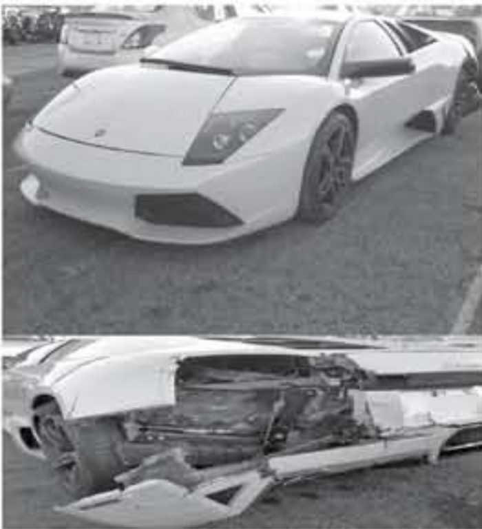
لدي - عرب جي تي

كرقم جيد بالنسبة لسيارة مستعملة منذ 2007 ولكن عند الحديث عن السيارات الخارقة يعتبر هذا الرقم مرتفع في الحقيقة. إلا أن المسافة المتوقعة ليست السبب وراء سعر السيارة الرخيص نسبيًا ، كما نشاهد في الصور يبدو أن السيارة قد تعرضت لحادث تسبب في أضرار كبيرة للزاوية الخلفية ما أدى إلى هذا الانخفاض الكبير في سعر السيارة ، الخفاش بعدد 100 ألف دولار ، وبالطبع فمن الممكن إصلاح السيارة ولكنها ستكون عملية صعبة ومرقعة الثمن إذا أردت أن تصلح السيارة كما ينبغي وبالطريقة الصحيحة .