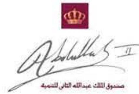
صندوق الملك عبدالله الثاني للتنمية

عزت الأجهزة الأمنية امس على طفلين نغيبا عن منزلها منذ ظهر اول من امس في الرصيفة. وقال الناطق الاعلامي باسم مديرية الأمن العام، انه على إثر تقدم أحد المواطنين