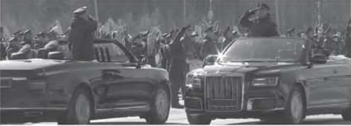
لدي - عرب جي تي

ظهرت سيارة الرئاسة الروسية بنسخة السقف الكشفت خلال عرض عسكري أقيم مؤخرا في ميدان الأحمر في وسطها الأم روسيا ، لتظهر بكل فخر وبدون أي إكترات تصميم خارجي مرسوم من سيارة انجليزية 111