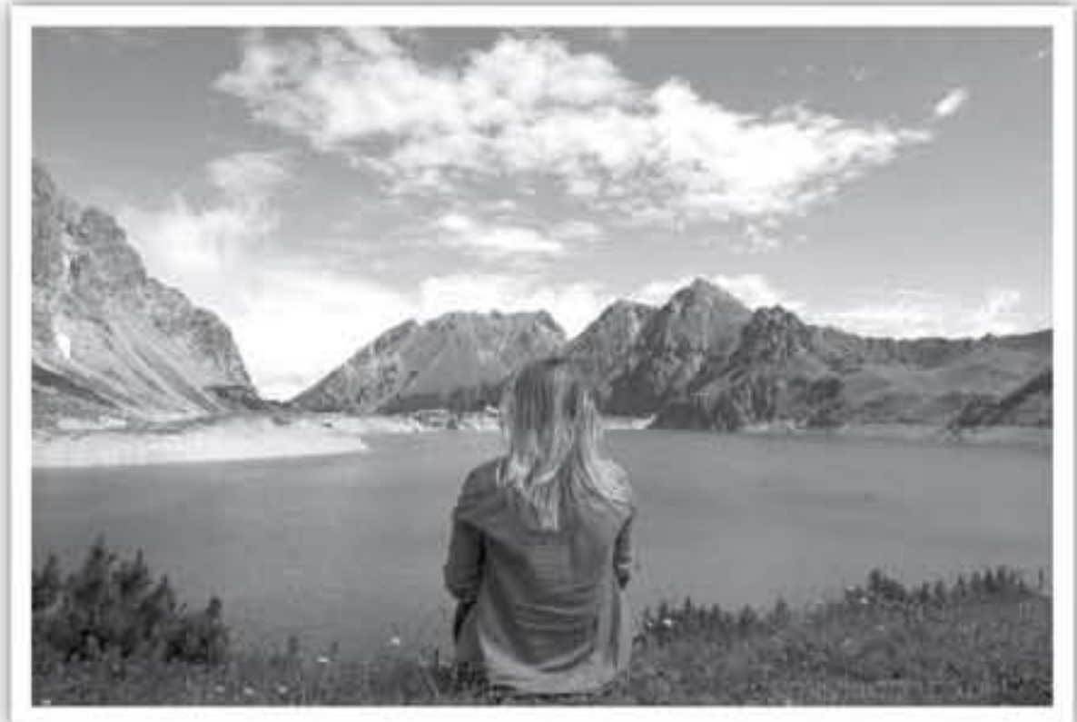
الأنباط - رصد جمانة خنفر

بعض الوقت الممتع في المشي لمسافات طويلة. تسبح هذه المدينة الجميلة بالهندسة المعمارية الفريدة، والتي يمكنك اكتشافها بشكل جلي في بلدة كرومباخ الصغيرة، التي تضم حوالي 1000 شخص، حيث ستجد هناك سبع محطات للحافلات مختلفة جداً صممها سبعة مهندسين من جميع أنحاء العالم، وعلى الرغم من أن بعض تلك المحطات شديدة الجمال، لكنها جميعاً أكثر روعة من أي محطة للحافلات الأخرى التي قد تكون رأيتها على الإطلاق. رائد هي مدينة جبلية رائعة أخرى مثالية لممارسة رياضة المشي لمسافات طويلة والقيام بالكثير من الأنشطة الممتعة، بما في ذلك الاستمتاع بمسار للدراجات الجبلية، وكذا فرص التزلج، ومسارات ركوب الخيل والمشي الرائعة على قمم الجبال، وطريق المشي لمسافات طويلة. وبالفعل فإن هذه المدينة لديها الكثير لتكتشفه في فورارلبرغ - سيمتلك الاستمتاع بالطعام المحلي الرائع الذي لا يقارن، بدءاً من تناول الطعام الخارجي في الضوايق الفاخرة إلى الاستمتاع بالطعام الريفي، حيث ستستمتع بثقافة طهي متميزة ورائعة، خاصة أن المزارع الخاصة تلتهم المدينة، مع مجموعة الخضروات الطازجة والأعشاب المتنوعة. ويقوم العديد من المطاعم والسكان المحليين بإعداد الأطباق باستخدام المنتجات المحلية واللحوم والجبن الذي يحظى بشعبية واسعة بين المسافرين، مما يبرز عند فورارلبرغ بتوفير أفضل الأطعمة من المزارع المحلية إلى طاولة الطعام.