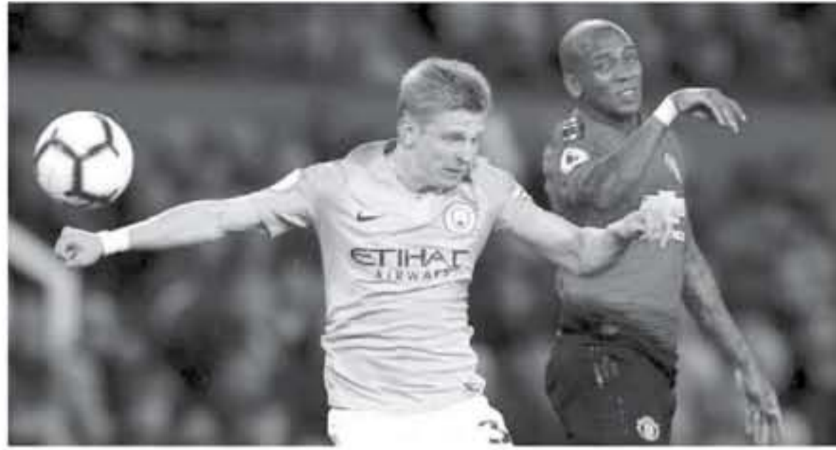
لندن - وكالات

واستعرضت صحيفة «ديلي إكسبريس» فوز سيتي بعنوان «سيتي لا يمكن إيفائه بساطة». وأضافت، «الأكينة الزرقاء تزيح يونايتد جانبا لتقترب من اللقب».