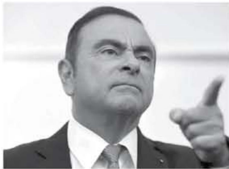
أبوظبي - وكالات

وكان غصن يدير قبل توقيفه المشاجرة في التاسع عشر من نوفمبر في طوكيو، لحلف السيارات الأول عالمياً الذي يضم "رينو" و"نيسان" و"ميتسوبيشي". ويقع غصن البالغ ٦٥ عاماً، في مركز اعتقال في شمال العاصمة اليابانية، حيث سبق أن أمضى أكثر من مئة يوم. ويواجه غصن اتهامات بـ"الفساد المالي وخيانة الأمانة" بعد مزاعم بعدم الإفصاح عن نحو ٨٦ مليون دولار من راتبه وتحويل خسائر مالية شخصية إلى حسابات نيسان خلال الأزمة المالية. وهذا هو ثاني قرار قضائي بإخلاء سبيل غصن بكفالة، ويمثل أحدث حلقة في فضيحة عصفت بصناعة السيارات العالمية.