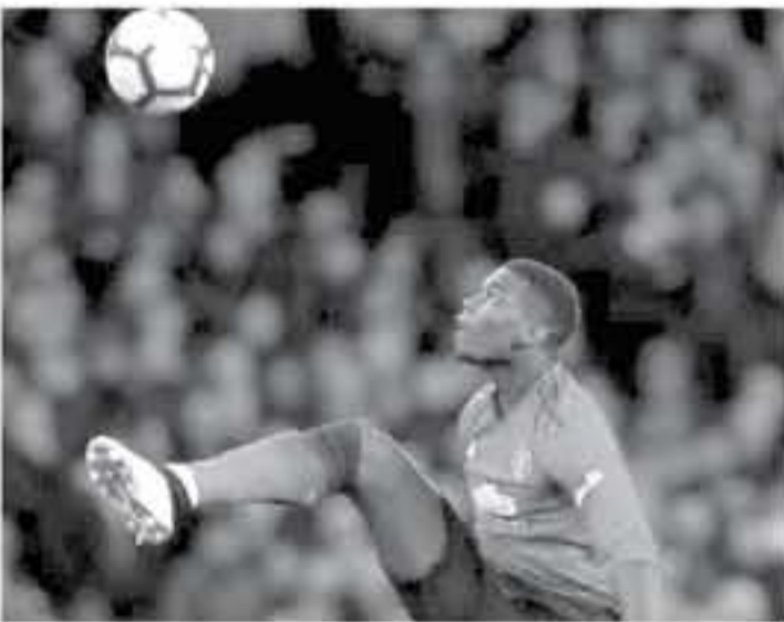
لندن - وكالات

وجاء التشكيل كاملا كالاتي، حراسة المرمى: إيدرسون (مانشستر سيتي). الدفاع: أندرو روبرتسون (ليفربول) - إيمريك لابورت (مانشستر سيتي) - فيرجل فان دينك (ليفربول) - تريت أكسندر أرنولد (ليفربول). الوسط: برناردو سيلفا (مانشستر سيتي) - فوناندينيو (مانشستر سيتي) - بول بوجيا (مانشستر يونايتد). الهجوم: ساديو ماني (ليفربول) - أجويرو (مانشستر سيتي) - رحيم شترينج (مانشستر سيتي).