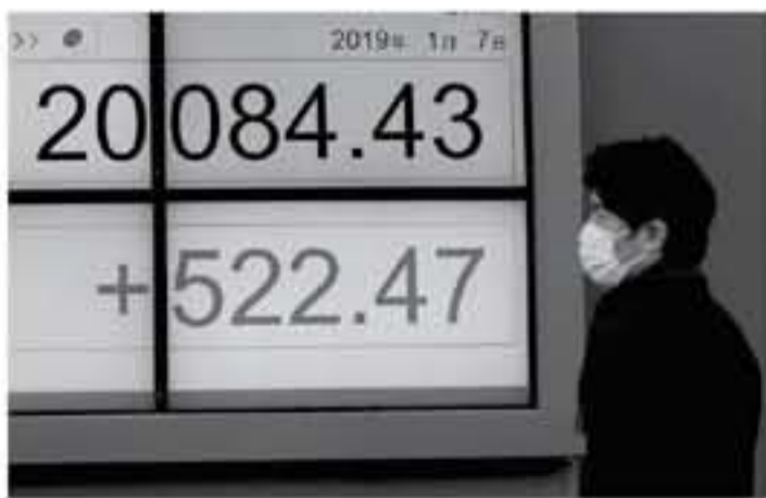
طوكيو - رويترز

وصعد سهم كاو كورب لصناعة مستحضرات التجميل والعناية بالبشرة ٥,٣ بالمئة بالرغم من إعلانها انخفاض صافي الربح خمسة بالمئة على أساس سنوي بين يناير كانون الثاني ومارس آذار. وفي حين تلقى السهم دعماً جزئياً من إعلان الشركة عن إعادة شراء أسهم، فإن الأرباح لم تكن بالسوء المتوقع حيث كان السوق يماور المستثمرين بشأن ارتفاع تكاليف المواد.