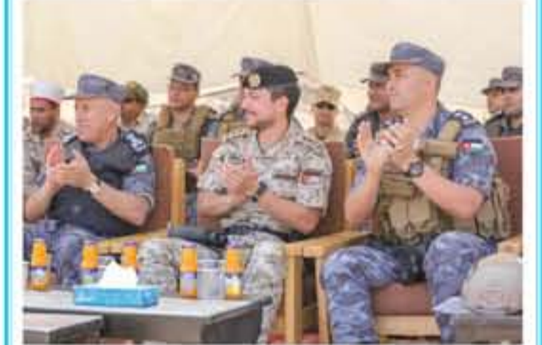
الانباط - العقبة والزوارق الملكية، حيث كان سموه شارك في يوم ترميز أثناء انعقاد هذه الفورة، وأبدى سموه الذي سلم الشهادات للخريجين، إعجاباً بالمسؤول المتميز الذي وصفت إليه القوة البحرية والزوارق الملكية. رعى سمو الأمير الحسين بن عبدالله الثاني ولي العهد، أمس حفل تخريج دورة الكوماندوز 10 من أحد ميدانين لتدريب قيادة القوة البحرية الملكية.