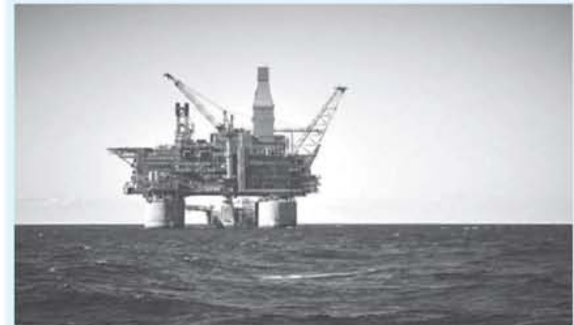
سنغافورة - رويترز

تجني ما يصل إلى ٥٠ مليار دولار سنوياً من إيرادات النفط. تُقدر أن عقوباتنا حرمت النظام بالمثل من أكثر من عشرة مليارات دولار منذ مايو/أيار. ٢٠١٨