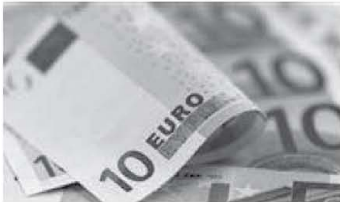
لندن - رويترز

في ٢٣ شهراً عند ٩٨,١٨٩ مقابل ستة عملات منافسة في قبل الأرباح ليسجل ارتفاعاً بأكثر من ٠,٥ بالمئة وهو ما يرجع ذلك بدرجة كبيرة إلى ضعف اليورو.