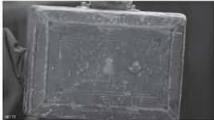
وكالات - أبوظبي

السلطة في عام ٢٠١٠ تبينوا سياسة لتكشف صارمة اعتمدت بشكل كبير على الحد من الإنفاق العام. ومما أكد تراجع العجز تدريجياً علماً أن السلطات لا تتوقع تحقيق ميزانية متوازنة قبل النصف الثاني من العقد المقبل.