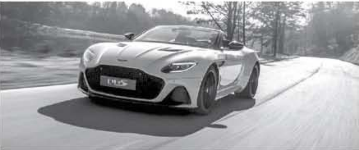
لدي - عرب جي تي

ظهرت سيارة استون مارتن DBS سوبر لاجيرا فولانتي 2020 بشكل رسمي على الانترنت ، التي تعتبر أسرع سيارة كشف إنتاجية لدى الصانع البريطاني . التصميم الخارجي لهذه السيارة الكشفت مستمد من شقيقتها المكويبة استون مارتن DBS سوبر لاجيرا التي ظهرت في شهر يونيو العام الماضي كقطران بديل عن استون مارتن فانكويش ، ليكون الفرق بين السيارتين بالسقف المقامشي القابل للطي الـ 11 خلية ويتوفر 8 خيارات من الألوان لهذا السقف .