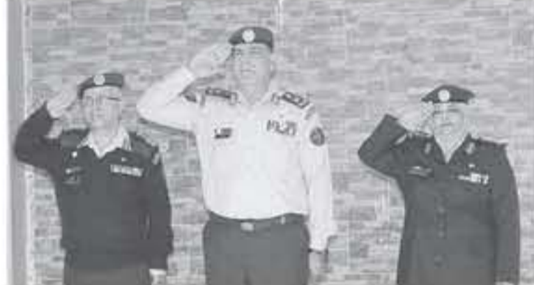
السلمة وجمع غير من ذوي الخريجين، سلم راعي العمل الجوائز على أوائل الخريجين .

احتفلت كلية الخدمات الطبية الملكية للتدريب والمهن الطبية المساعدة، امس، بتخريج تلاميذ وتلميذات الفوج السادس والعشرين، تحت رعاية مدير عام الخدمات الطبية الثنية اللواء الطبيب سعد جابر . وبدأ الاحتفال بالسلام الملكي والمسير بنظامي الطبي والعسكري من أمام المنصة الرئيسية . وقالت أمر الكلية العميد مبرهنة منيرة حجازي، إن الكلية تهنئ اليوم هذه التوكية من فخرسان وفارسات العطاء والتفهم الذين نالوا الجهد والسود والوسام الرفيع بتفهمهم، فالتفئة تهنيح بهذه الأمجاد،