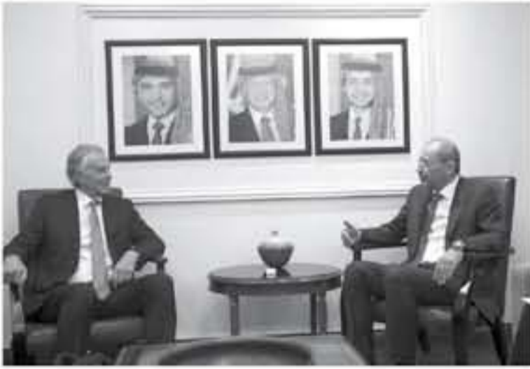
الأبواب - عمان التقى وزير الخارجية وشؤون المغتربين أمين الصفدي، أمين الأحد، رئيس الوزراء البريطاني الأسبق ورئيس التنفيذي لمعهد التغير العالمي توني بيلير.