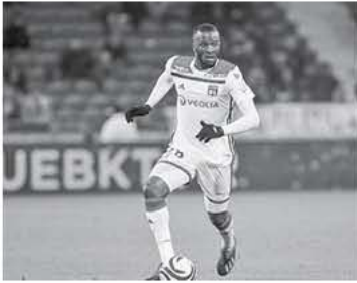
الآنباط - وكالات

باهتمام العديد من الأندية الأوروبية مثل يوفنتوس وماينستر يونايتد والسيتي، ولذلك أراد ريال مدريد قطع شوط كبير نحو تأمين الصفقة. وأوضح أن ريال مدريد يتنظر أولاً معرفة مصير صفقة الفرنسي بول بوجيا، لاعب وسط مانشستر يونايتد، والتي سيؤدي فشلها إلى تحرك الميرتسي سريفاً ضمن نادوميلبي.