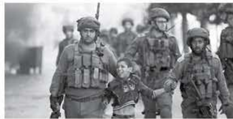
بروكسل أمس، أن الاعتقالات في صفوف للتحالف الأوروبي لتصرة الأسرى في