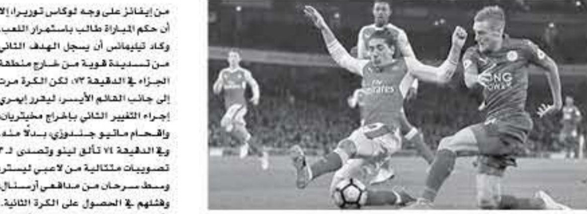
الآنباط - وكالات

تكدب إرسال الهزيمة الثالثة على التوالي في الدوري الإنجليزي، بالتسوط امس، أمام ليستر سيتي، بنتيجة 3-0. في المباراة التي أقيمت على ملعب كينج باور، ضمن الجولة رقم 37. وسجل ثلاثة ليستر سيتي كل من يوزي تيليماس (54) وجيمي فاردي (81-90)، لتعرض آمال إرسال في التأهل إلى دوري أبطال أوروبا الموسم المقبل، لضربة كبيرة. وارتفع رصيد ليستر سيتي إلى 11 نقطة في المركز الثامن، بينما جمعد رصيد إرسال عند الـ 16 نقطة في المركز الخامس. وهدد ليستر سيتي مرمرس إرسال للهزيمة الأولى في الدقيقة السابعة عبر رأسية من المدافع جوني إيفانز، من ركلة ثابتة تصدى لها بيرند لينو.