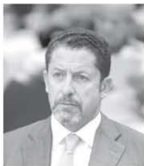
عملها والبناء على الإنجاز لتحقيق لإقامة النمو في أرباح الشركة، وسط الالتزام الكامل بتطوير أعمال الشركة.