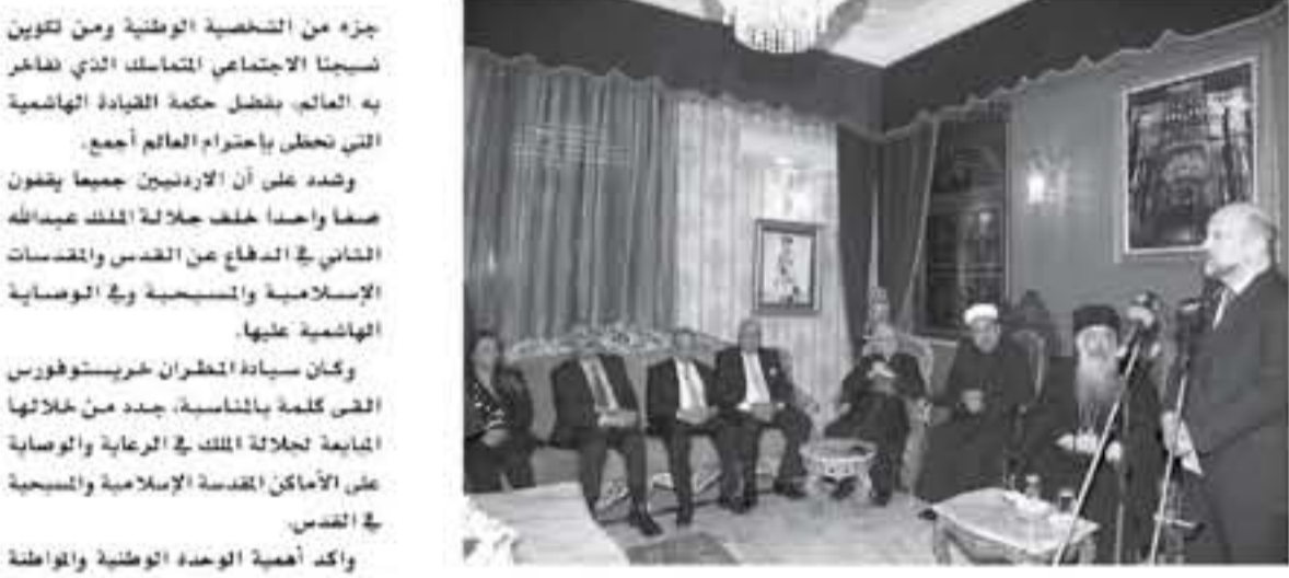
الأبواب - عمان هنأ رئيس الوزراء الدكتور عمر الرزاز المسيحيين في المملكة بمناسبة عيد الفصح الهجيد. وأكد رئيس الوزراء خلال زيارته أمس الأحد إلى مطرانية الروم الارثوذكسي بعمان يرافقه فريق وزاري وتعالته سيادة المطران خريستوفورس عطالله مطران الروم الارثوذكسي ورئيس أساقفة القنصل والسبطاكية والأساقفة في المملكة. ان الاردن بقيادة الهاشمية تميز على الشوام بتسامحه الاجتماعي الواحد الذي يمشي فيه الجميع على معاني المحبة والوئام. وقال رئيس الوزراء، ان خطاب الكراهية الذي يراه في العديد من دول العالم، وشاهدناه في نيوزلندا وسريلانكا أخيراً يقابله في الاردن خطاب المحبة والوئام والإنسانية والرحمة، مؤكداً ان هذا مبدن