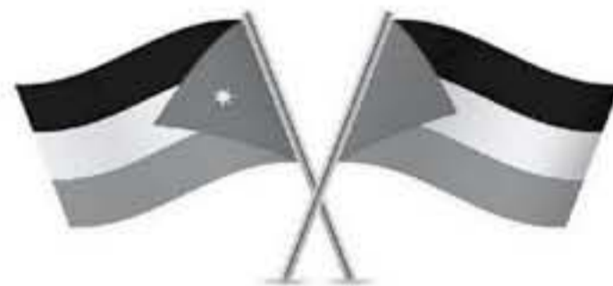
الاطلاق من الوصاية الهاشمية على المقدسات الإسلامية والمسيحية فيها. وعرض التقرير لانتهكات الاحتلال

أبرز تقرير دائرة الشؤون الفلسطينية الشهري، تأكيد جلالة الملك عبد الله الثاني الموقف الأردني الثابت حيال القضية الفلسطينية، وأن القدس ومستقبل فلسطين حقد أحمر لا يقبل التنازل عنه. وأشار التقرير لشهر آذار الماضي، الى تنفيذ جلالة على أن لا أمن ولا استقرار ولا ازدهار في المنطقة دون حل عادل ودائم يلبس طموحات الشعب الفلسطيني بإقامة دولته المستقلة على خطوط 4 حزيران 1967 وعاصمتها القدس الشرقية، وتأكيد جلالته مواصلة الأردن لدوره التاريخي في حماية القدس والدفاع عنها.