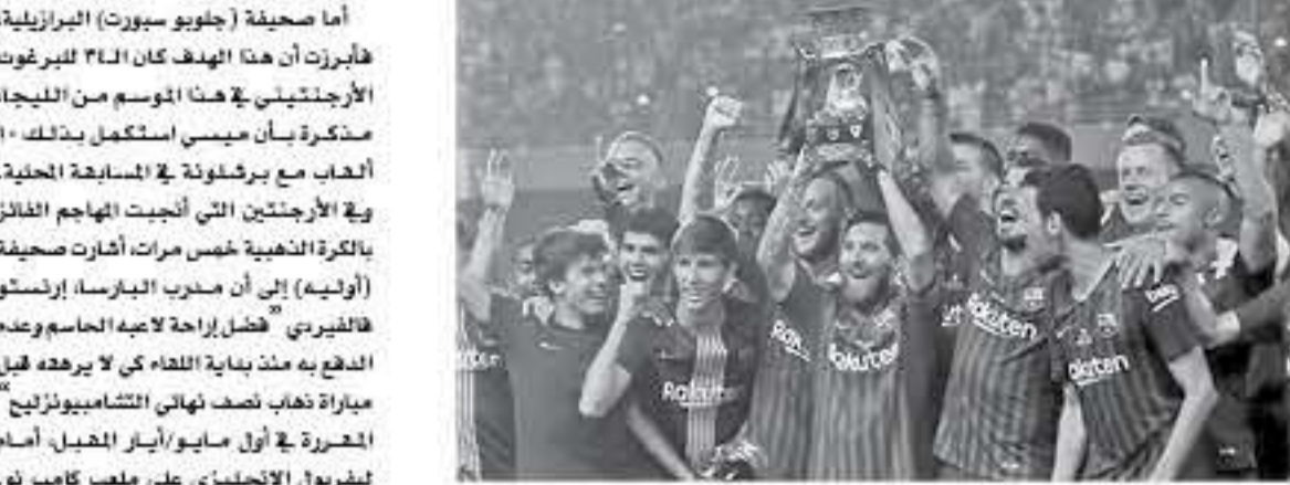
الآنباط - وكالات

لعلن الدائرة عن طرح عطاء رقم (1/2019) لشراء تصفية الوحد لوظفي وموظفات دائرة الإيراد الجوية لعام 2019، فطن من طرف يدخل العطاء مراجعة سكرتير العطاءات ( مصطنحة مع نسخة مصدقة عن رخصة من سارية المفعول والسجل التجاري) خلال ساعات الدوام الرسمي للحصول على نسخة دعوة العطاء مقابل عشرون ديناراً غير مستردة. آخر موعد لبيع دعوة العطاء العامة الثانية عشر من يوم الاحد 2019/04/29. آخر موعد لبيع العروض الصناعية الثانية عشر من يوم الاثنين 2019/05/06. وسيتم فتح العروض مباشرة. ملاحظة: اجوز نشر الاعلان على من يرسو عليه العطاء. للاطلاع على الوصفات الفنية والشروط الخاصة يرجى زيارة موقع الدائرة الالكتروني jmd.gov.jo او موقع الاعلانات الحكومي advs.gov.jo