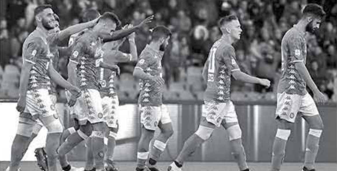
الآنباط - وكالات

عزز نابولي تواجهه في المركز الثاني بالدوري الإيطالي لكرة القدم بفوزه على ضيفه فروسينوني 2 / 3. المباراة التي جمعتهما امس الأحد في المرحلة الرابعة والثلاثين من الدوري. وسجل هني نابولي درايس ميريتزي وأمين يونس في الدقيقتين 19 و49، ورفع نابولي رصيده إلى 70 نقطة في المركز الثاني. وتوقفت رصيد فروسينوني عند 33 نقطة في المركز التاسع عشر قبل الأخير، ليتحدر بقوة نحو الهبوط. وكان يوفنتوس توج بلب الدوري لهذا الموسم في الجولة الماضية صحفاً ليهب الثامن على التوالي والرابع والثلاثين بشكل عام.