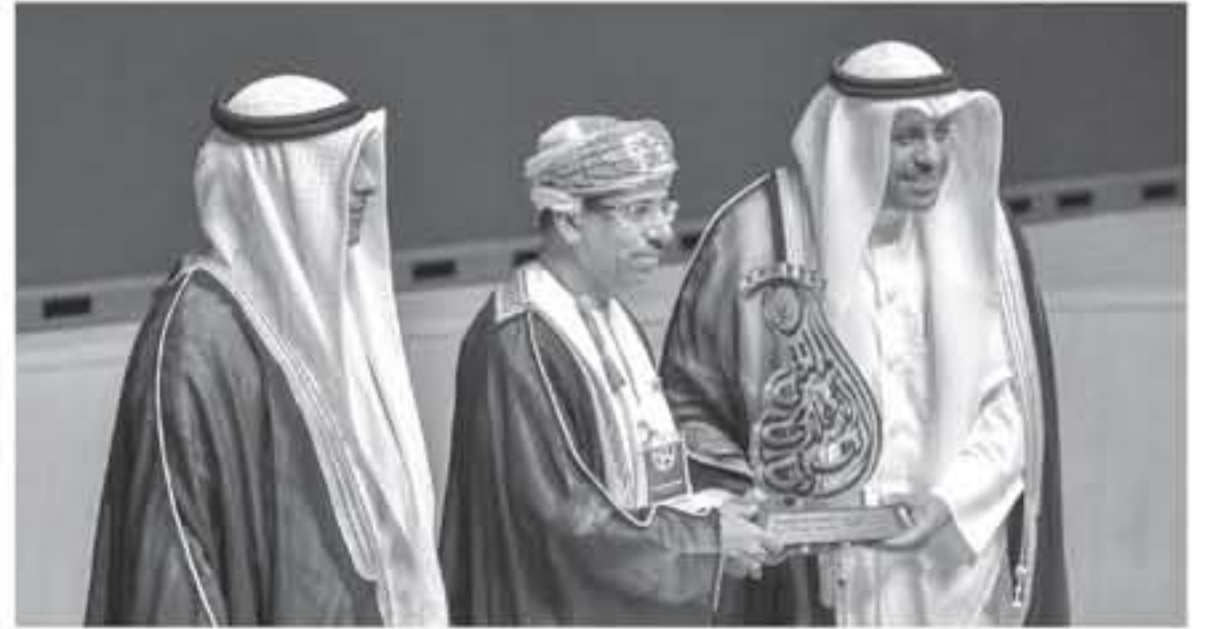
الأنباط - الكويت - فرات العموش

وقال الأكاديمي والناشط الإعلامي د. محمد العوضي في محاضرة بعنوان "تجربتي مع الإعلام" وأدارها الإعلامي الكويتي محمد السناني في الجلسة الأولى في اليوم الثاني للملتقى، إن تجربتي الإعلامية علمتني تقدير الناس وكلامي عن المواطنين وحاجاتهم وكلامي عن السجنة واليؤساء والمطلوعين يجعلني أرضي ضميري.