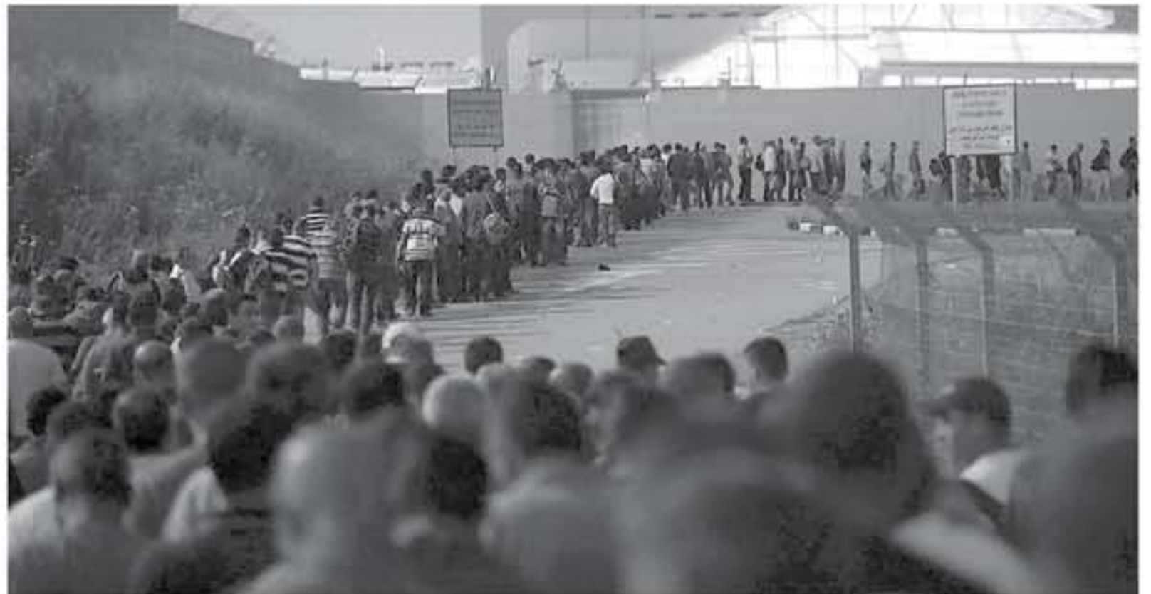
القدس المحتلة - وكالات

هذه المسألة اليومية تجعل قضية العمال بحاجة إلى متابعة دولية ومن جهات حقوقية وإنسانية دولية لتخفيف من هذه الإجراءات التي لا يمكن وصفها بأقل من التعسفية والفاسدة.