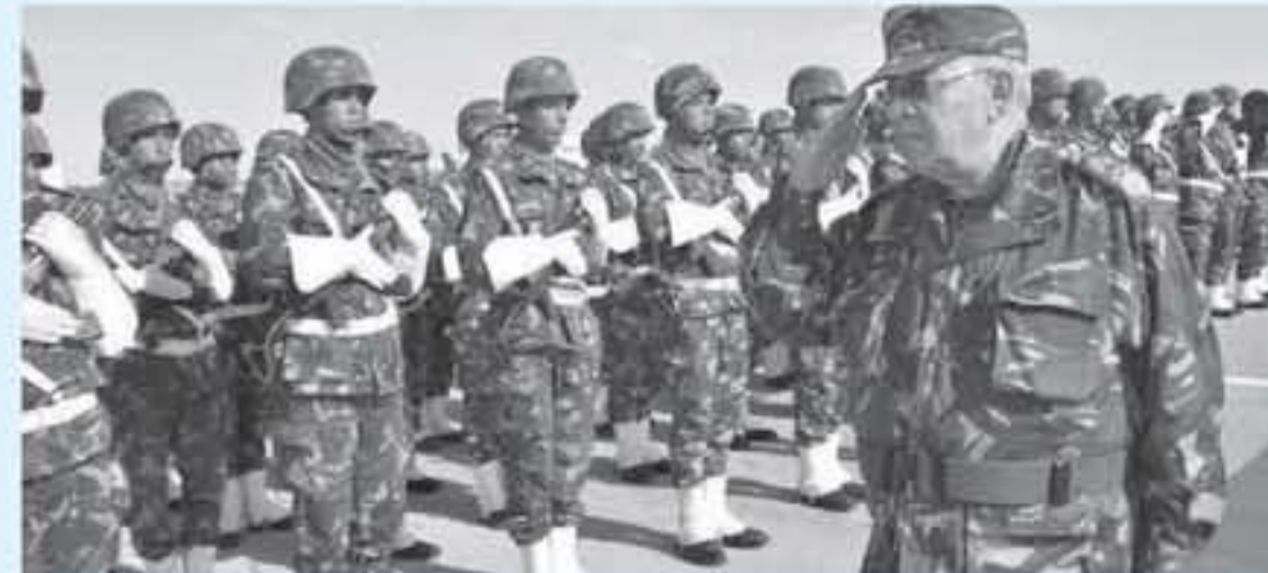
الجزائر - وكالات