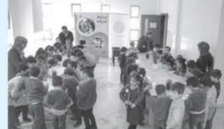
في زيارته الأخيرة لحافظة جلون، قدم المتحف للفنون "محطة الزراعة" التعليمية الجديدة بدعم من البنك الاستثماري، وفُرحت للأطفال بأسلوب

استقبل متحف الأطفال المتنقل في ختام جولته الأولى لهذا العام ١٢٧٠٠ زائر مجاناً. واختتم المتحف جولته في محافظة عجلون بعد زيارة الرصيفة ومخيم البقعة ومحافظة الكرك. وحمل المتحف المتنقل الذي يعتبر امتداداً لمتحف أطفال الأردن، خلال جولته تجربته التعليمية الجانبة للأطفال من محبي المعرفة في المحافظات الأردنية، ممن يتعد عليهم الوصول لقر المتحف بعمان. وجاءت هذه الجولة بدعم رئيس من شركة اليوتاس العربية، وشركة زين والبنك الاستثماري.