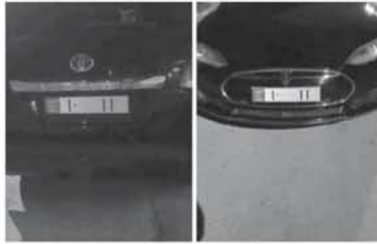
المطالبة بها فقط ضمن إطار الاستخدام السليم. وأوضح ان النظام يسمح بالتتبع اللحظي للمركبات، وإصدار أوامر الحركة وشراء المحرقات إلكترونياً، بالإضافة إلى رصد المخالفات المرورية والممارسات لدى السائقين.

وقّع وزير النقل المهندس نسامر الخصاونة أمس، أمر شراء المرحلة الثانية من مشروع التتبع الإلكتروني للمركبات/ الأليات الحكومية الذي تنفذه شركة زين بالتعاون مع الشركة العامة للحاسبات. وقال الخصاونة، إن المرحلة الثانية تشمل 8٥٠٠ مركبة، منها ١٨٠٠ مركبة تابعة لأمانة عمان الكبرى، مشيراً إلى ان بدء العمل على تركيب الأجهزة الخاصة بالتتبع سيكون منتصف الشهر المقبل ويستمر لمدة ١٢ شهراً ليصل عدد المركبات الحكومية الخاضعة لنظام التتبع الإلكتروني بشكل كامل خلال العام المقبل ١٣٥٠٠ مركبة.