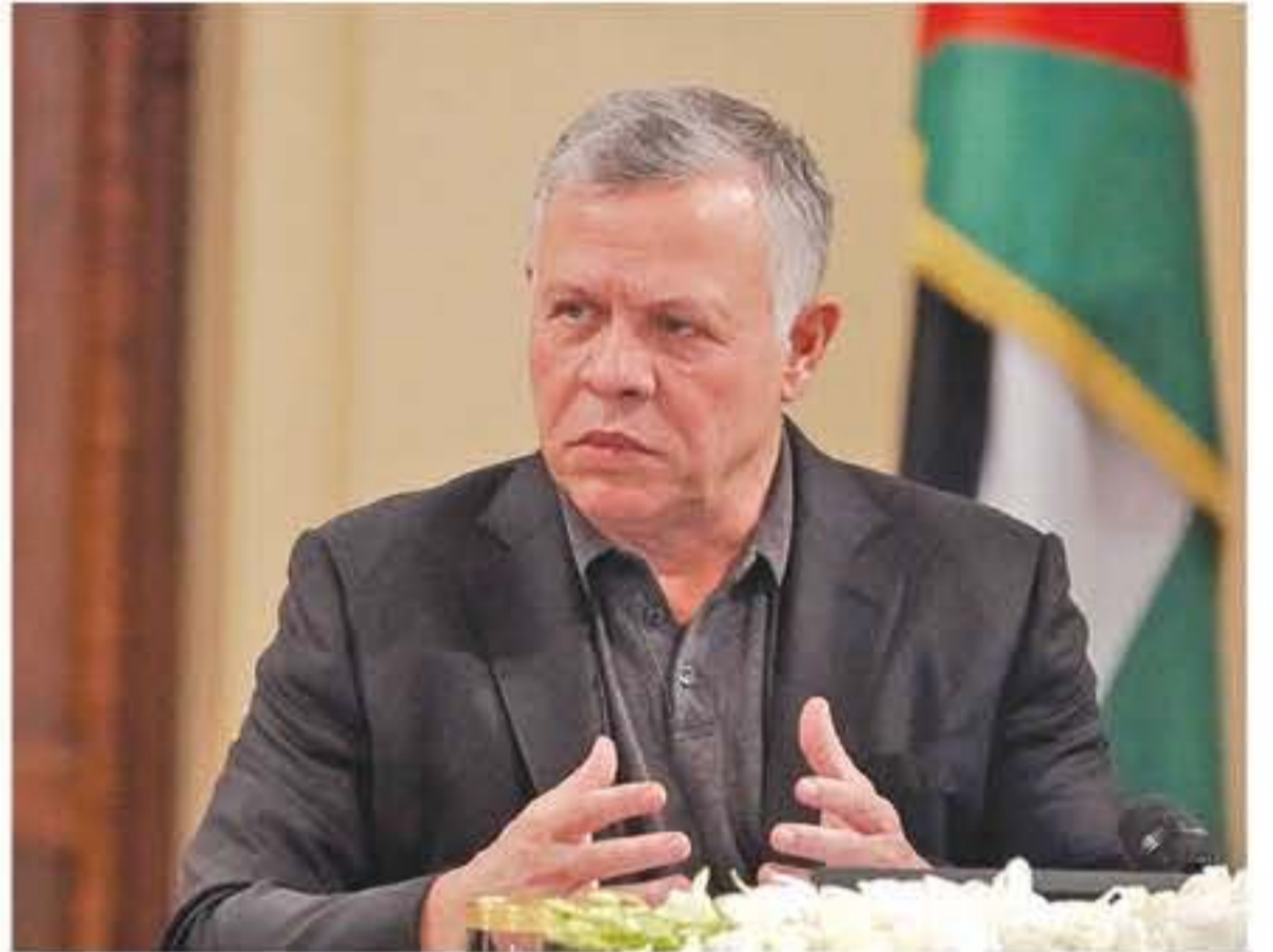
عمان - الأنباط

اجتمع جلالة الملك عبدالله الثاني، في قصر الحسينية أمس الأحد، مع عدد من الشباب والشابات الرياديين من أصحاب الشركات الناشئة، في لقاء على أهمية إيجاد مشاريع وحلول تهدف إلى تعزيز قطاع ريادة الأعمال بالملك.