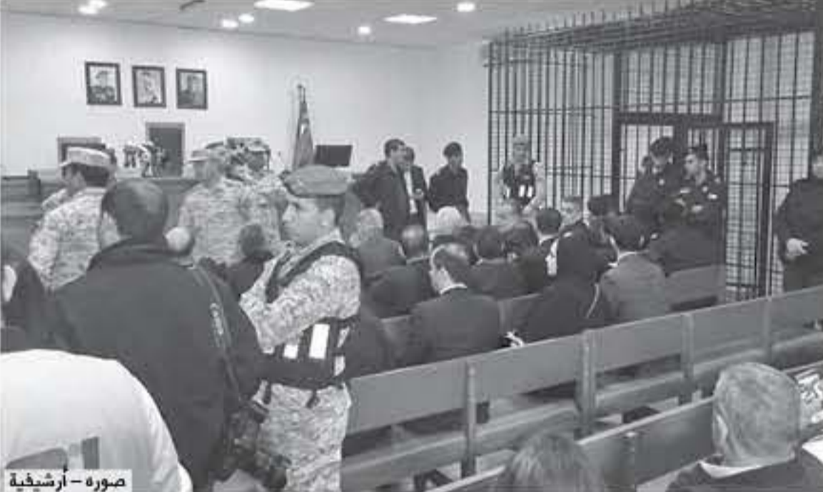
صورة - أرشيفية

قال رئيس محكمة أمن الدولة، القاضي العسكري الدكتور محمد الطيف، إن أحد المتهمين بقضية الدخان انتقل إلى رمة الله تعالى صباح أمس. وأضاف الطيف د "بئرا"، إن إجراءات متابعة النظر بالقضية ستستمر حسب الأصول القانونية يومي الثلاثاء والاربعاء من كل أسبوع لسماح شهود إثبات النيابة العامة، مشيراً إلى أن اليوم الأربعاء لن تعد جلسة بسبب وفاد أحد المتهمين. يشار إلى أن المحكمة استمعت حتى اليوم إلى ١٢ شاهد إثبات نيابة عامة، في قضية الدخان المتهم فيها ٢٩ شخصاً، منهم ٩ متهمين فلولين من وجه العامة، ووجدت في أمس، و٢٥ شركة منها ٢٢ شركة يملكها أو مسجلة باسم أو يملكها ٢٢ من المتهمين في القضية، وشركتان مسجلتان باسم شاهدين اثنين من شهود اثبات النيابة العامة البالغ عددهم ١١١، وتحتوي القضية على ١٣٦ بيعة خطية تثبت التهم ٢١٤١ اسندة للمتهمين منها ٨ بنابات و١٢ بنسة.