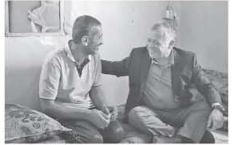
إربد - بترا

أعشى جلالته الملك عبدالله الثاني ظهيرة أول جمعة من شهر رمضان المبارك بين الأهل في بلدة المهيبة في قضاء حراش جلالته على التواضع المستمر مع المواطنين وقائد، أحوالهم، خصوصا في الشهر الفضيل. وشركه جلالته الملك جموع المسلمين أبناء سلاط الجمعة في مسجد البرهنة في البلدة تبعا