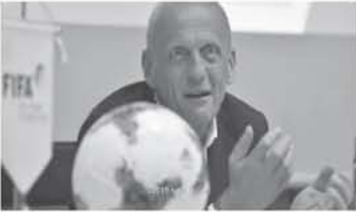
الرياض - وكالات

عمل الطواقم ويقدم مستوياتها، يذكر أن إدارة الاتحاد السعودي السابق برئاسة عادل عزت، سعت لتجيب كولينا في نفس الفترة من العام الماضي ولم تكتمل المفاوضات، فيما تم الاتفاق هذه المرة فوراً بدعم مباشر من فيفا، ويحتل النصر صدارة دوري كأس الأمير محمد بن سلمان، برصيد 61 نقطة، فيما يتخلف عنه الهلال صاحب الوصافة بنقطة واحدة.