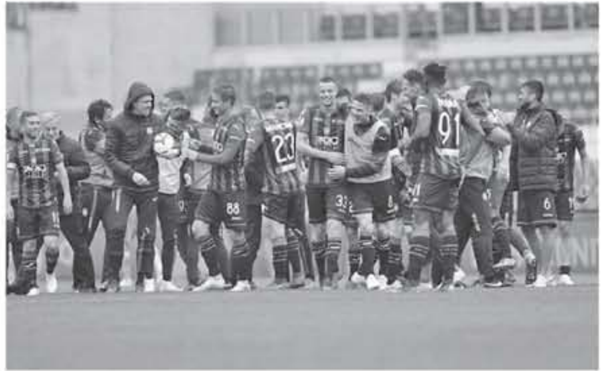
روما - وكالات

وفي مباراة اليوم سيلتقي مدربه جيان جامبريني مع جنوة الذي أمضى بين صفوفه ٤ سنوات وحقق تحت قيادته نتائج أعلى من إمكاناته، بما في ذلك احتلال المركز الخامس في ٢٠٠٨-٢٠٠٩، وفصل جامبريني، "على المستوى الشخصي لست سعيداً بمواجهة جنوة في هذه المرحلة، لكنها مباراة مهمة حقاً من أجل دوري الأبطال". وأعلن ميلان، الذي يسعى لوضع حد لغيابه منذ ٥ سنوات عن دوري الأبطال، آماله بالفوز ٢-١ على بولونيا يوم الإثنين الماضي، ويزور فيورنتينا اليوم السبت، كما يلتقي روما على أرضه مع يوفنتوس البطل الذي حسم اللقب قبل ٥ جولات على النهاية وودع دوري الأبطال من دور ٨. ٨