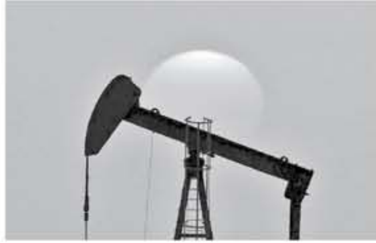
٦٢.٤٩ دولار للبرميل في وقت سابق ويتجه خام برنت وخام غرب تكساس الوسيط لتحقيق مكاسب محدودة على أساس أسبوعي.

ارتفعت أسعار النفط أمس الجمعة حتى في الوقت الذي تسبب فيه بدء تنفيذ زيادة أمر بها الرئيس الأمريكي دونالد ترامب للرسوم الجمركية على سلع صينية بقيمة 200 مليار دولار في إنشاء التوترات مرتفعة في النزاع التجاري بين أكبر اقتصادين في العالم. وارتفعت العقود الآجلة لخام القياس العالمي مزيج برنت ٧٧ سنتاً إلى ٧١.٠٦ دولار للبرميل، بعد أن لامست المستوى المرتفع البالغ ٧١.٢٣ دولار للبرميل. وصعدت العقود الآجلة لخام غرب تكساس الوسيط الأمريكي 2٥ سنتاً إلى ٦٢.٠٥ دولار للبرميل بعد أن بلغت