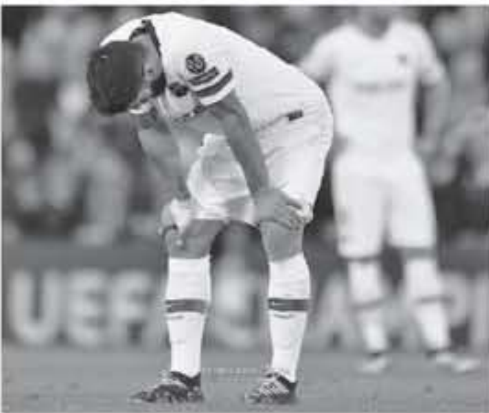
برشلونة - وكالات

برشلونة، "الهجوم الأوروغواياني سيغيب عن الملاعب بسبب الإصابة لفترة تمتد من 4 إلى 6 أسابيع". وتابع: "لن يتمكن سواريز من خوض المباريات الثلاث المقبلة لبرشلونة هذا الموسم، وهي أمام خيتافي وإيسار في الليغا وضد فالنسيا في نهائي كأس ملك إسبانيا". يذكر أن برشلونة ودع بطولته دوري أبطال أوروبا مؤخراً، بعد الخسارة أمام ليفربول بنتيجة 4-0، في إياب الدور نصف النهائي.