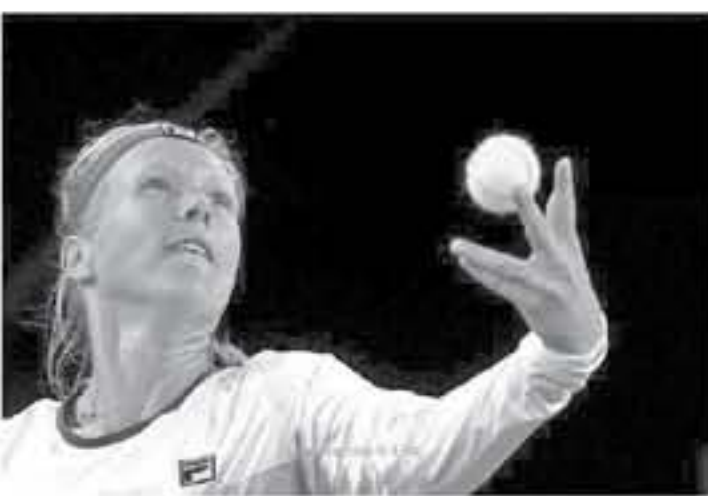
مدريد - وكالات

بنتائج مجموعات ٢-٦ و ٣-٦، في مباراة استغرقت ٧٩ دقيقة، لتلعب نصف نهائي مدريد المفتوحة وباتني فوز اللاعب الهولندي بعد سقوطها الأسبوع الماضي أمام كفيثوفا أيضاً في نصف نهائي بطولة ستوتجارت بألمانيا.