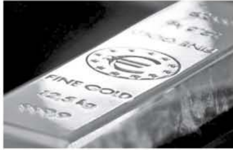
واشطن قدام في خطط زيادة الرسوم على سلع مستوردة من الصين بقيمة مئات المليارات من الدولارات. وانخفض الذهب لأدنى مستواه منذ نهاية ديسمبر كانون الأول في أواخر الأسبوع الماضي، لكنه ارتفع 1.٤ بالمئة

تماثرت أسعار الذهب أمس الجمعة، متقلبة المدغم من تزايد التوترات التجارية بعد أن دخلت زيادة الرسوم الجمركية أمر بها الرئيس الأمريكي دونالد ترامب على سلع صينية بقيمة 200 مليار دولار حيز التنفيذ، مما يضع المعدن النفيس على مسار تحقيق مكسب أسبوعي. و استقر الذهب في المعاملات الفورية عند 1281 دولاراً للأوقية (الأونصة) مرتفعاً نحو 0.1 بالمئة في الأسبوع. كما تماثرت العقود الأمريكية الآجلة للذهب أيضاً عند 128٥ دولاراً للأوقية. ودخلت زيادة أمر بها الرئيس الأمريكي دونالد ترامب للرسوم الجمركية على بضائع صينية بقيمة 200 مليار دولار إلى حيز التنفيذ يوم الجمعة، وقالت بكن إنها ستدرس، مما يقاوم التوترات في الوقت الذي يجري فيه الطرفان