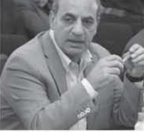
مهاجمها، ولتحديد ارتباط الوحدات التنظيمية فيها، وأساليب الاتصال والتنسيق فيما بينها.