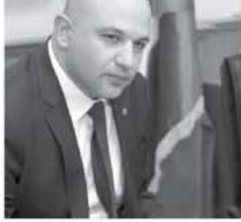
الرقم والريادة لسنة ٢٠١٩، وذلك لتحديد المهام المناطة بكل الوزارتين وصلاحياتها، ووضع هيكل تنظيمي يتّهم

أقرت اللجنة القانونية الوزارية أمس الأحد أربعة مشاريع أنظمة لوزارتي الإدارة المحلية والاقتصاد الرقمي والريادة، وأحالتهما إلى مجلس الوزراء لإقرارها حسب الأصول. وروافقت اللجنة على نظام لوثي وزير الإدارة المحلية مهام وزير الشؤون البلدية وصلاحياته لسنة ٢٠١٩، ونظام لوثي وزير الاقتصاد الرقمي والريادة مهام وزير الاقتصاد الرقمي والريادة، وتكنولوجيا المعلومات وصلاحياته لسنة ٢٠١٩، ويأتي النظامان نظراً لعدد الأمانة العامة للمحلية السامية بتعيين وزير الإدارة المحلية ووزير الاقتصاد الرقمي والريادة، وتحديد الوزير الذي يتولى المهام والصلاحيات التي كانت موكولة لوزير الشؤون البلدية ووزير الاتصالات وتكنولوجيا المعلومات المنصوص عليها في التشريعات الناظمة.