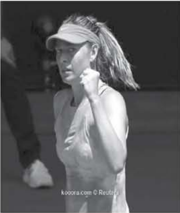
koora.com © Reuters