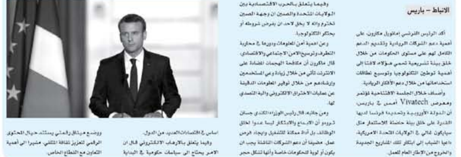
الانباط - باريس

أكد الرئيس الفرنسي إيمانويل ماكرون، على أهمية دعم الشركات الرائدة وتقديم الدعم التام لهم على مستوى الحكومات من خلال خلق بيئة تشريعية تحمي هؤلاء لافتاً إلى أهمية توطيق التكنولوجيا وتوسيع نطاقات استخدامها من خلال دعم الأفكار الريادية. وأضاف خلال الجلسة الافتتاحية لؤتمر ومعرض Vivattech أسمى في باريس، أن الدولة الأوروبية وتحدده فرنسا لديها القدرة على خلق بيئة حاضنة للاختلاف مثل سايكون نمالي في الولايات المتحدة الأمريكية، داعياً الشباب إلى ابتكار تلك المشاريع الجديدة والخروج من الإطار العام للعمل.