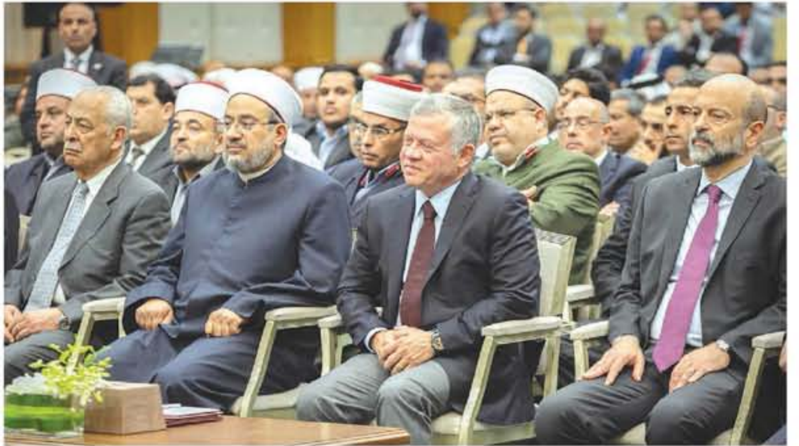
عمان - بتر

حضر جلالة الملك عبدالله الثاني في المركز الثقافي الملكي امس الجمعة، المجلس العلمي الهاشمي الثاني والتسعين منذ انطلاقه، والثاني لهذا العام بمنوان «خليفة رسول الله صلى