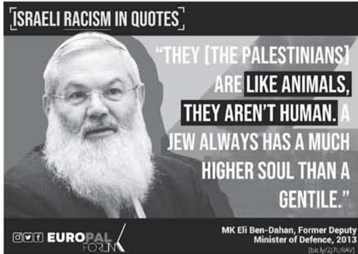
MK Eli Ben-Dahan, Former Deputy Minister of Defence, 2013 [bit.ly/2JURAV]

أطلق منتدى التواصل الأوربي للفلسطيني حملة إعلامية على مواقع التواصل الاجتماعي لتحمل عنوان "العنصرية الإسرائيلية من خلال الاقتباسات"، إحياء لتذكري 71 لتكثيف الشعب الفلسطيني وهي ذات المفكري لتأسيس دولة الاحتلال الإسرائيلي على أرض فلسطين التاريخية.