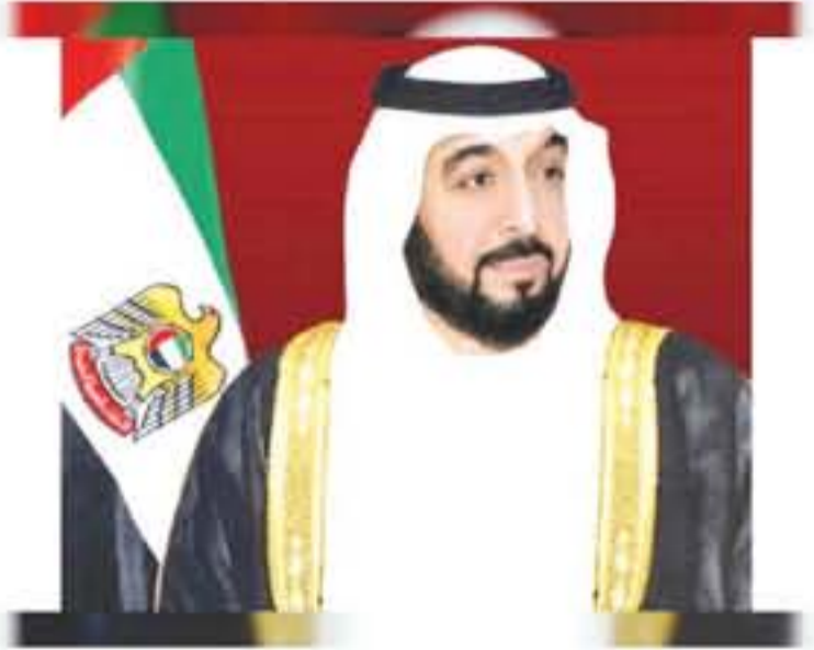
أوطبي - وكالات

أصدر صاحب السمو الشيخ خليفة بن زايد آل نهيان رئيس الدولة "حفظه الله" بصفته حاكماً لإمارة أبوظبي القانون رقم 16/ لسنة 2019، بشأن إنشاء هيئة أوطبي الرقمية. وتُنشأ بموجب أحكام هذا القانون هيئة تسمى "هيئة أوطبي الرقمية" ويكون لها شخصية اعتبارية مستقلة وتتمتع بالأهلية القانونية الكاملة للتصرف وتنتج مكتب أوطبي التنفيذي. وتحتل الهيئة محل مركز أوطبي للأنظمة الإلكترونية والمعلومات وتزاول إليها جميع أصوله وموجوداته وحقوقه والزاماته وتعتبر الخلف القانوني له. ونص القانون على أن تختص الهيئة في اقتراح السياسات العامة والحفظ الاستراتيجية والبيانات فيما يتعلق