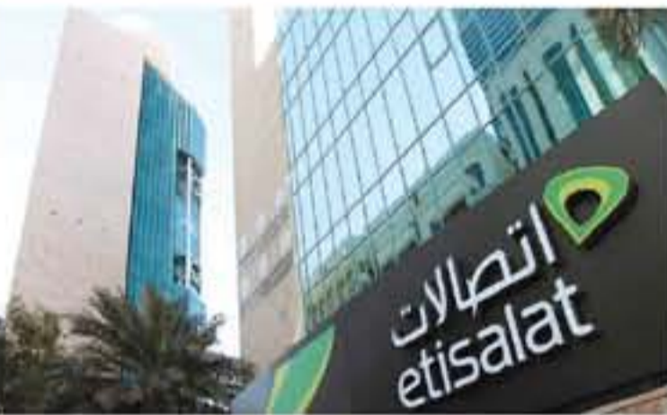
أوطبي - وكالات

كل عملية شحن بقيمة 30 درهماً أو أكثر، 100% للاستخدام، 200% تشاركته مع اثنين من الأصدقاء، وسيكون الرصيد الإضافي صالحاً لمدة يومين، وذلك لإجراء المعاملات المحلية والدولية وإرسال الرسائل النصية. وأوضح المتحدث، اتصالات، أنه يمكن لتعاملي نظام الدفع مقدماً، الاستفادة من هذا العرض عبر الاتصال على الرقم 101-300، قبل عملية إعادة الشحن بقيمة 30 درهماً أو أكثر، والاستمتاع برصيد إضافي، حتى تاريخ الثاني من يونيو 2019.