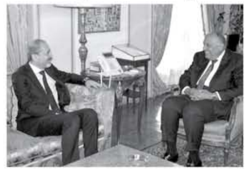
الانباط - القاهرة

الرئيس عبدالفتاح السيسي. وبحث الصفدي وسكري عدداً من المستجدات في المنطقة، وبم مقدمها تلك المرتبطة بالصراع الفلسطيني الإسرائيلي الذي يشكل حله على أساس حل الدولتين وفق قرارات الشرعية الدولية وسيادة القانون العربية السبيل الوحيد لتحقيق السلام الشامل. واستعرض الوزيران التطورات في جهود التوصل لحل سياسي للأزمة السورية والأوضاع في ليبيا واليمن. وأكد الصفدي وسكري استمرار التنسيق والتشاور من أجل حل الأزمات الإقليمية وتعزيز العمل العربي المشترك لمواجهة التحديات الراهنة وحماية الأمن القومي العربي وبخدمة المصالح والقضايا العربية.