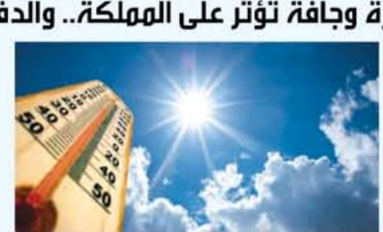
تعمل العظمى في مدينة العقبة إلى ٤٠ والصحري في عمان أمس ما بين ٣٣ - ٣٤ درجة مئوية، والمناطق الشمالية ٣٣ - ٣٤، والمناطق الجنوبية ٢٧ - ٢٨، فيما

السائفة كما دعيت المواطنين إلى الاتصال على هاتف الطوارئ الموحد ١٩١ إذا دعت الحاجة ونصحت المشيرة في بيان أمس الثلاثاء بعدم التعرض لأشعة الشمس مباشرة لتفادي الخطر الإصابة بضرورات الشمس والإجهاد الحراري، وارتداء الملابس الخفيفة والغضائفة ويفضل غير المكثف، ووضع أغطية الرأس الواقية والنبتات، واخذ قسط من الراحة خصوصاً الأشخاص العاملين في القطاعات الإنشائية أو الزراعية وعربي التواشي والمدن لكثاني مطربة عليهم البقاء تحت أشعة الشمس لتترات قوية وبخاصة في منطقة الأموار والعقبة .