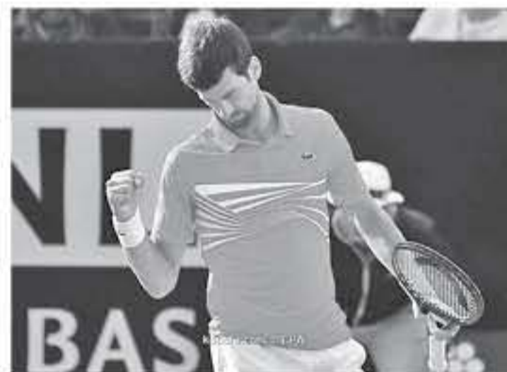
باريس - وكالات

شهرين ونصف على أهل تقدير، لايتحده عن أقرب ملاحقيه، راهاثيل نادال بفارق كبير. ويكجه نادال الأسبوع المقبل للدهاق عن لقبه في رولان جاروس، وبالتالي لن يتمكن من إضافة أي نقاط في رصيده، كما سيدافع بعدها عن وصولة إلى نصف نهائي بطولة رولان جاروس، بينما وقع ديوكوفيتش، رولان جاروس من ربع النهائي وتوج بلقب ويمبلدون، وبالتالي حسابياً، لا يمكن لنوفاك ديوكوفيتش أن يفقد صدارته للتلصيف العالمي، حتى بطولة سنشيانا للأستاذة في شهر آب المقبل.