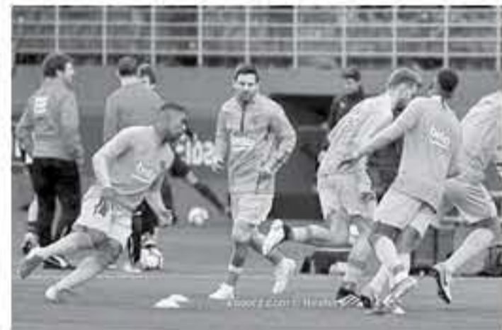
الجاري، بعدما أعلن باريس سان جيرمان الفرنسي، ومانشستر

يخطط برشلونة الإسباني، للتوقيع مع مهاجم جديد في فترة الانتقالات الصيفية المقبلة، بخلاف مواصلة السعي لجلب الفرنسي أنطوان جريزمان نجم أتلتيكو مدريد، والهولندي ماتياس دي ليخت، من أياكس. ووفقاً لصحيفة «موندو ديبورتيفو» الإسبانية، فإن برشلونة يسعى للتعاقد مع لاعب في مركز رأس الحربة الصريح، كن يملك لويس سواريز، الحذر الكلي من الراحة خلال الموسم، في ظل عدم وجود بديل له.