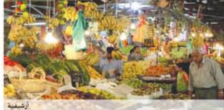
العملة لا إحدى وظائفها كونها مقياسا للقيمة. ودعا ان التضخم أيضا يخضع لعدة مؤشرات مباشرة منها السياسة المالية

مقارنة مع نفس الفترة من عام ٢٠١٨ والذي يشير أيضا إلى ارتفاع الرقم القياسي لأسعار المستهلك لشهر نيسان، ٢٠١٩ ليصل إلى ١٢٤,٨١ مقابل ١٢٤,٢٨ للنفس الشهر من عام ٢٠١٨. وهذا ما ساهم بشكل مباشر إلى ارتفاع أسعار المواد الغذائية حيث ارتفعت أسعار الخضروات والبقول الحافة والعلفية إلى ٥٠-٥٥ نقطة مئوية، والحبوب ومشتقاتها والألبان بمقدار ٢٢-٣٠ نقطة مئوية لكل منهما، والألبان ومشتقاتها والبيض والنشئ بمقدار ١٢-١٥ نقطة مئوية لكل منهما، والملايس بمقدار ٠,٦-٠,٦ نقطة مئوية.