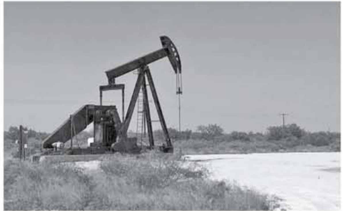
سنغافورة - وكالات

خسارة أسبوعية منذ بداية العام الجاري بعد أن تسبب ارتفاع المخزونات والقلق بشأن تباطؤ اقتصادي في التخفيضات كبيرة للحام في وقت سابق من الأسبوع.