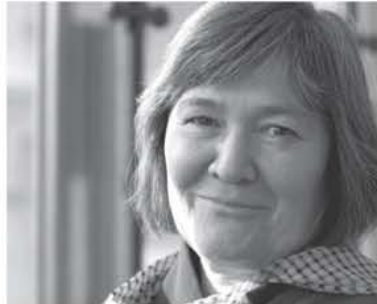
معاد للسامية - وقالت شورت لا يوجد عداة كبرى للسامية في الحزب وزعمت أنه يتم استهداف الفلسطينيين - وهاجمت

صعدت صحيفة جويتش كرونكل اليهودية المعارضة في لندن، على ما قالته كبير شورت ووزيرة التنمية الدولية في حزب العمال التي استغلت من منصبها بعد حرب العراق أن من يتعاطف مع مسافة الفلسطينيين يتم معاداة السامية ورفضت الإتهامات الموجهة لحزبها وأنه يعانى من مشكلة كراهية لليهود. وأشارت الصحيفة أن تصريحاتها أشارت لعنقا عندما قالت في برنامج نيوزنايت بالعداء الثانية ليس بي سي، حيث كانت تعلق على قرار معوضية حقوق الإنسان التحقيق رسمياً في عداة السامية داخل حزب العمال. وعندما سلكت على الإتهامات الموجهة للحزب قالت شورت ما حدث هو توسيع لتعريف معاداة السامية بحيث أصبح يشمل النقاد إسرائيل، وعليه أصبح أي شخص متعاطف مع مسافة الفلسطينيين