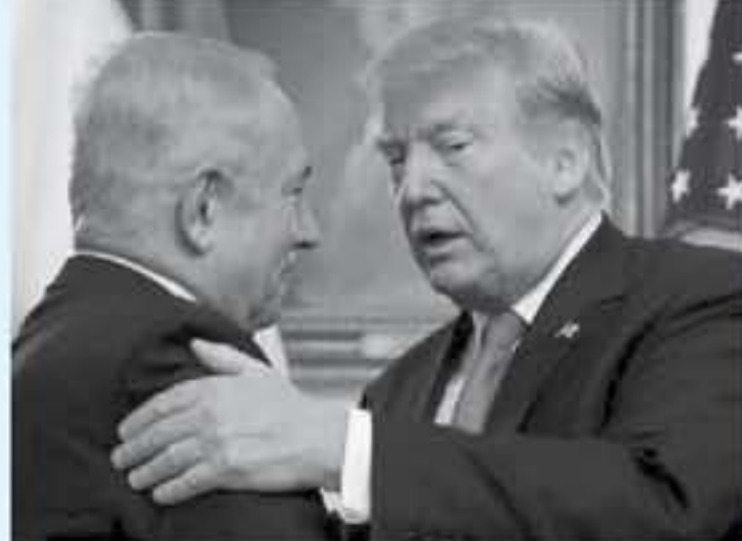
واشنطن - وكالات

كشفت تقارير إعلامية مختلفة، عن احتمالية تأجيل تقديم الجانب السياسي في الخطة الأمريكية المعروفة باسم «صفقة القرن»، وأن تواجد الصفقة التكاليف في ظل توتر المشهد الإسرائيلي، ما يمثل صدمة قوية للخطة الأمريكية قبل مولدها.