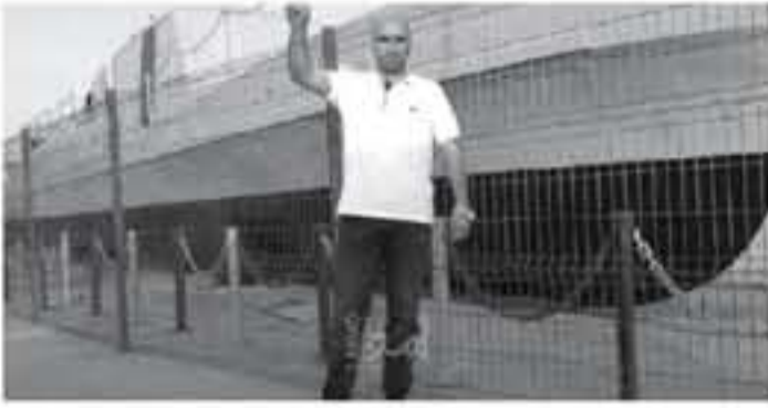
رأبم - وكالات

وتلتم إدارة المعتقلات بقله عدة مرات منذ إضرابه سواء من معتقل إلى آخر أو إلى المستشفيات المدنية التابعة للاحتلال في محاولة للضغط عليه وإفادته والتل من إرادته.