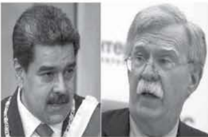
بروكسيل - وكالات

سلطانه بعدما ناك من تأييد حلق من طرف الجيش الذي رفض التآمر ضد البلاد مع واشنطن، بينما يفقد خوان غوايدو المخابرات التي يقدم عليها، ويصف أنصار الثورة البوليفارية أن خوان غوايدو يقوم بتجمعات سياسية هي أقرب إلى الأنشطة السياحية بعدما اعتد الجميع في فشل الانقلابات التي يشرف عليها.