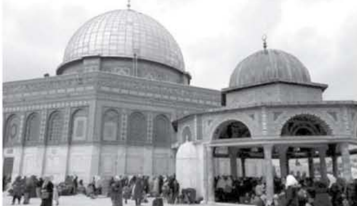
القدس المحتلة - وكالات

اعتبرت هيئات دينية فلسطينية أن إسرائيل تسعى إلى تغيير الوضع القائم في مدينة القدس المحتلة، تعقياً على الاتهامات أكثر من 1100 مستوطن يهودي بإحراق المسجد الأقصى واستنكر مجلس الأوقاف والشؤون والمؤسسات الإسلامية، والهيئات الإسلامية العليا، ودار الإفتاء الفلسطينية، ووزارة الأوقاف الإسلامية ووزارة قاضي الفضاة الاعتداء الإسرائيلي على المسجد الأقصى والمصلين.