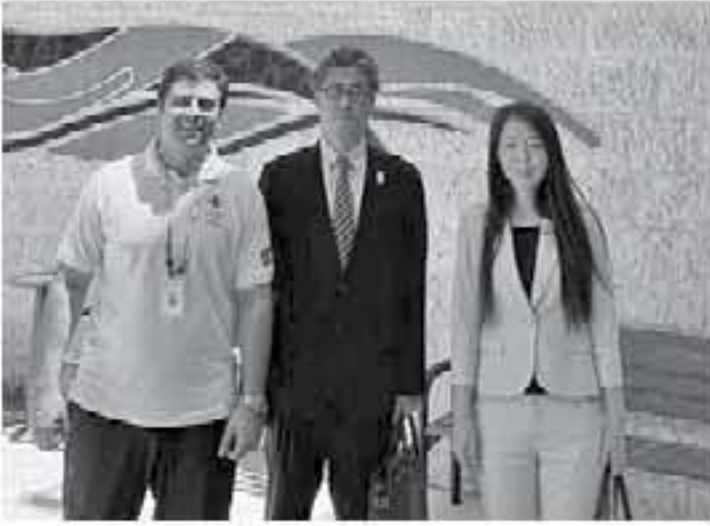
الأتباط - عمان

الجانب الياباني والأردني فيما يتعلق بالجمال الرياضي.