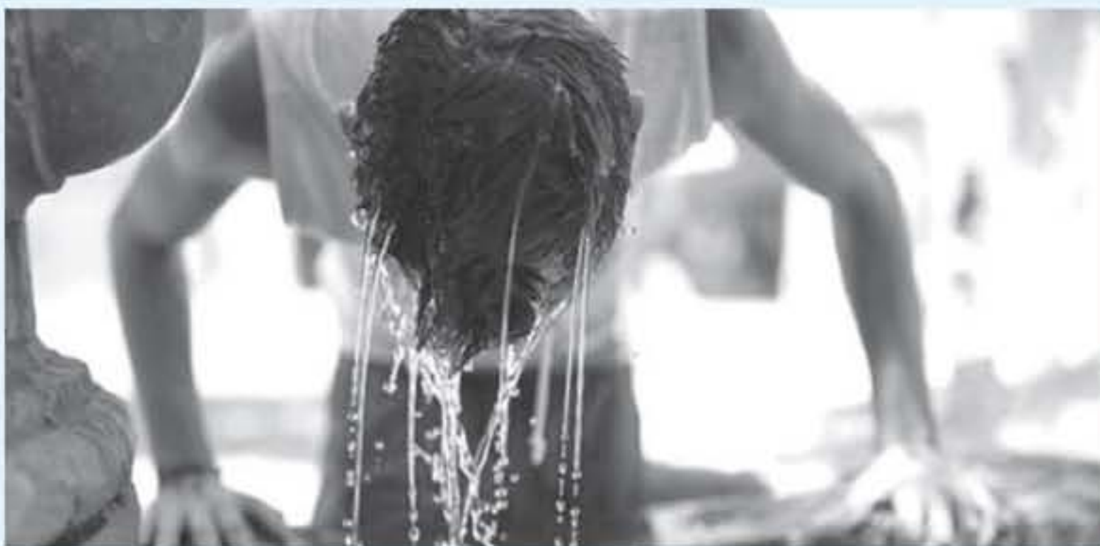
الأنباط - عمان

تشير التماذج العددية في دائرة الارصاد الجوية إلى نشأة المقلقة مع الاسبوع الاول من شهر حزيران بامتداد منخفض جوي سطحي حراري تصاحبه كتلة هوائية حارة نسبياً وجافة بالتزامن مع عقلة عيد الفطر المبارك.