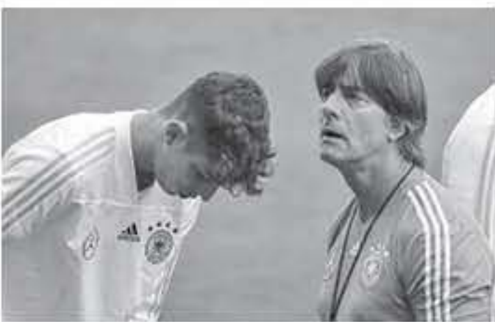
برلين