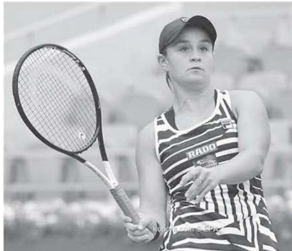
باريس - وكالات

تأهلت الأسترالية أشلي بارتي للمرة الأولى في مسيرتها الاحترافية إلى ربع نهائي بطولة رولان جاروس، وذلك بعد تغلبها على الأمريكية صوفيا كينين، بمجموعتين مقابل مجموعة واحدة بواقع (3-1) و(2-1). وتضرب بارتي موعداً، في ربع النهائي مع الأمريكية الأخرى ماديسون كيز، التي تغلبت بدورها على التشيكية كاتيرينا سينياكوفا، بمجموعتين دون رد بواقع (2-1) و(1-1). وتطلع كيز أمام بارتي إلى معادلة أفضل إنجاز لها في رولان جاروس، عندما وصلت إلى نصف نهائي العام الماضي، بينما جمعت أفضل نتائجها في البطولات الأربع الكبرى بالوصول إلى نهائي أمريكا المفتوحة عام 2017. أما بارتي فهدادت أفضل نتيجة لها في البطولات الأربع الكبرى، حيث سبق وأن وصلت إلى ربع نهائي بطولة أستراليا المفتوحة في شهر كانون الثاني الماضي. وسبق وأن تواجهت الملاعبتان مرتين من قبل، حيث هازرت كيز بالواجهة الأولى في الدور الأول من بطولة رولان جاروس عام 2017، وحسمت بارتي الواجهة الثانية في الدور الأول من كأس الاتحاد هذا العام.