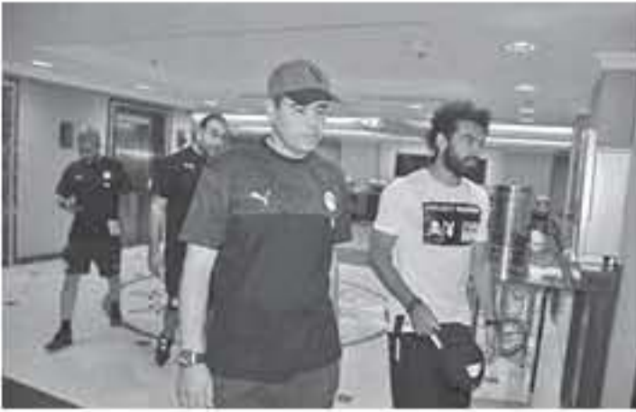
القاهرة - وكالات

انضم نجم المنتخب المصري محمد صلاح لعسكر القراعة أمس الأربعاء استعدادا لخوض نهائيات كأس الأمم الأفريقية 2019 التي تنطلق في القاهرة في 21 حزيران الجاري. وحصل صلاح على إجازة بعد تويجه مع ليفربول بدوري أبطال أوروبا، حيث تواجد في الفرقة لمدة أسبوع. وواجه صلاح انتقادات من جانب قطاع من الجماهير