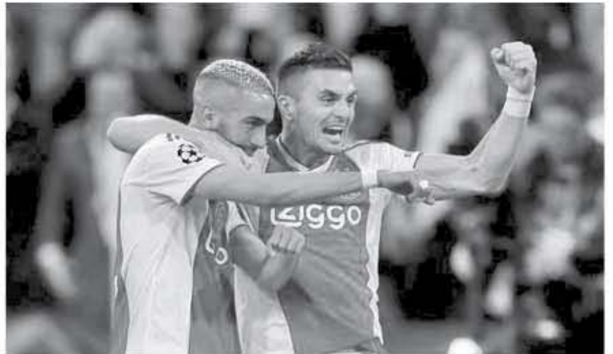
القاهرة - وكالات

تنتقل بطولة كأس الأمم الأفريقية في مصر، بداية من يوم 21 حزيران الجاري، وسط صراع منظر بين المنتخبات المشاركة على اللعب الفاري، خاصة أن البطولة تقام بمشاركة 24 منتخبا لأول مرة عبر تاريخ الكان. ولا تقتصر متابعة أمم أفريقيا على عشاق الساحرة المستديرة في القاهرة السمر، بل تحظف الكان أنظار محبي كرة القدم في العالم، خاصة أن النكهة الأوروبية تظهر في المفاصل لوجود العديد من نجوم الفارة السمر في أندية أوروبا، ولهم بصمات مؤثرة وصنعوا إنجازات كبيرة في الموسم المنصرم. ويضم ليفربول الإنجليزي حامل لقب دوري أبطال أوروبا، بين صفوفه 3 من أبرز نجوم الكان المنتظر تأتهم وابداعهم في البطولة، وهم محمد صلاح نجم منتخب