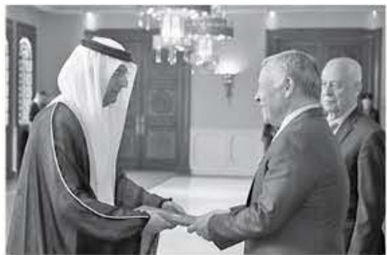
الأبواب - عمان