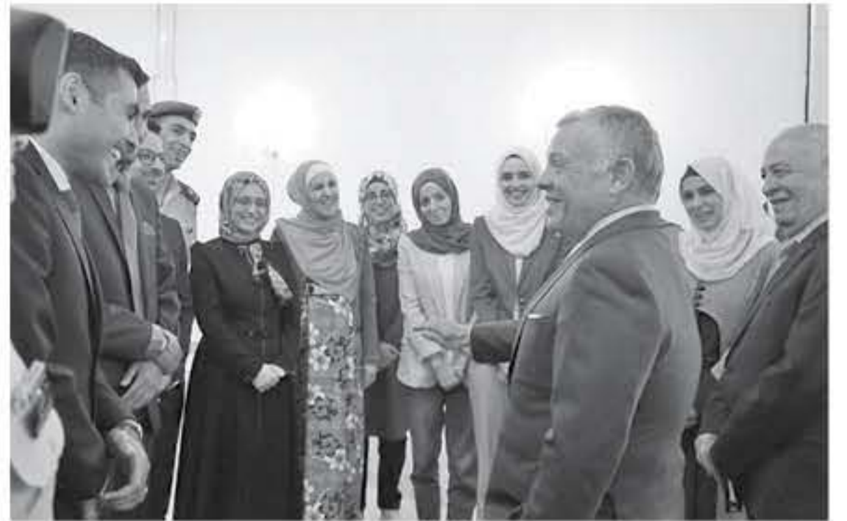
الأبواب - عمان استعداد جلالته الملك عبدالله الثاني

ومجموعة من الشباب والشابات ذكريات لقاء جمعهم قبل ١٧ عاما وكانوا وقتها أوائل الصف السادس من مختلف محافظات