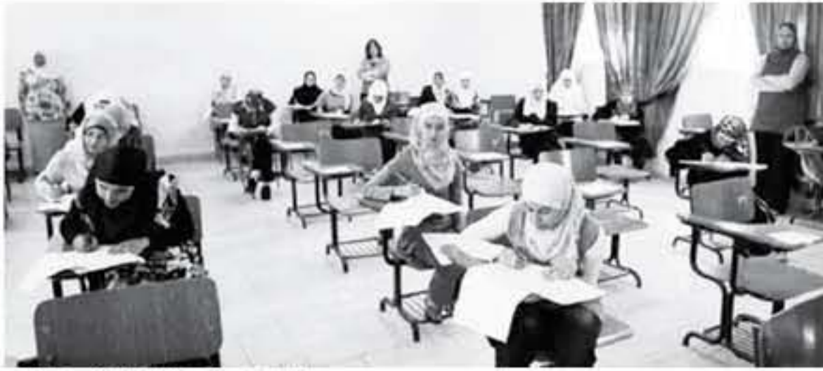
طالبات يؤدن امتحان الثانوية العامة - اريحية

الفرع الأدبي لامتحان ميحت (العلوم الاسلاميه/أساسيات ادارة/شهادة مائة/فرنسي)فيما تقدم طلبة الفرع الشرعي لامتحان ميحت (تفسير وعلوم القرآن/علوم شرعية) والبالغ عددهم ٣ طلاب، ويستخدم ٣ طلاب من فرع التعليم الصحي لامتحان ميحت التشريح. أما طلبة الفروع المهنية، فيتقدم ١٦٢ طالباً وطالبة من الفرع الصناعي لامتحان ميحت رسم صناعي، فيما يعتزم ١٥٧ طالباً وطالبة من الفرع الزراعي للمشاركة في ميحت الصناعات الزراعية، ويشارك ٨٤ طالباً وطالبة من الفرع المتكامل في امتحان ميحت الدوائر والتدبير.